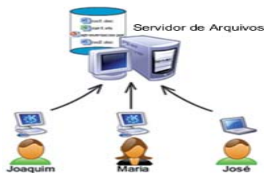
Figura 1 - Funcionamento do repositório central.