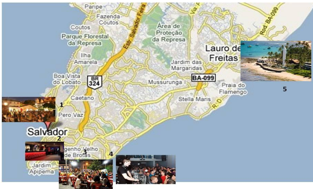
Figura 1 – Mapa “Territórios de Sociabilidade” – Salvador, 2011-2012

Legenda: 1 – Solar do União; 2 – Leopoldina; 3 – Dinha do Acarajé; 4 – San Sebastian; 5 – Praia do Forte