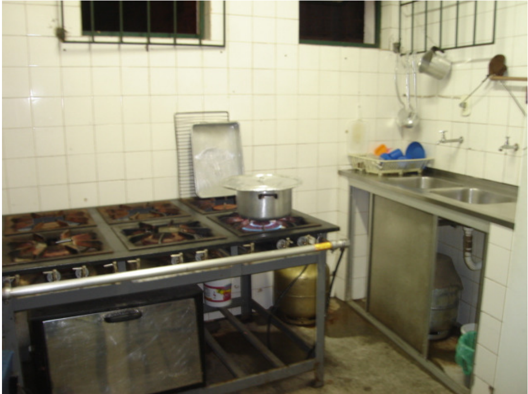
Foto 8: Sobra da alimentação servida à tarde sendo fervida para alunos da noite - Mingau de tapioca.