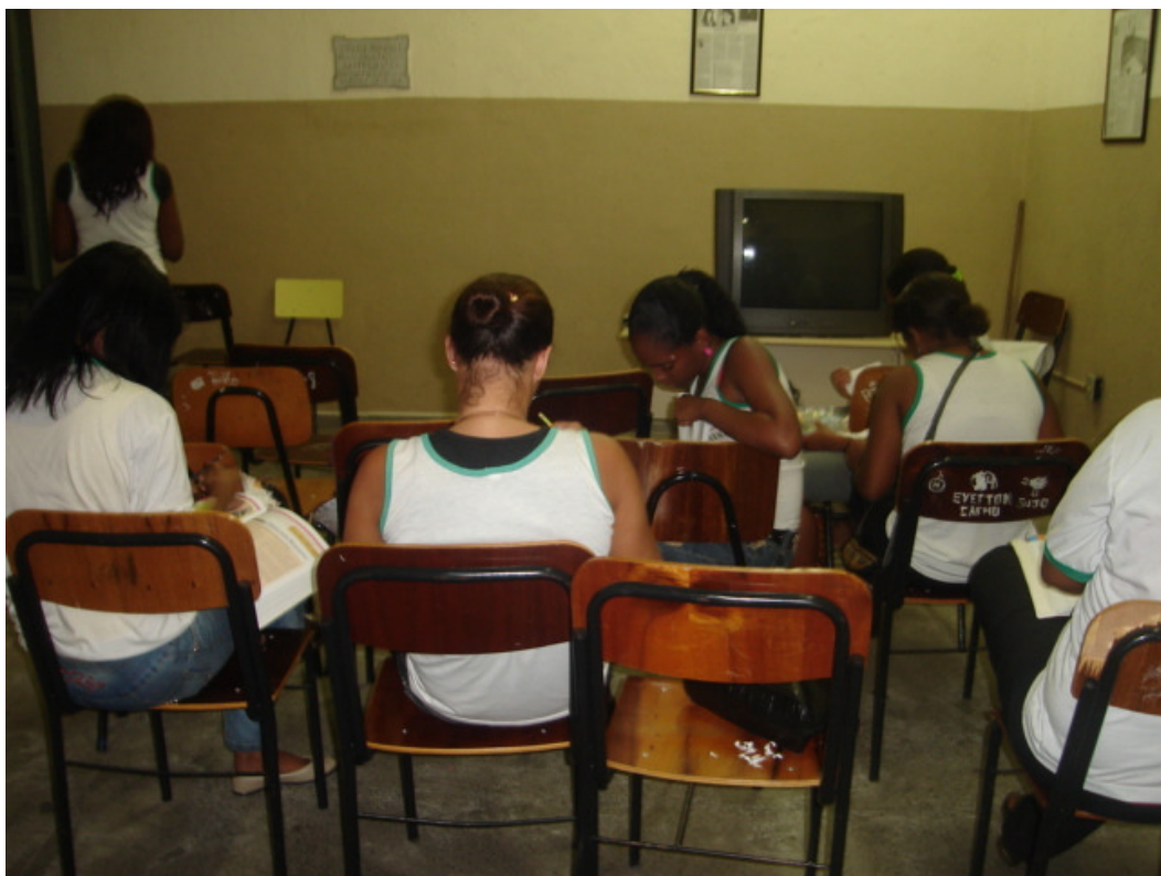
Foto 17: Turma do 3º ano A em aula na sala de vídeo, antigo quarto onde morreu o poeta Castro Alves