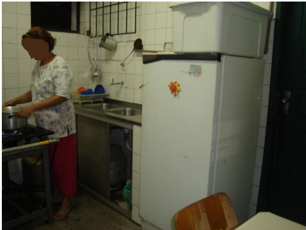
Foto 9: Funcionária da secretaria que distribui os alimentos à noite.