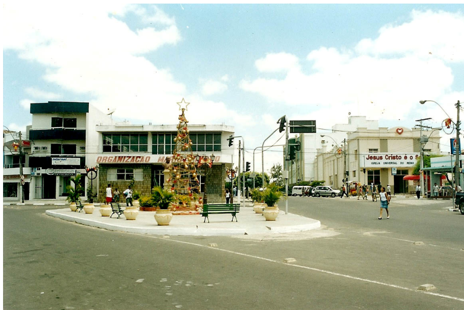
Figura 56 - Atualmente a Igreja Universal do Reino de Deus (à direita) impera no antigo Largo do Teatro, anos 90 (Fonte: acervo pessoal).

Por fim podemos dizer que esta é uma tentativa modesta de “reconstruir” a história de um edifício teatral no sertão baiano e as múltiplas funções que ele assume na comunidade que o gera e mantém 240 – das especulações em torno da construção à sua manutenção pela assiduidade e manifestação pública em sua defesa. Todas essas ações geraram, concretamente, pouquíssimas implicações no fazer cênico e mais na configuração utópica de uma “modernidade” tão desejada, nos seus primórdios, e na elaboração de símbolo de luta pela “preservação do passado”, nos seus últimos dias.