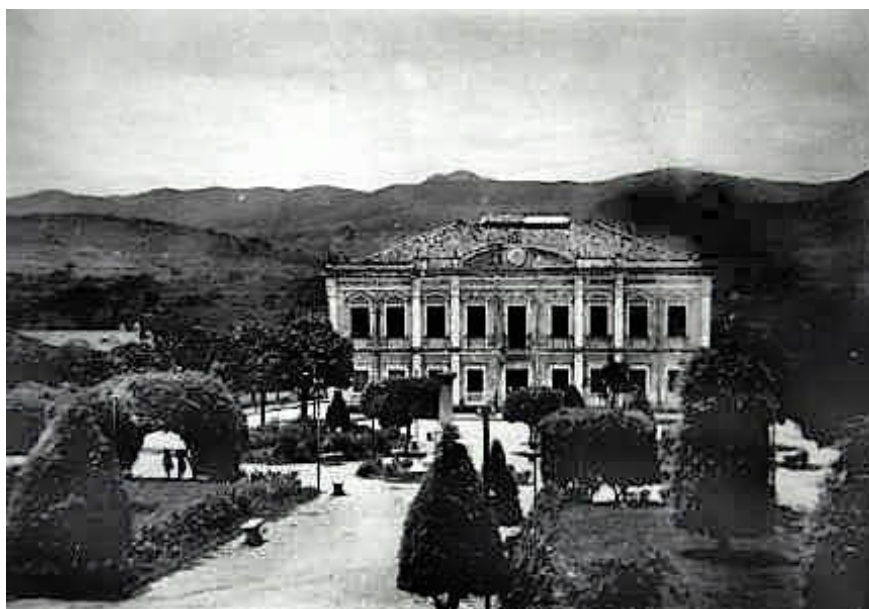
Figura 51 - Edifício Municipal, prédio que também abrigava um "teatrinho", início do século XX (Fonte: acervo Meló Carvalho).

A Sociedade 25 de Janeiro mantinha um grupo dramático e tinha uma sede que, ao que parece, não era apropriada para as representações teatrais, pois na ocasião da apresentação do drama Bohemia , em 03 de agosto de 1913, sua filarmônica “[...]... executou nos intervalos bonitas peças, tenho sido acompanhada, ao findar o espetáculo, até o seu edifício, entrevistas entusiásticas. [...]” (Sociedade 25 de Janeiro. Correio do Bonfim, n. 46, 10 de agosto de 1913, ano I, p. 2)