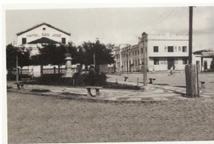
Figura 54 - O Largo do Teatro depois da reforma, primeira metade do século XX.