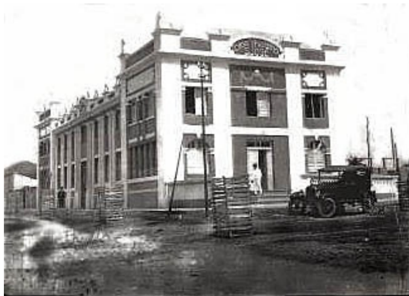
Figura 52 - Cine-Teatro São José, 1927

A inauguração do Cine-Teatro São José dividiu, em alguma medida, as diversões antes ocorridas no “Largo do Cine-Bonfim”, entre aquele lugar e a parte da cidade onde estava situada a nova casa de espetáculos, à qual, inclusive, daria o nome: o “Largo do Teatro 222 ” que mais tarde se transformaria na praça Dr. Antônio Gonçalves da Silva. Sobre este acontecimento Lanfranchi (2001 apud SERRONI 2002, p. 21), de forma muito perspicaz, observa que: