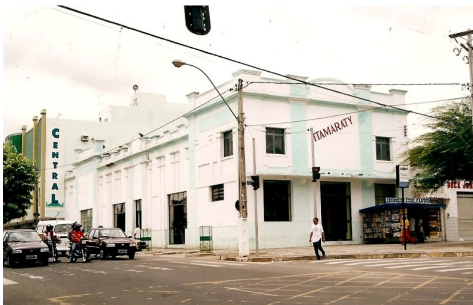
Figura 55 - A loja Itamaraty Eletromóveis ocupando o prédio do antigo Cine-Teatro São José, anos 80 (Fonte: acervo pessoal).

cinemas e igrejas de cultos evangélicos. Nossos teatros oficiais, porém, estão salvos deste desmonte cultural.” Aqui, podemos sonhar em deduzir que se a municipalidade, ao invés das míseras ações previstas no orçamento de 1913, tivesse assumido o ideal da construção do Teatro levado a cabo, a princípio pela Companhia do Teatro Tiradentes, transformando-o num Teatro Municipal, em voga na época 236 , ou se o Cônego Tolentino Silva, provedor da Irmandade Nossa Senhora da Piedade, por piedade, não o tivesse vendido para particulares, muito provavelmente o seu destino, mesmo prevendo todas as dificuldades, seria outro. Mesmo porque, na sua gênese, ele seria um Teatro e não um Cine-Teatro.