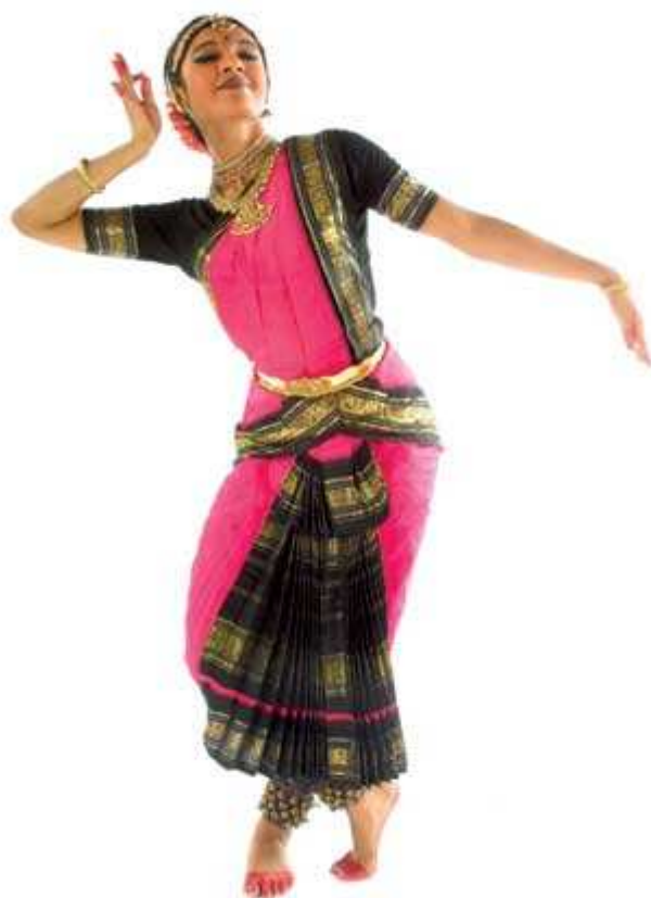
Figura 72 – Ouvindo