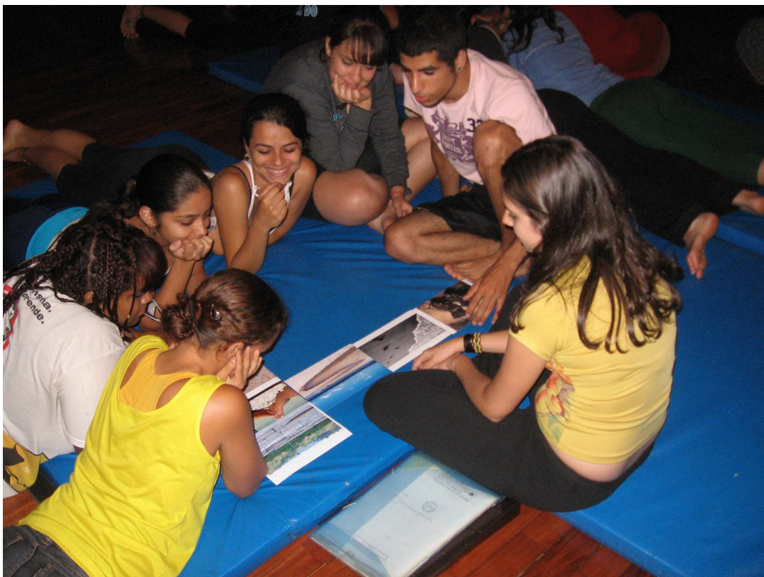
Figura 82 – Grupo 3