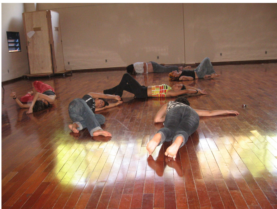
Figura 86 – Espaço livre – geral 2