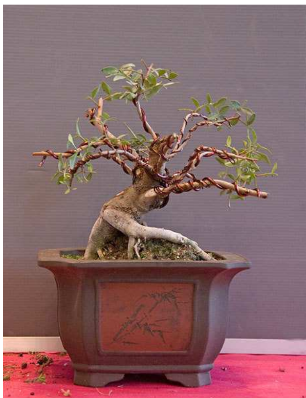
Figura 69 – Equilíbrio – bonsai