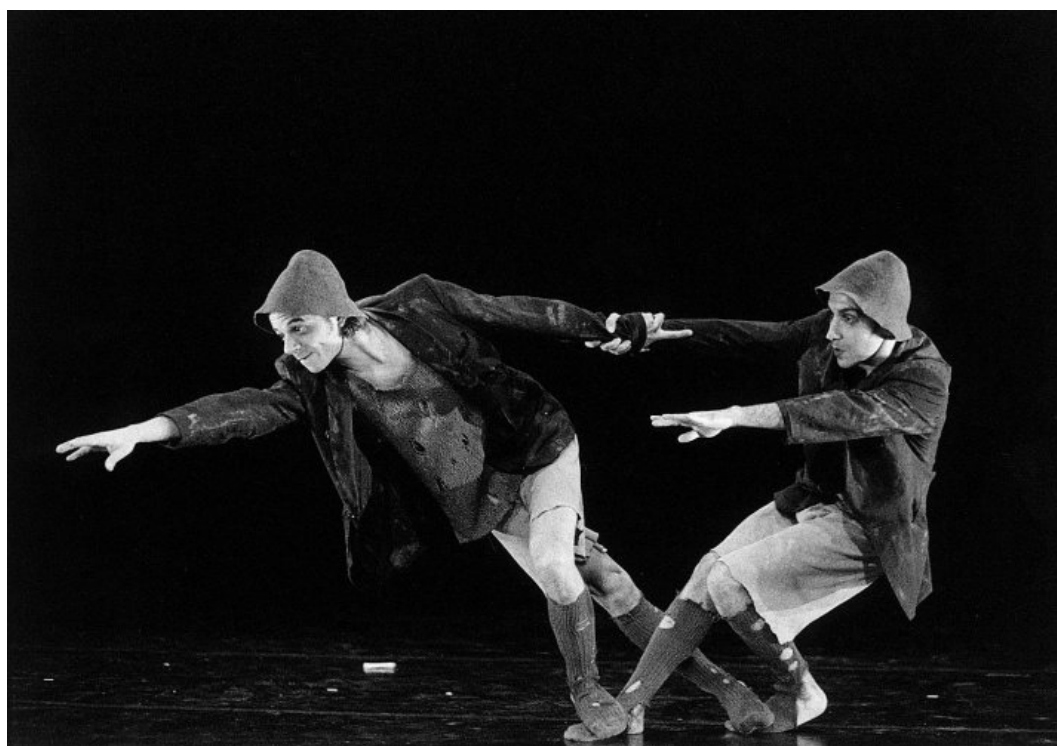
Figura 65 – Dos a deux – corrupio 2