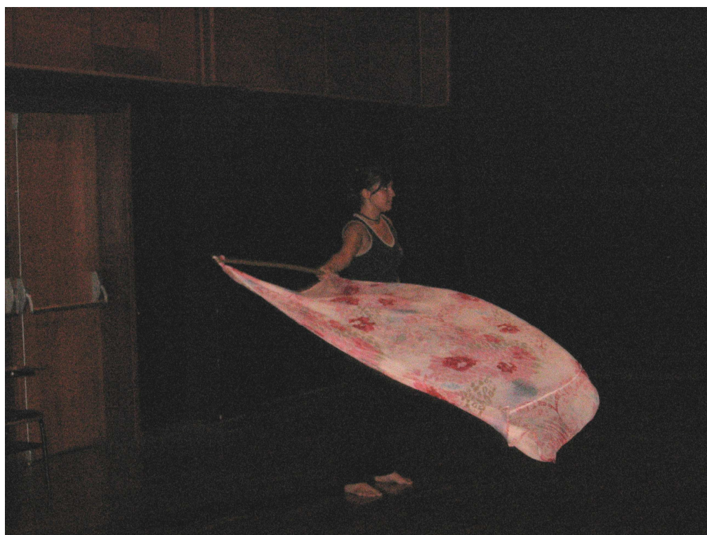
Figura 77 – Grupo 1 – bandeira/vento