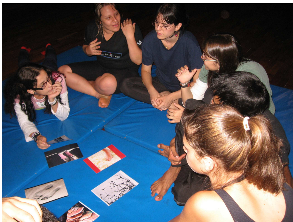
Figura 79 – Grupo 2