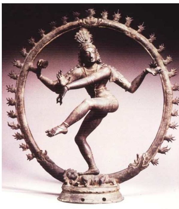
Figura 70 – Shiva