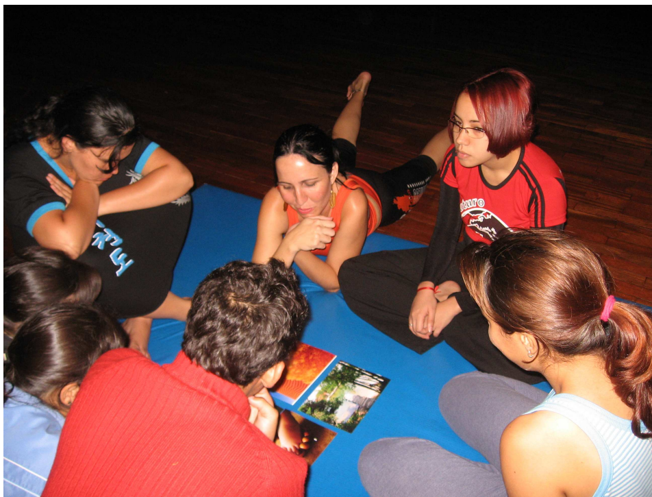
Figura 76 – Grupo 1