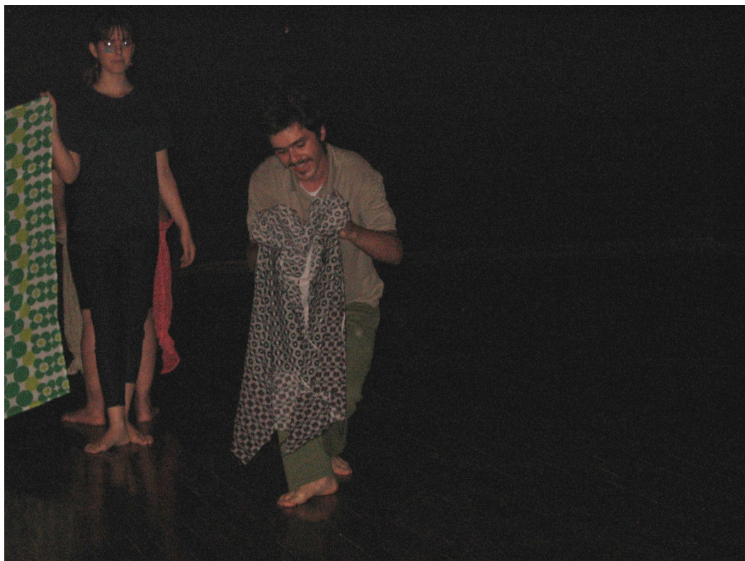
Figura 80 – Grupo 2 – circo – caminhada com flexão