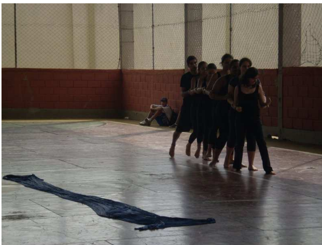
Figura 84 – Grupo 3 – canoa