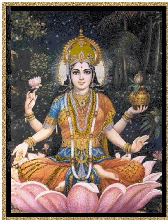
Figura 71 – Lakshmi