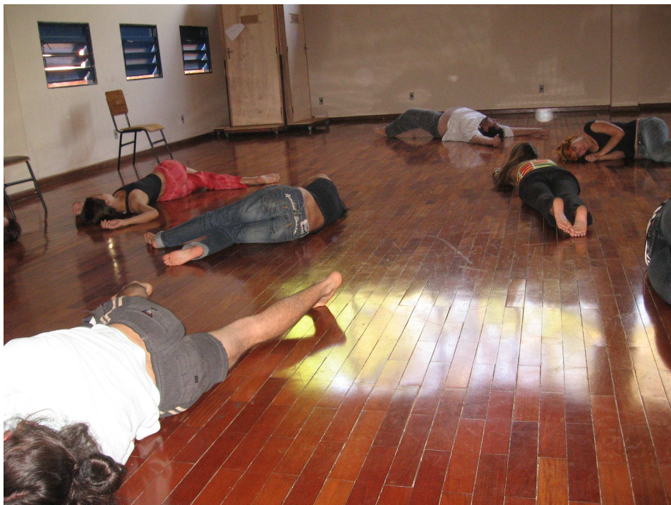
Figura 85 – Espaço livre – geral 1