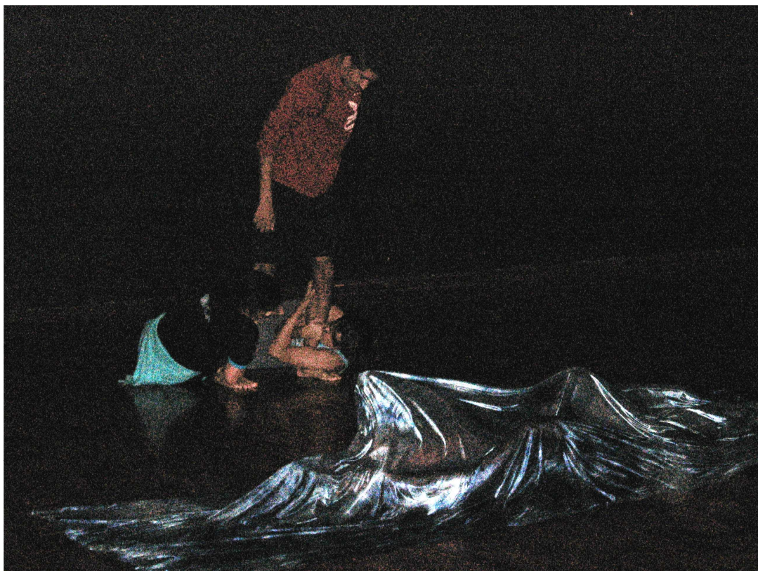
Figura 78 – Grupo 1 – aprisionamento e liberdade