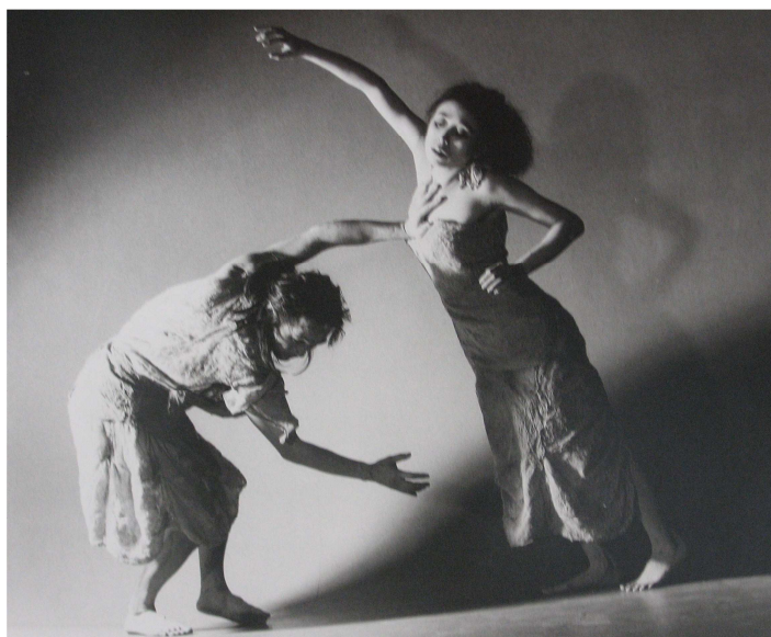
Figura 67 – Amparo 2