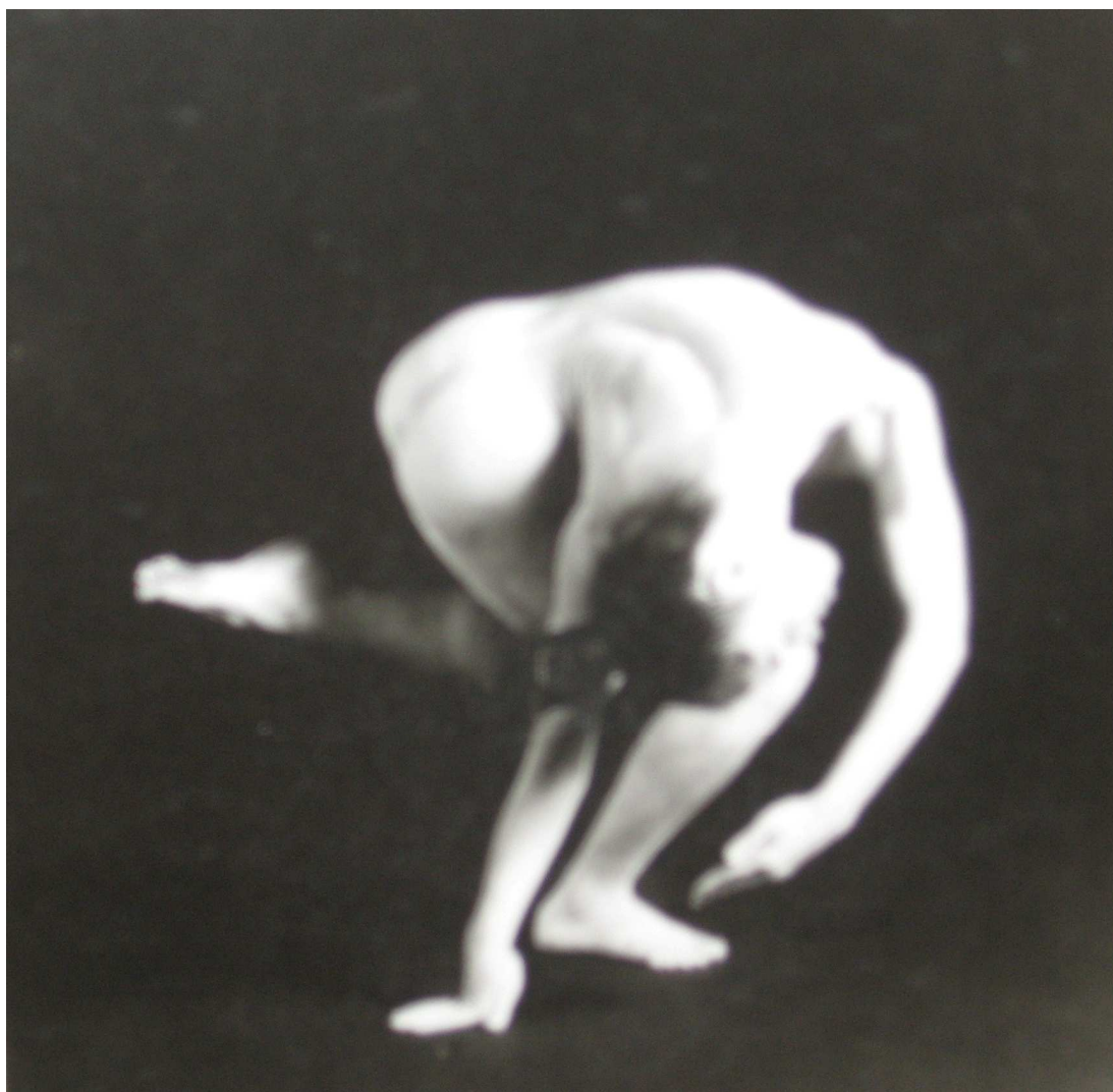
Figura 68 – Torção