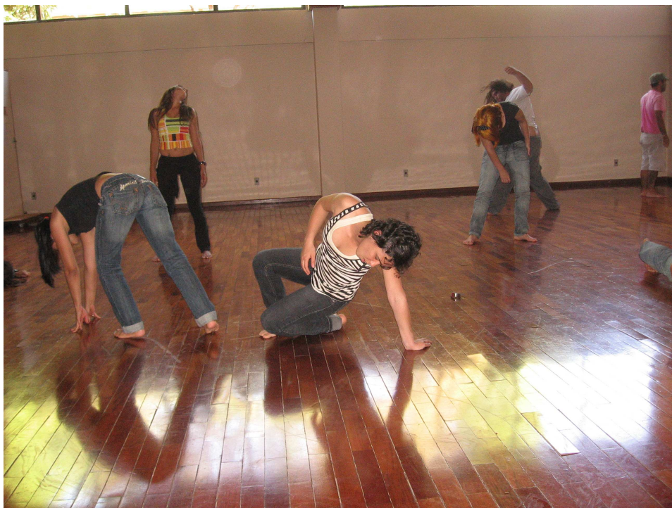
Figura 87 – Espaço livre – geral 3