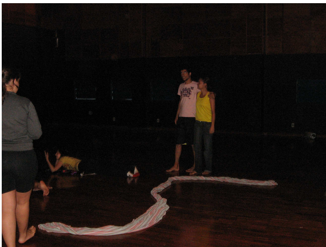
Figura 83 – Grupo 3 – 1ª versão do trabalho