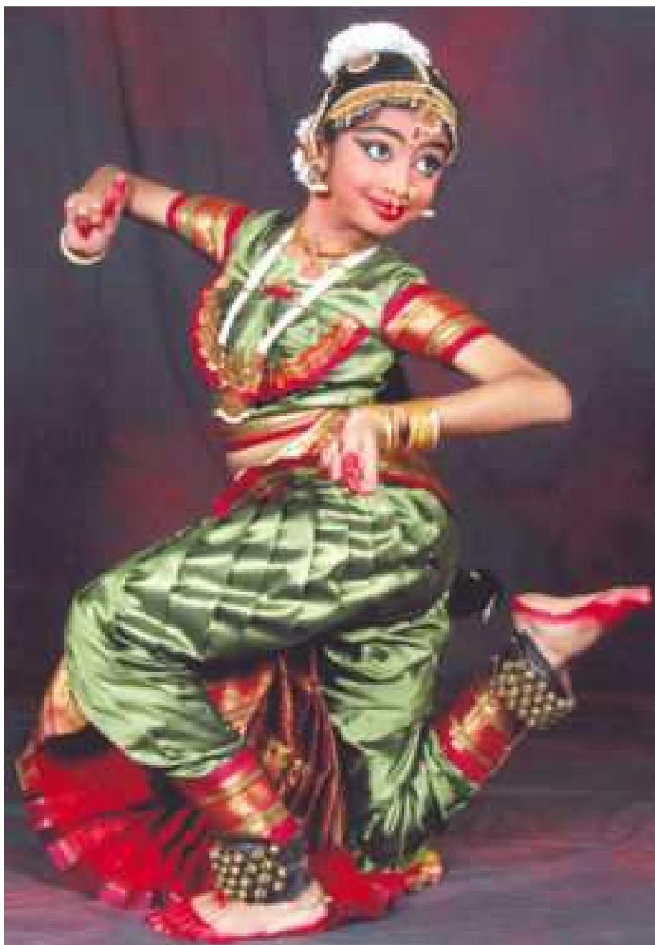
Figura 75 - Torção e equilíbrio