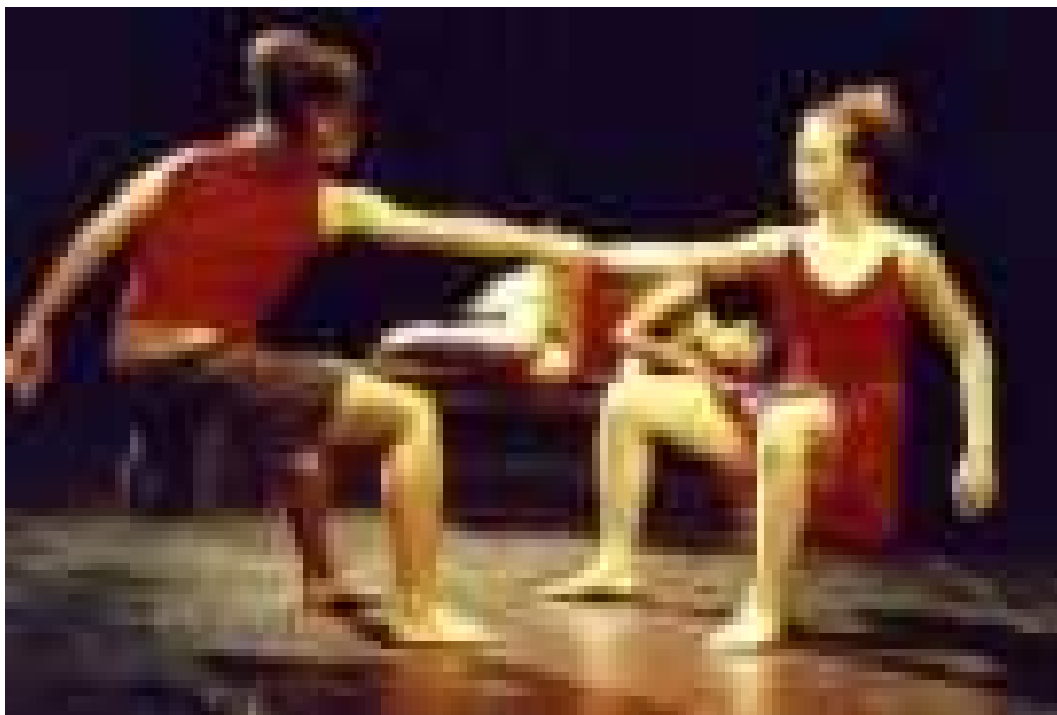
Figura 64 – Corrupio 1