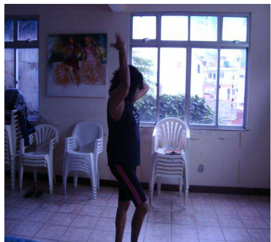
Fotografia 11: F. em uma das oficinas da Dançatar em 2009.

Voltando à referida teoria, há a ressaltar, ainda, a referência a uma demanda circular. Trata-se de uma espécie de [-...] encadeamento entre ação e experiência, essa inseparabilidade entre ser de uma maneira particular e como o mundo nos parece ser [...], todo ato de conhecer faz surgir um mundo” (MATURANA; VARELA, 2010, p. 31). Este ponto de congruência incessante nos seres humanos, o