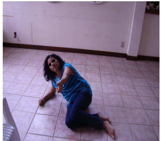
Fotografia 7: F. em uma das oficinas da Dançatar em 2009.