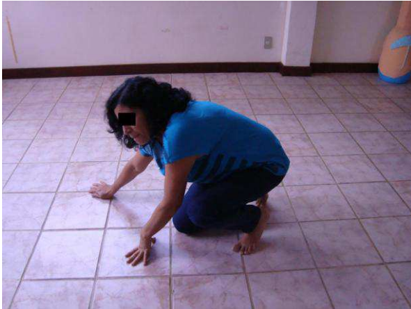
Fotografia 12: F. em uma das oficinas da Dançatar em 2009.