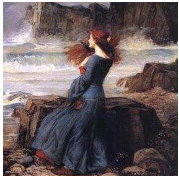
Figura 8: Mulher feiticeira.

Ameaçadora por possuir poderes análogos à natureza (figura 8), a quem não se podia controlar, a mulher denunciava todos os meses com o seu ciclo menstrual [...] o mal-estar dos homens diante daquela que se revelava uma feiticeira com capacidade para adoecê-los, mas também curá-los” (DEL PRIORE, 2009, p. 200). Isto porque ao sangue menstrual era atribuído o poder de cura de enfermidades. Ao mesmo tempo, a mulher menstruada com seus cheiros e secreções lembrava a possibilidade de morte pelo sangue derramado e pelo poder de transformar as características de elementos