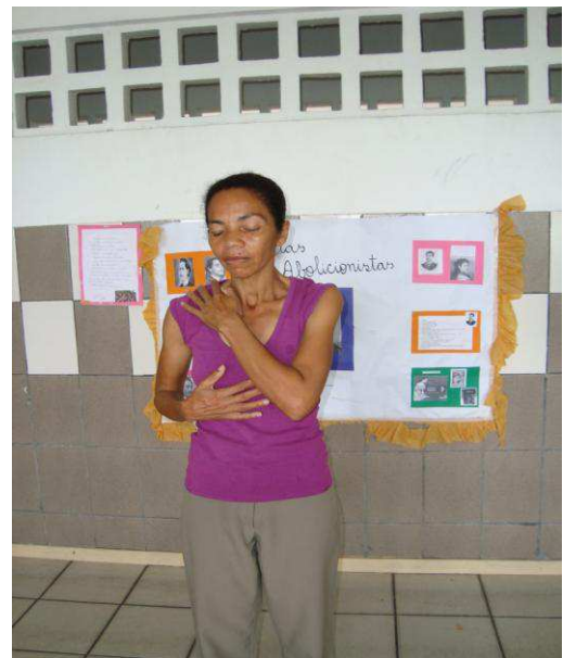
Fotografia 3: G. em uma das oficinas da Dançatar em 2010.

Na proposta da Dançatar, a mulher pode dançar os seus opostos na desconstrução de seus aspectos Eva e Lilith. A dança da sua Eva vai revelar onde se localizam os padrões femininos que serviram de modelo e promover as estranhezas necessárias a uma ressignificação deste modelo. Na Dançatar é pelo toque que a mulher experiencia primeiro o afeto (fotografias 3, 4 e 5), através da percepção das sensações, emoções e sentimentos guardados pela memória dos sentidos. Pelo toque, o exercício do afeto a si mesmo facilita o reconhecimento das marcas encarnadas oriundas dos modelos que serviram de referência na construção de seu feminino.