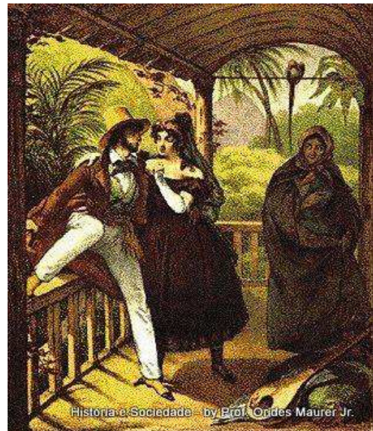
Figura 5: A mulher ideal para casar no período colonial. (—Cstumes do Rio de Janeiro”. J. B. Debret. 1768-1848)

Já as mulheres não férteis, ao contrário, eram consideradas malditas, por não conseguirem concretizar a procriação, objetivo social máximo do casamento. É