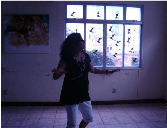
Fotografia 14: F. em uma das oficinas da Dançatar em 2009.

Segundo Maturana e Varela, nos homens porque possuem sistema nervoso, normalmente a conduta fica atrelada ao movimento, ou seja,