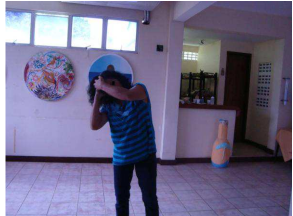
Fotografia 5: F. em uma das oficinas da Dançatar em 2009.