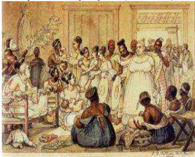
Figura 1: Representação do processo de domesticação da mulher. (J. B. Debret - 1768-1848).

Alguns mitos femininos foram ressignificados em nossa Terra