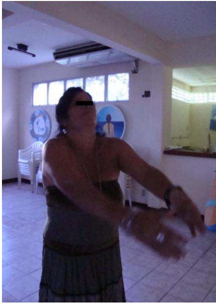
Fotografia 8: F. em uma das oficinas da Dançatar em 2009.