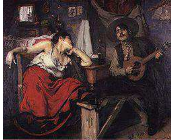
Figura 7: Amor fora do casamento.

consideradas inadequadas provocava um contingente de culpas variadas. Condenava-se toda e qualquer atividade que não estivesse diretamente vinculada aos cuidados com os filhos e o marido, a isso se incluem a conversa sobre assuntos familiares a quem não pertencesse à órbita da família ou visitas à Igreja com o objetivo maior de ver as comadres do que o de assistir à missa. Portanto, —Ficar à janela, cantar músicas populares, comentar sobre seus pretendentes [...] são motivo de chacota ou reclamação” (DEL PRIORE, 2009, p. 104), evitado a todo custo pelas mulheres que queriam se tornar Santas Mãezinhas. —A fabricação da ‘santa’ foi resultado da percepção que tiveram a Igreja e o Estado moderno da influência salutar ou pernicioso da mulher na família e na sociedade” (DEL PRIORE, 2009, p.107).