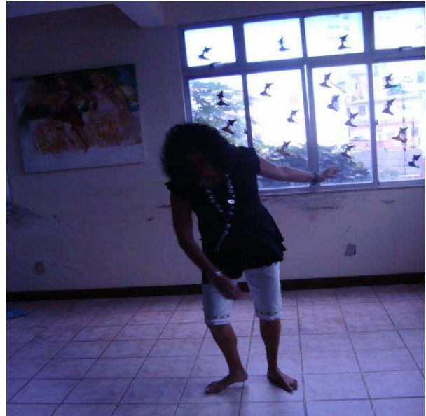
Fotografia 13: F. em uma das oficinas da Dançatar em 2009.