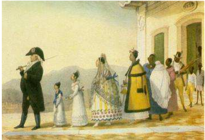
Figura 2: Arquétipos da Eva da Santa Mãezinha. (J. B. Debret - 1768-1848).

A mulher da Colônia era um misto de submissão e resistência. Aparentava aceitar as regras de normatização de sua vida feminina em favor do povoamento, mas fez do exercício da maternidade um novo lugar de poder, onde exercia uma autonomia discreta e estabelecia suas próprias leis de convívio. É importante ressaltar a ausência dos homens no cotidiano da vida privada devido aos constantes deslocamentos exigidos pela exploração da nova terra.