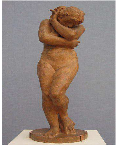
Fotografia 1: Auguste Rodin: Eva, 1881.

Tudo isso significa, no entanto, que os mitos estão sendo ressignificados. O mito é uma tentativa desesperada do ser humano em se manter vivo através da criação do sentido da existência. É também o mito que permite desestranhar o mundo em uma narrativa polissêmica porque ajuda o homem a desvendar a complexidade da vida. Nesse sentido, a canção citada anteriormente, de Milton Nascimento e Fernando Brant, continua presente apontando que