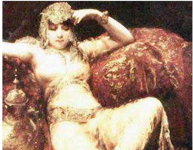
Figura 6: A Lilith colonial brasileira.

Entre estas mulheres postas à margem social (figura 6), se destacavam as que possuíam amantes, casados ou não, e as prostitutas. Estas eram avessamente valorizadas por homens em busca de mulheres que pudessem lhes dar prazer, já que com as Santas Mãezinhas com quem contraíram matrimônio não tinham este direito.