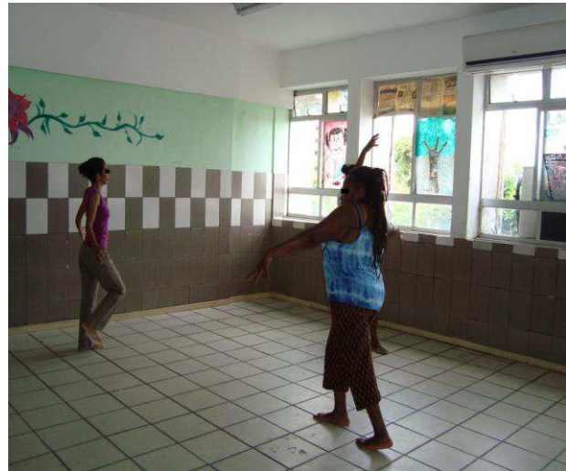
Fotografia 10: G., C. e M. (ao fundo) em uma das oficinas da Dançatar em 2010.

As potencialidades femininas não encontram mais tempo de espera. Por isso, a mulher que dança entre a Eva e a Lilith encontra na ausência ou no vazio latente, os símbolos femininos que a auxiliam no processo do despertar da consciência (fotografia 10), ou dito de outra maneira, em sua forma de eleger que parâmetro vai utilizar para fazer escolhas e distinguir o mundo. Portanto, ao se entregar à força real da tensão dos contrários a consciência adquire uma possibilidade de expansão, pois, somente quando as oposições são assimiladas é que a consciência se atualiza. Com respeito a este argumento Hurwitz (2006, p. 162) diz, “No curso do progressivo processo de despertar da consciência, as oposições inerentes são colocadas à parte, com o resultado de que elas podem ser distinguidas pela consciência, que sempre pensa e percebe por oposições.”