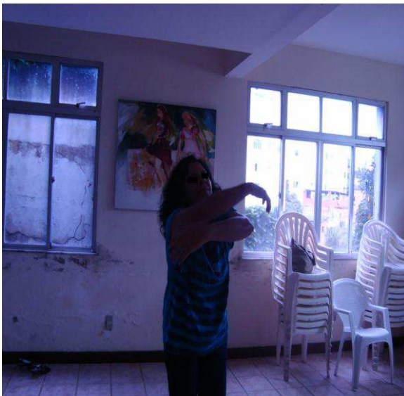
Fotografia 6: F. em uma das oficinas da Dançatar em 2009.

Na dança da sua Lilith, a mulher possibilita o encontro com os potenciais que estão ocultos nas sombras (fotografias 6 e 7).