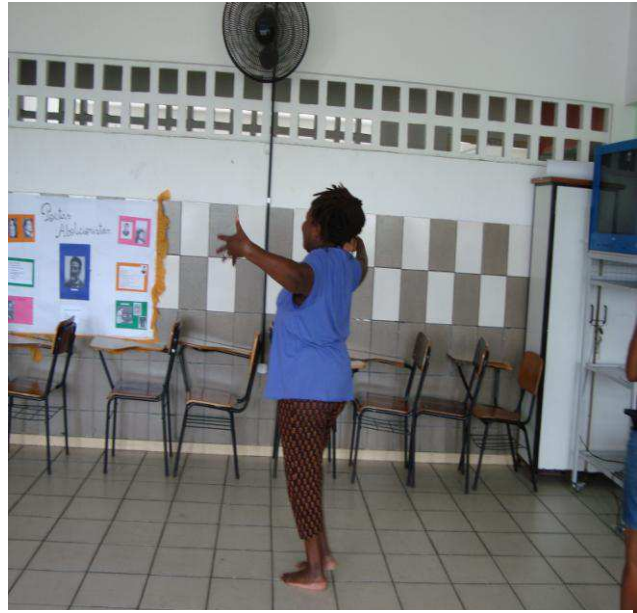
Fotografia 9: C. em uma das oficinas da Dançatar em 2010.

As potencialidades femininas não encontram mais tempo de espera. Por isso, a mulher que dança entre a Eva e a Lilith encontra na ausência ou no vazio latente, os símbolos femininos que a auxiliam no processo do despertar da consciência (fotografia 10), ou dito de outra maneira, em sua forma de eleger que parâmetro vai utilizar para fazer escolhas e distinguir o mundo. Portanto, ao se entregar à força real da tensão dos contrários a consciência adquire uma possibilidade de expansão, pois, somente quando as oposições são assimiladas é que a consciência se atualiza. Com respeito a este argumento Hurwitz (2006, p. 162) diz, “No curso do progressivo processo de despertar da consciência, as oposições inerentes são colocadas à parte, com o resultado de que elas podem ser distinguidas pela consciência, que sempre pensa e percebe por oposições.”