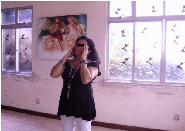
Fotografia 4: F. em uma das oficinas da Dançatar em 2009.