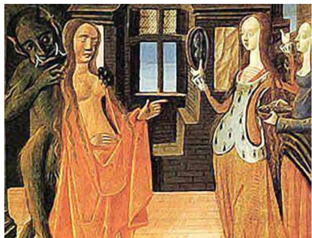
Figura 4: Mãezinhas adestradas x mulheres libertárias.