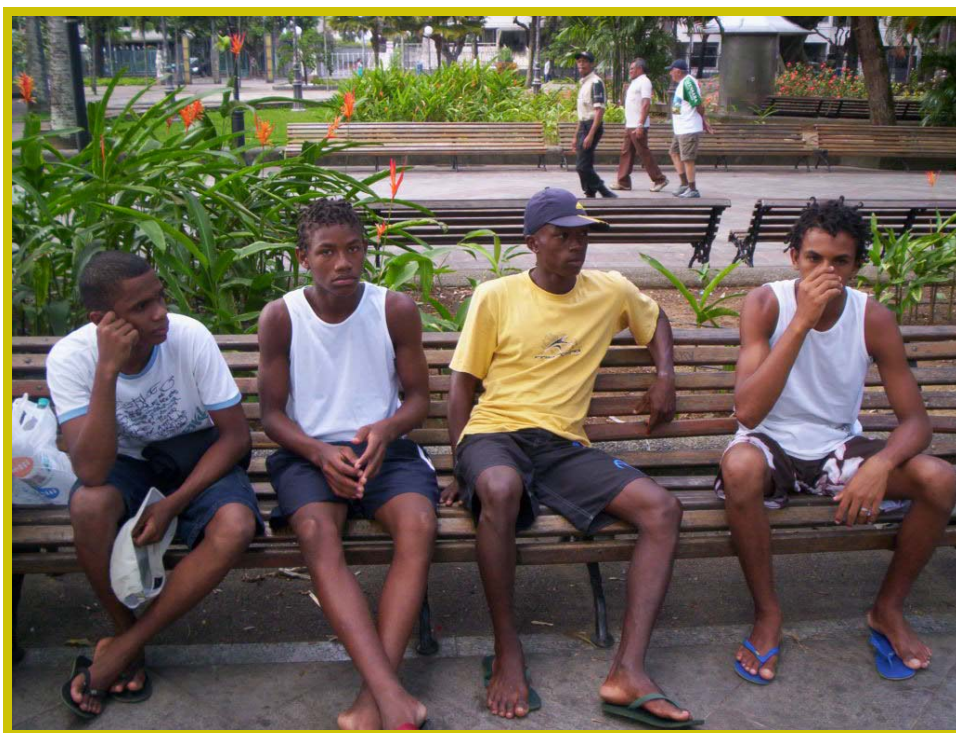
Salvador, 2006