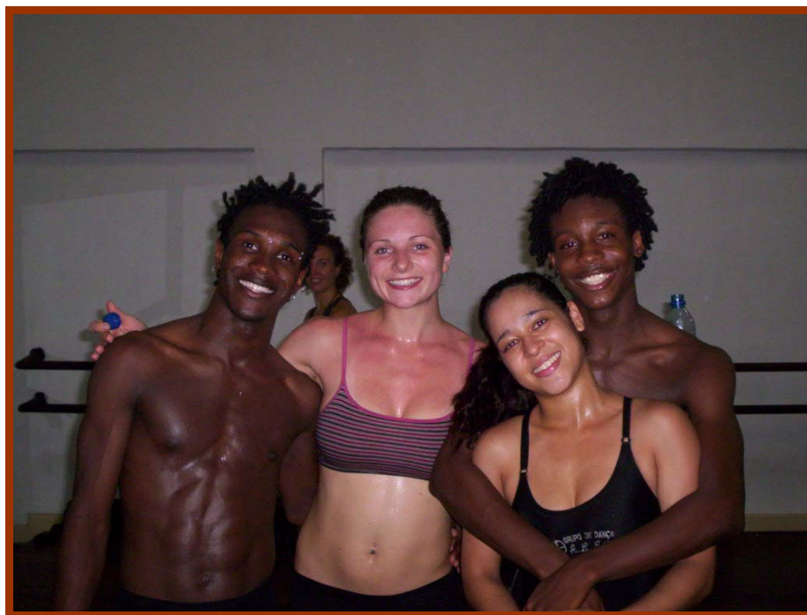
Salvador, 2006 Figura 4: Grupo 2 ensaiando na Escola de Dança, FUNCEB

As duas fontes de movimentos incluem várias linguagens da dança popular brasileira, como a capoeira e a dança sagrada do Candomblé. A diferença da primeira referência de movimento é na sua forma de apresentação, na qual estas danças populares são associadas ao ritmo do samba-reggae , na medida em que o coreógrafo de tal evento determina as suas relevâncias. Vemos no DVD de Daniela Mercury 10 , "Eletrodoméstico", a apresentação de uma coreografia que mescla os movimentos da dança afro com os da dança contemporânea 11 , na qual movimentos da dança afro são "costurados" em seqüências contemporâneas. Nessa parte da coreografia, os dançarinos estão vestidos de preto, com um estilo andrógono. Em outros momentos, observamos a dança afro, quando se destaca a gestualidade dos orixás. O coreógrafo do evento colocou as dançarinas do grupo afro Ilê Aiyê vestidas com roupas que se assemelham às dos orixás. Nas duas formas de mesclagem, observamos os dançarinos situados no fundo do palco, destacando a presença da cantora. Essa estrutura vem da tradição erudita ocidental, na qual o foco da cena está sempre dirigido pelo "arranjo" dos corpos no palco.