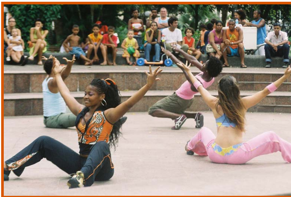
Foto: Marcela Costa, Salvador, 2006 Figura 2: Trabalho do Grupo 1, movimentos de Milena.