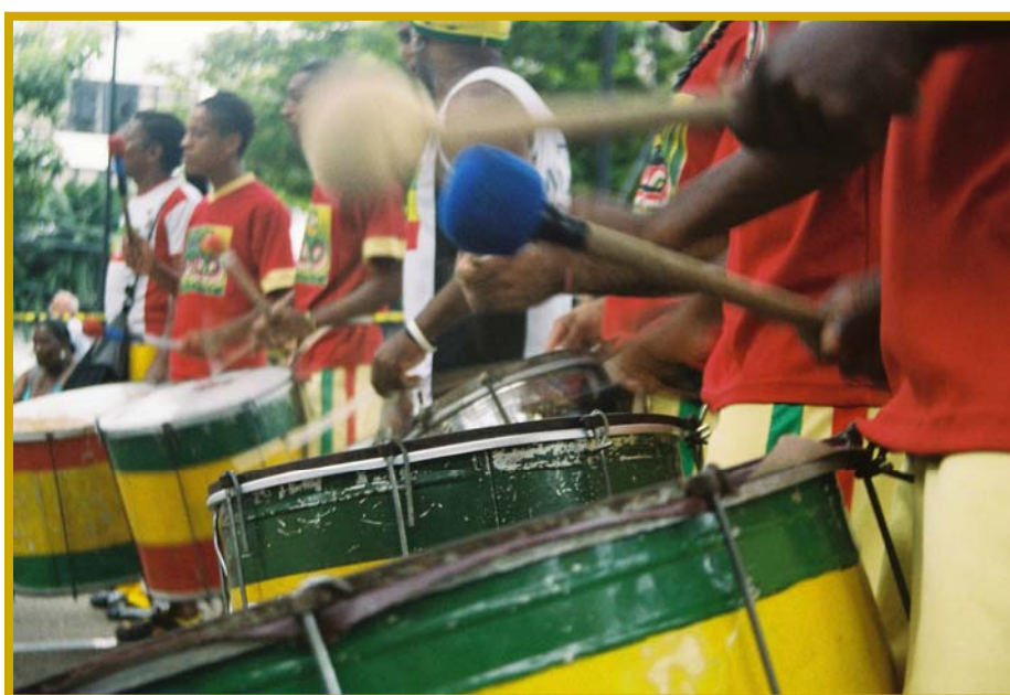
Foto: Marcela Costa, Salvador, 2006 Figura 10: A banda Swing do Pelô

um dos elementos do mesmo, e assim foi perdendo o significado do seu símbolo original. A axé-music junto com o samba-reggae deixam de ser invenções culturais e passam a ser elementos socioeconômicos. O professor Pinheiro esclarece que a cultura possui a capacidade de reciclagem e remontagens. Aquilo que era diluição acaba oferecendo recriação. O que determina a ética de uma apropriação cultural é o seu grau de complexidade. No caso do samba-reggae ser apropriado pelo axé-music , encontramos uma apropriação entrecultural , onde as duas culturas musicais provêm da cultura baiana.