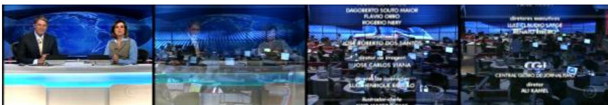
Figura 12: Fechamento do telejornal com combinação zoom out , fusão e travelling ( Jornal Nacional )