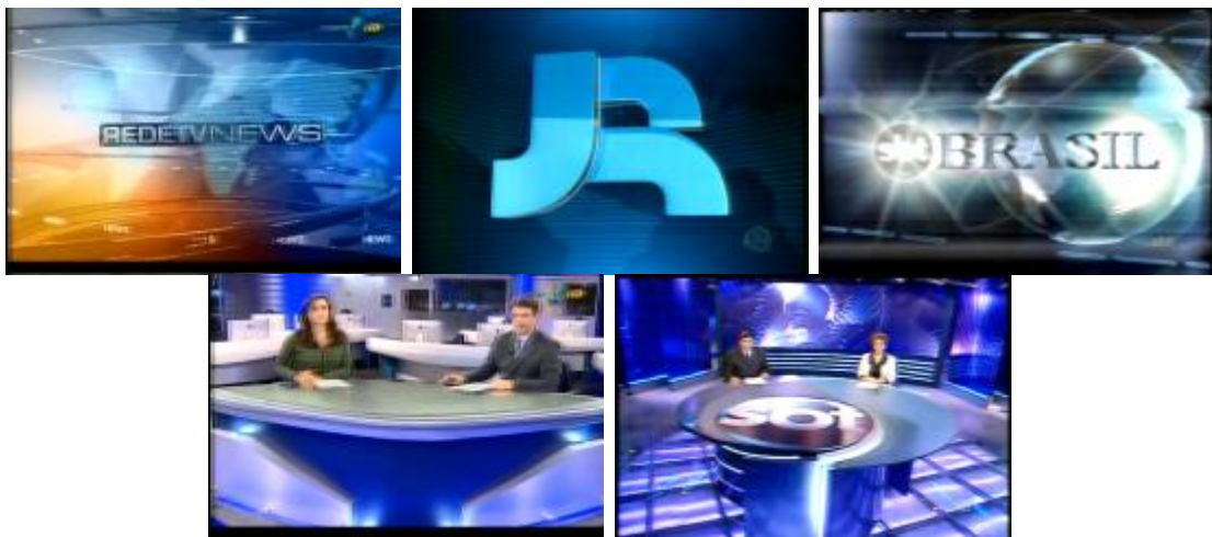
Figura 9: Cor azul nas vinhetas do Rede TV News, Jornal da Record e do SBT Brasil , e como tom predominante do cenário do Rede TV News e Jornal do SBT .

aparecem nas vinhetas de todos os telejornais noturnos exibidos em rede aberta no Brasil que recorrem ao desenho do globo terrestre ou do mapa mundi ( Jornal da Band, Rede TV News, SBT Brasil, Repórter Brasil, Jornal do SBT, Jornal da Noite ), ou ao próprio nome ou sigla do programa ( Jornal Nacional, Jornal da Record e Jornal da Globo ). O azul também predomina nos cenários e na iluminação dos telejornais da noite, com exceção do Jornal da Band que, nas edições de 2008, 2009 e 2010, utilizou a cor azul apenas na iluminação do estúdio, optando pela predominância do marrom e vermelho no espaço cênico 71 . No turno da noite, é observada a mesma gradação tonal descrita sobre os programas diurnos. Enquanto os telejornais exibidos no início da noite, entre 19h e 21h, exploram variações de tons de azul, no Jornal da Globo, Jornal da Noite e Jornal do SBT/edição noturna , veiculados após às 23h40min, a prevalência maior é do azul marinho, escuro, quase negro.