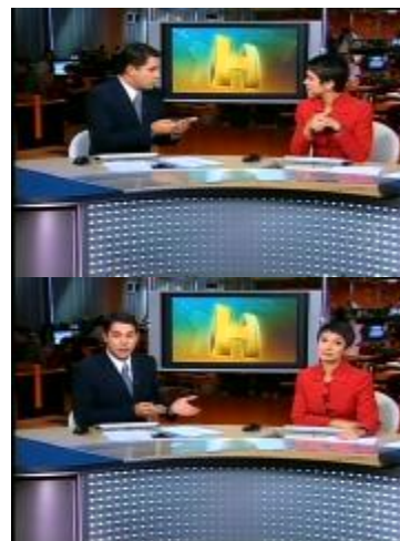
Figura 17: Conversa entre os apresentadores enquadrados em PG ( Jornal Hoje /29.04.09)

Evaristo Costa: Eu também não. Acho que pouca gente tem esse hábito. (dirige o olhar para a câmera). Mas é bom ficar atento, pois você pode estar ou nós podemos estar (apresentadores se olham novamente) pagando mais do que a gente deve.