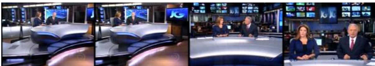
Figura 11: Abertura do telejornal com combinação de travelling e zoom in ( Jornal da Globo )

Assim, nos trechos que demarcam início e fim do telejornal e os intervalos, são identificados dois procedimentos audiovisuais distintos de aproximação e distanciamento. Enquanto o zoom produz efeitos de aproximação e distanciamento transitórios e, desta forma, caracteriza as passagens de bloco, o travelling , que permite a simulação de maior deslocamento corporal e não apenas profundidade do olhar – o telespectador é conduzido pela movimentação da própria câmera – assinala, com maior frequência, as aberturas e finalizações dos telejornais, cujas convocações e despedidas têm caráter mais douradoras.