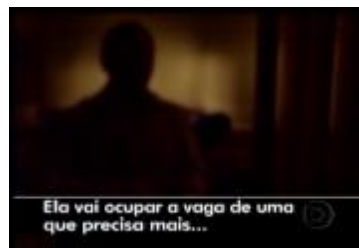
Figura 26: Imagens ilustrativas da sequência inicial do VT ( Bom Dia Brasil /13.04.10)

(Imagem escura da silhueta de um homem em PA. A fala do entrevistado é transcrita na tela)