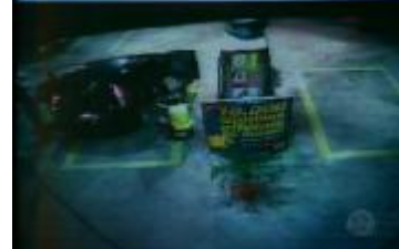
Figura 25: Imagens da câmera de segurança do posto usadas na nota coberta ( Fala Brasil/28.04.10 )

(Outro take de câmera de segurança em plongê mostra homens atirando e se escondendo atrás do veículo)