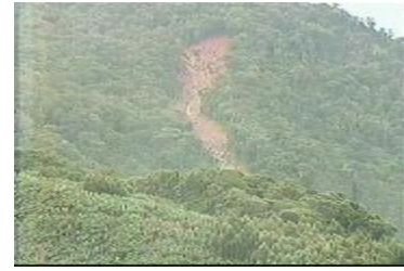
Figura 4: Imagens ilustrativas 55 da reportagem ( Jornal da Record /12.12.08)

Enquanto isso, o morro do Baú se impõe cercado de nuvens carregadas, como se estivesse alertando as pessoas a sua volta que pode chover novamente.