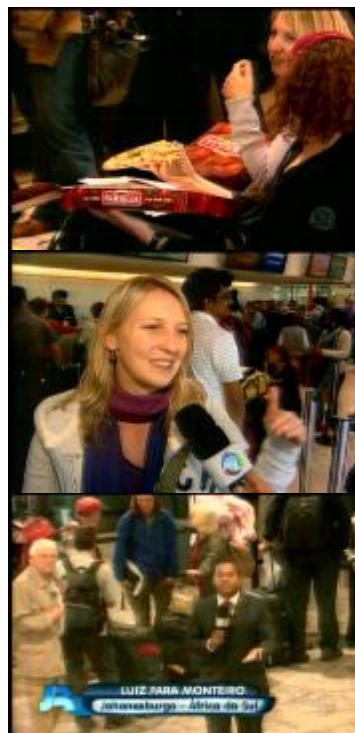
Figura 30: Imagens ilustrativas da reportagem ( Jornal da Record/20.04.10 )

A articulação de vozes e corpos de diferentes repórteres numa mesma cobertura configura o poder de abrangência do telejornal, como se os contornos espaciais delimitados visualmente e verbalmente pelo programa coincidissem com os próprios contornos do mundo. As diferentes vozes são exploradas justamente para demarcar essa simulação de ubiquidade. Mas, apesar de atuarem na condução de um mesmo relato, as vozes não conversam entre si, ao contrário, esforçam-se para se imbricarem no discurso, conformando, na montagem audiovisual, um único sujeito enunciativo. As mudanças espaciais e consequentemente dos sujeitos narradores não são marcadas por qualquer indicação verbal que faça referência ao outro “lugar” ou a outra “voz” de modo a produzir uma única voz enunciatória que atua sobre um macroespaço. Este macroespaço é constituído pelas construções verbais e visuais que explicitam, durante todo o relato, as distintas localizações geográficas acessadas pelo programa.