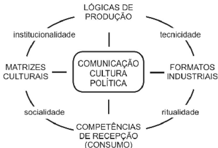
Figura 31: Reprodução do Mapa das Mediações de Martín-Barbero

entre Matrizes Culturais (MC) e Formatos Industriais (FI), e um sincrônico entre Lógicas de Produção (LP) e Competências de Recepção (CR).