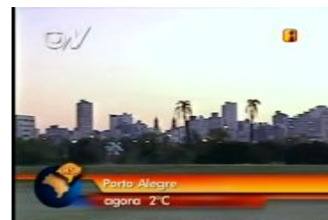
Figura 2: Imagem ao vivo da cidade de Porto Alegre ( Bom Dia Brasil /04.06.09)

Voz da apresentadora Mariana Godoy em off: Vamos ver imagens do amanhecer em Porto Alegre. Na capital gaúcha faz muito frio. Agora cedo, a temperatura é de dois graus. Também céu com poucas nuvens.