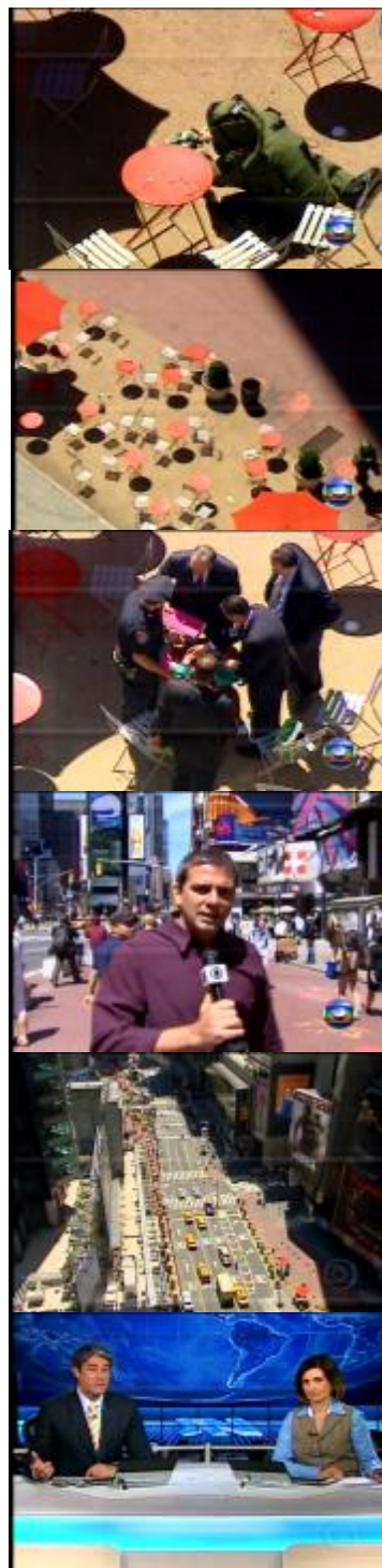
Figura 29: Imagens ilustrativas da reportagem ( Jornal Nacional/07.05.10 )

Bonner: Só faltou dizer que os nossos correspondentes estavam naquela local, na Times Square, preparando uma reportagem para o Fantástico