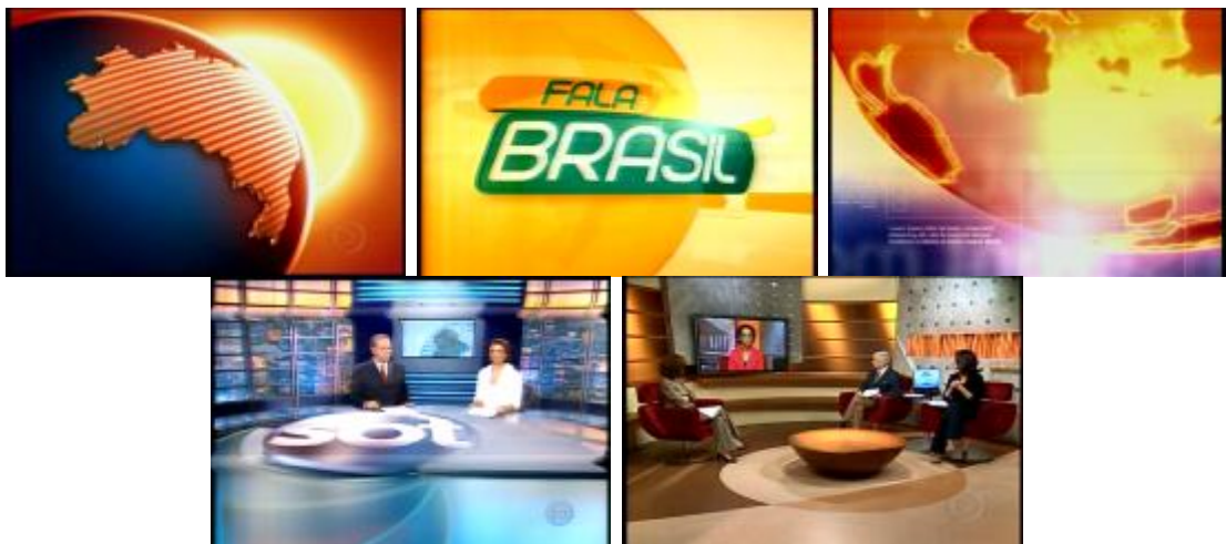
Figura 8: Tons amarelos nas vinhetas do Bom Dia Brasil , do Fala Brasil e do Primeiro Jornal , na luz do estúdio do Jornal do SBT manhã e em um dos cenários do Bom dia Brasil .

de 69 ( Bom dia Brasil, Fala Brasil ) ou como fonte de luz do estúdio ( Jornal do SBT Manhã ). Ainda no turno do dia, o Jornal Hoje , único telejornal nacional vespertino das TVs abertas que compõem este corpus de pesquisa, recorre a cores quentes condizentes com a luz e temperatura do início da tarde, como laranja, ocre e vermelho, presentes no cenário, na iluminação e vinheta. A intenção parece ser nos aproximar das tonalidades do decorrer do dia, que vão do tom do raiar do sol simbolizado pela luz atrás da bancada do primeiro telejornal exibido, o Jornal do SBT manhã , aos tons mais alaranjados característicos da temperatura mais intensa do meio dia, que ambientam o Jornal Hoje .