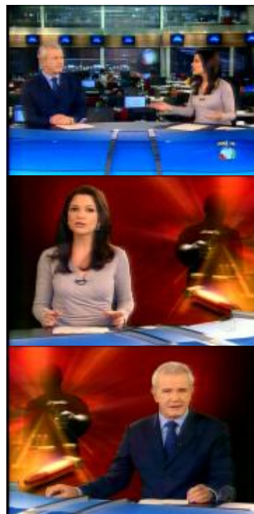
Figura 15: Performatização da cabeça do VT pelos apresentadores ( Jornal da Record /20.04.10)

Celso Freitas (PA): E as primeiras investigações indicam que a causa do crime pode ser vingança. Os bandidos estariam inconformados porque um traficante foi preso.