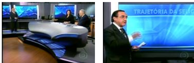
Figura 18: Enquadramentos da conversa com o comentarista: PG e PA ( Jornal da Globo /29.04.09)

e a expressões como “ Repare ”, “ Repara aí ”, mas sempre se dirigindo aos apresentadores. Nesse caso, apesar do intenso grau de conversação representada para discutir a queda dos juros, o espectador não é convocado a participar.