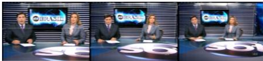
Figura 13: Passagem de bloco do telejornal com movimento zoom out (SBT Brasil)