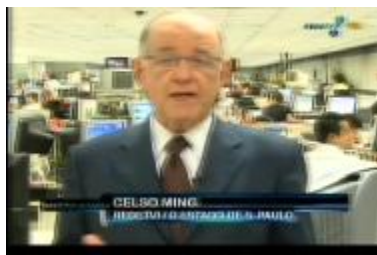
Figura 19: Comentarista em PA posicionado fora do estúdio, em outro espaço geográfico ( Rede TV News/10.05.10 )

Apesar de, nessa sequência, não funcionar a simulação de conversa, a direção da fala do apresentador para o público nos coloca, curiosamente, num lugar mais próximo em comparação com a cena anterior do Jornal da Globo , na qual, à primeira vista, pensa-se que o efeito de participação é maior. Como foi visto, o bate-papo forjado entre os apresentadores da Globo nos exclui da condição de participante, mesmo enquanto mero interlocutor, provocando distanciamento do dito, enquanto nessa cena do Rede TV News , apesar da tentativa de bate-papo não funcionar, pois é nítido o fato de a inserção ser pré-gravada e de o comentarista não interagir com a pergunta do apresentador, provoca-se um maior sentido de diálogo com a audiência, conformado, obviamente, por posições distanciadas. Ainda que numa posição hierarquicamente inferior ao da autoridade, o espectador é chamado a atuar enquanto interlocutor e não simplesmente como observador de uma conversa alheia.