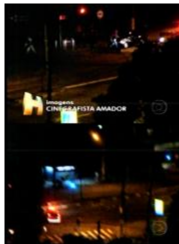
Figura 23: Imagens da primeira sequência do VT ( Jornal Hoje /12.05.10)

(Imagens registradas pelo cinegrafista amador cobrem a fala da repórter. Áudio ambiente de sirene em alto volume).