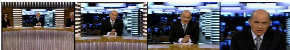
Figura 14: Zoom in no apresentador Ricardo Boechat enquanto este, em tom de indignação, profere cabeça do VT sobre o fechamento de madeira no Pará ( Jornal da Band/27.05.09 )

Boas, Ricardo Boechat e Joelmim Betting, em direção ao âncora Boechat. Na edição de 27.05.09, enquanto é enquadrado em PP, Boechat aproximando-se da audiência para performatizar o seguinte texto verbal: “ os trabalhadores de madeiras fechadas pelo Ibama ficaram sem emprego no Pará. Ali mesmo, naquela região, não há alternativas de trabalho (balança a cabeça em movimento negativo). Em uma cidade que dependia dessa atividade, embora praticada em áreas proibidas, famílias agora têm de sobreviver procurando comida no lixo (franze a testa em tom de desaprovação) ”.