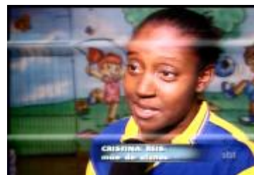
Figura 20: Imagens ilustrativas da reportagem

Sonora (Crédito: Cristina Reis – mãe de alunos): “A minha mais velha tem três anos. Há três anos ela tá na fila de espera. Eu não tenho realmente, não tenho com quem deixar, então tenho que pagar”.