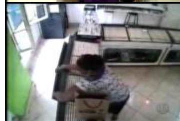
Figura 22: Imagens ilustrativas da reportagem ( Jornal do SBT/08.04.10 )

(Imagem em plongê capturada pela câmera de segurança é novamente exibida. Take revela a ação de Márcia no balcão da loja).