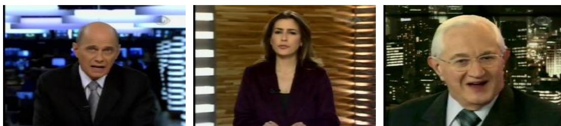
Figura 10: Exemplos de PA próximo e PA afastado ( Jornal da Band /15.05.09) e PP ( Jornal da Noite /11.05.10).