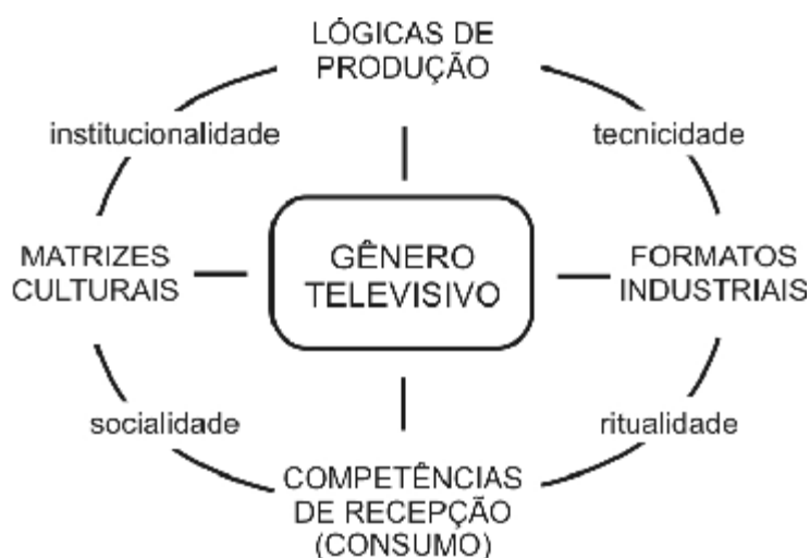
Figura 32: Conceito de gênero no centro do Mapa das Mediações conforme Itania Gomes.

Valendo-se deste insight de Martín-Barbero, Itania Gomes (2010, 2011) posiciona gênero televisivo no interior do mapa enquanto categoria através da qual podem se interpretadas as relações entre comunicação, cultura, política e sociedade acionadas por formatos industriais em sua vinculação com matrizes culturais e pela articulação sincrônica entre os sistemas produtivos e as lógicas e expectativas da audiência de modo a compreender o que caracteriza por “totalidade do processo comunicativo” (GOMES, I., 2010, p.2). A proposta da autora é ilustrada no desenho a seguir, que representa sua apropriação do mapa das mediações.