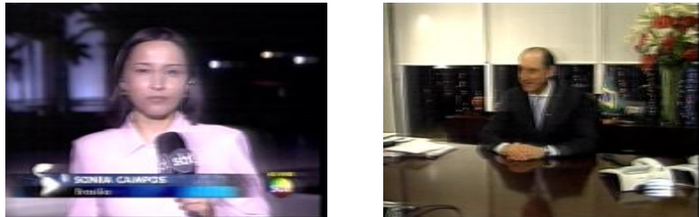
Figura 3: Montagem do take da repórter ao vivo para o take da fonte na reportagem gravada ( Jornal do SBT/11.12.08 )

pré-gravado, cujo primeiro take revela justamente a imagem de Paulo Skaff (presidente da Fiesp) de modo a reforçar a continuidade, também semântica, entre os dois trechos da montagem. Após finalizar o ao vivo com a afirmação “ mas o presidente da Fiesp vê as medidas com cautela ”, a voz é posta em off e sobresposta à imagem do sujeito convocado no término da entrada direta como forma de prolongar o tempo presente do relato, agora em forma de reportagem gravada. O off da matéria é iniciado da seguinte forma: “ Paulo Skaff diz que a crise mundial é grave, mas o governo brasileiro ainda não tem como medir as consequências. Por isso, analisa as medidas com cuidado. Para ele, o pacote é necessário, mas é preciso tempo para saber se os efeitos são os esperados (...) ”.