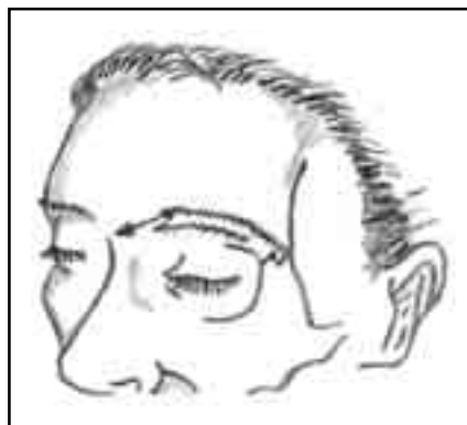
Fig 1. Incisão superciliar.