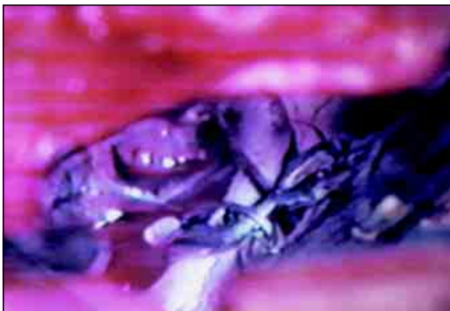
Fig 3. Aneurisma de carótida clipado visualizando-se a clipagem provisória acima.

No caso do astrocitoma anaplásico, foi feito esvaziamento intratumoral, com retirada total da lesão macroscopicamente. No caso do cisto aracnóideo localizado na fissura inter-hemisférica, foi utilizada técnica de aborda-