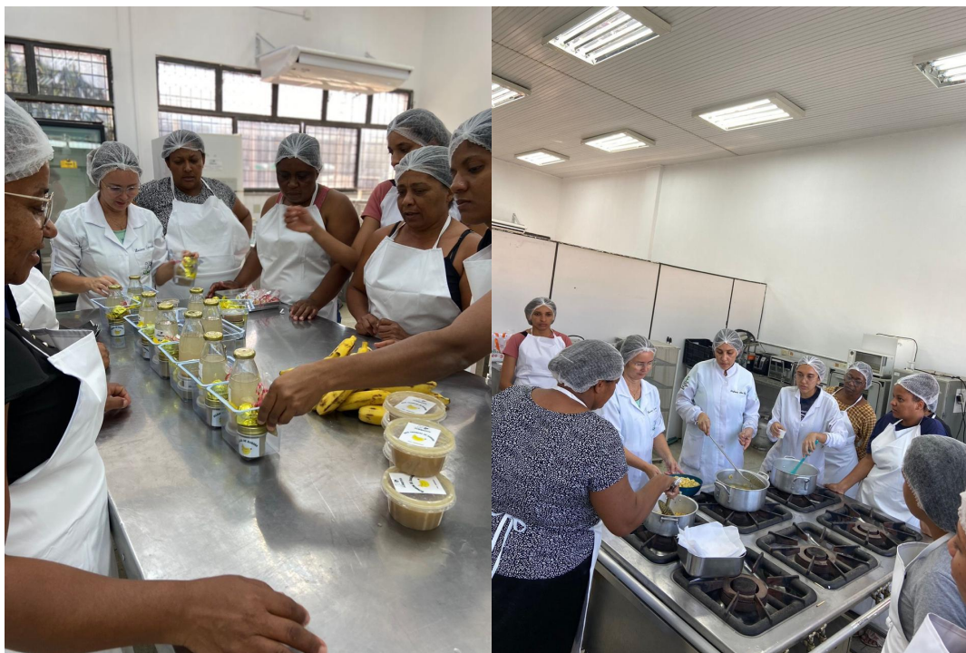
Figura 10 - Curso de elaboração de produtos a base de banana realizado no IFSertãoPE