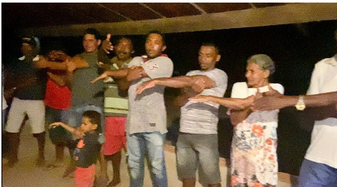
Figura 11 - Alongamento

A oficina de teatro com os moradores iniciou-se após essa preparação na área reservada para reuniões na ilha. No horário combinado, todos os demais moradores compareceram para que fosse dado início ao evento, que começou com uma sessão de alongamento, pensada para proporcionar conforto e descontração ao grupo.