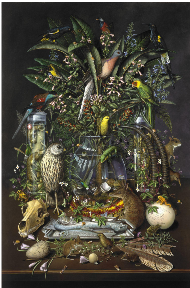
Figura 4 - Gone, por Isabella Kirkland 2004.