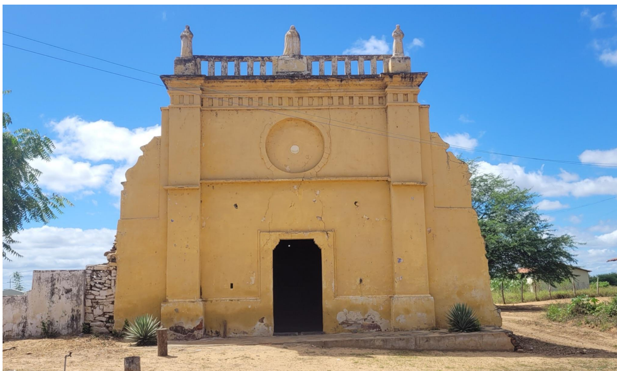
Figura 2 – Igreja de São Félix