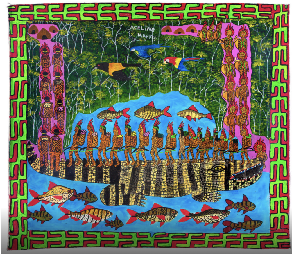
Figura 5 - Kapenawe pukenibu, Acelino Tuin Huni Kuin (MAHKU), 2022.