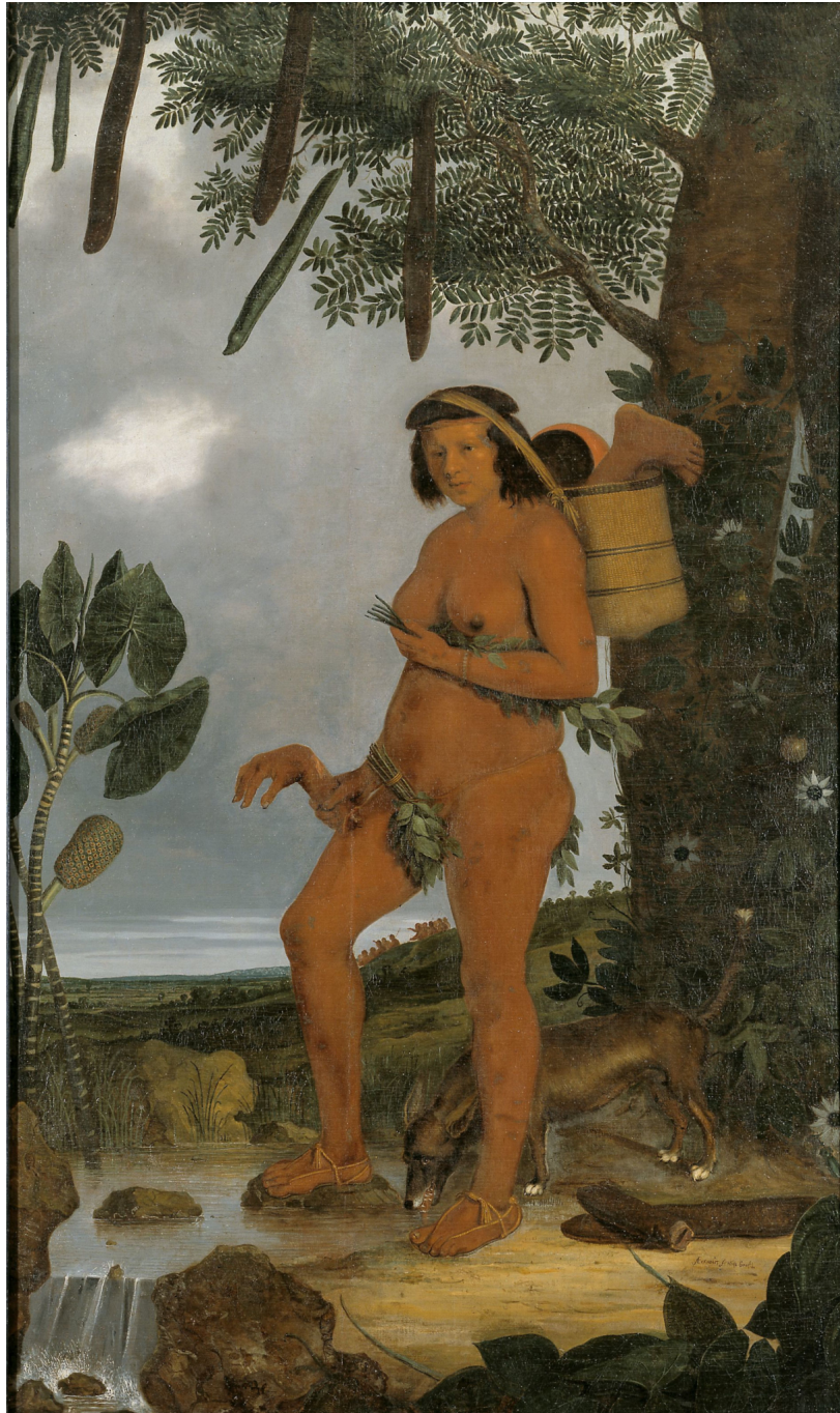
Figura 1 – Mulher Tapuia “Mulher Tapuia”, Albert Eckhout