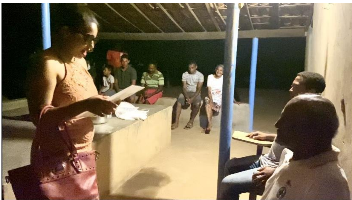
Figura 12 - Representação de cena nos moldes do Teatro-Fórum

Ao final da oficina, todos foram convidados a compartilhar suas experiências, e um lanche preparado por voluntários foi servido, fortalecendo a atmosfera de partilha e comunidade.