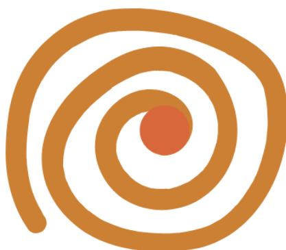
Figura 8 - Representação visual da RARA

Além de seu foco na sustentabilidade ecológica, a RARA foi pensada também para buscar uma reconciliação cultural, ao valorizar a pluralidade dos saberes indígenas, desafiando o monopólio epistemológico que até hoje privilegia o conhecimento ocidental. Ao retomar as práticas ancestrais e fomentar a transmissão intergeracional de saberes, a RARA cria um espaço de resistência cultural que, ao mesmo tempo, se apresenta como uma alternativa ecológica às crises ambientais contemporâneas, oriundas justamente das práticas predatórias impostas pelo colonialismo.