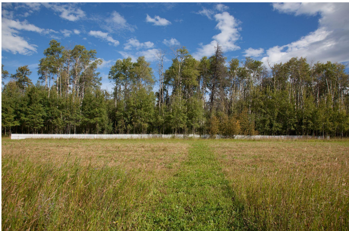
Figura 3 - Lifeline por Peter von Tiesenhausen

Anos mais tarde, o artista foi procurado novamente para negociar suas terras para ampliação do oleoduto. Desta vez, já havia registrado suas obras de arte no órgão competente e, com a ajuda de um advogado, demonstrou que perturbar o solo de qualquer forma durante a escavação da vala para instalação do oleoduto constituiria violação de direitos autorais. Ainda segundo Ospina (2022), o artista demonstrou que suas criações eram uma obra de arte viva e o caso não chegou a ir para os tribunais, pois a empresa desistiu do embate para evitar desgaste com a opinião pública.