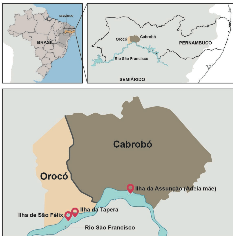
Figura 7 - Localização das Aldeias truká em Pernambuco