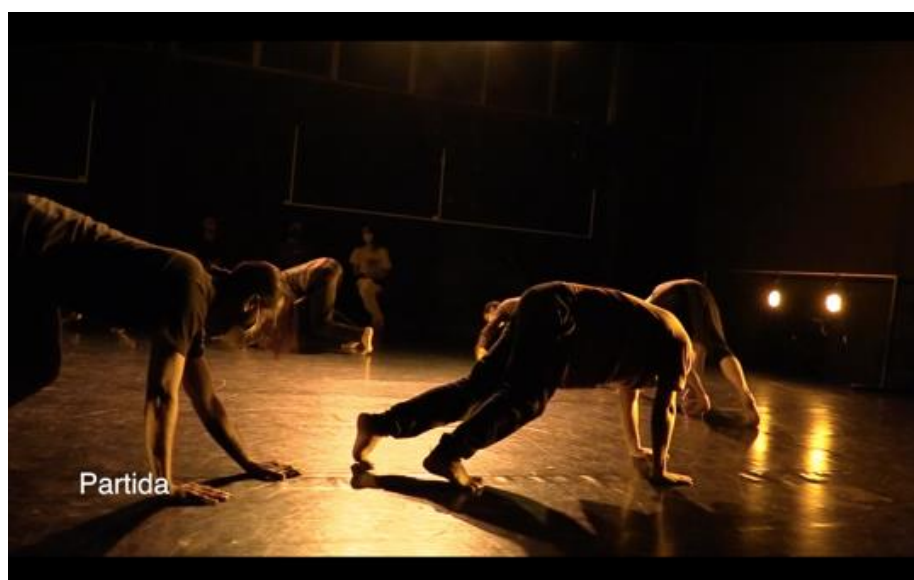
(Fig.45) Frame do minidocumentário do projeto.

A dramaturgia de duas pontas, chegadas e partidas, proposta de conceito/método que venho me debruçando em pesquisa continuada, foi operacionalizada por meio de cartas escritas nas duas últimas residências. Este exercício dramático que vem sendo operado em meus processos criativos como diretor, dramaturgista e professor-facilitador de processos, serviu também aos roteiros dos primeiros cortes de cada residência, assim como ao corte final.