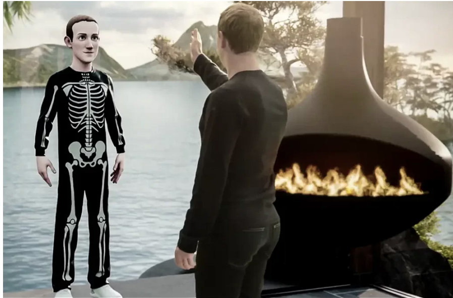
Zuckerberg escolhe avatar em ambiente do Metaverso 36

Dessa forma, utilizando gráficos 3D, avatares e comunicação instantânea, a tecnologia pode proporcionar uma experiência imersiva em um ambiente fictício. Os usuários podem se movimentar e explorar diferentes ângulos de visão, enquanto interagem com outros indivíduos em mundos paralelos, como a plataforma Horizon do Facebook (Meta), criando uma experiência imersiva completa, mesmo a longas distâncias. Imperativo é reconhecer que essas aplicações de realidade virtual se tornam ainda mais latentes com a utilização do dispositivo adequado, como o Óculos de Realidade Virtual cujas funções englobam uma série de mecanismos que ajudam a acentuar essa sensação de imersão.