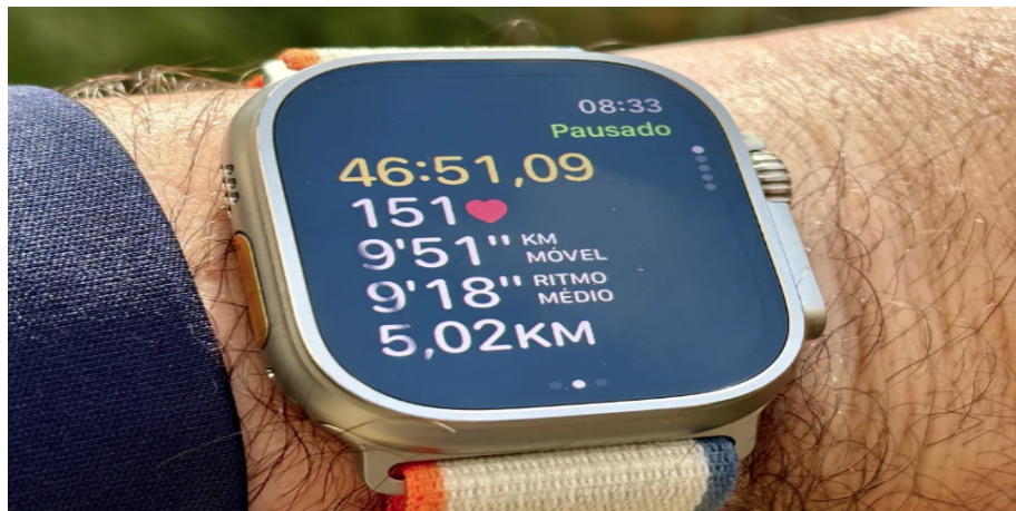
Apple Watch Ultra 2 após finalizar um exercício 33

Contudo, é importante ressaltar que essa aplicação não se restringe apenas à utilização em atividades físicas, mas se estende à coleta de dados em diversos aspectos da vida cotidiana. Cada informação, pesquisa e interação em redes sociais são meticulosamente registradas e armazenadas, formando uma espécie de arquivo detalhado do usuário.