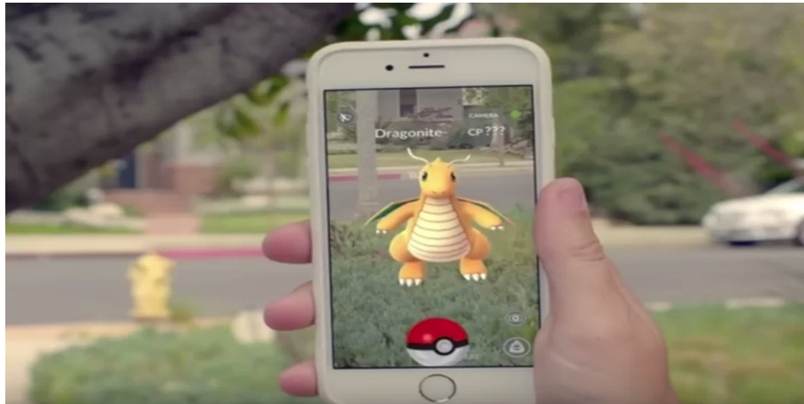
Figura 2 - Projeção do Pokemon GO