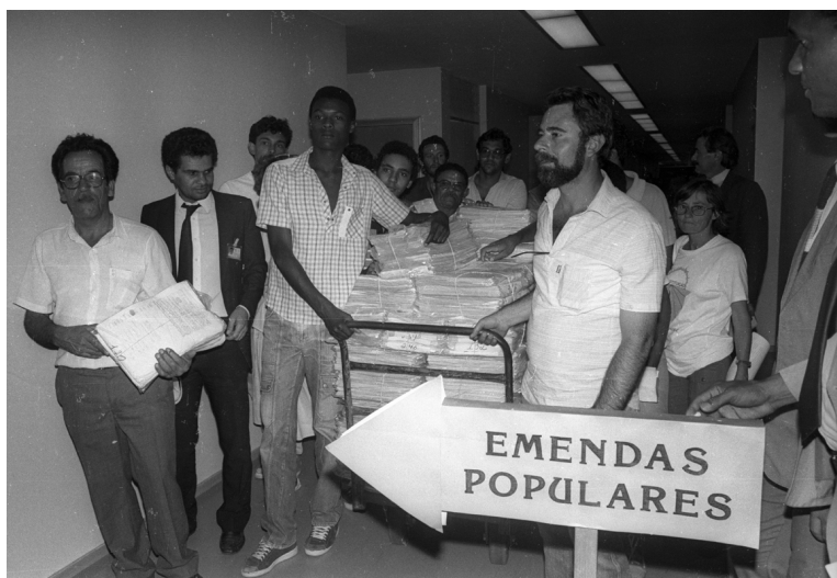
Figura 1: Entrega de propostas de emendas populares à Constituição

Em seu artigo 1º, a Constituição brasileira dispõe que a República Federativa do Brasil “constitui-se em Estado Democrático de Direito e tem como fundamentos”: “a soberania”, “a cidadania”, “a dignidade da pessoa humana”, “os valores sociais do trabalho e da livre iniciativa” e “o pluralismo político”. No parágrafo único desse artigo, lê-se que “[t]odo poder emana do povo”. Já o artigo 3º do texto constitucional afirma os seguintes objetivos fundamentais da República Federativa do Brasil: “constituir uma sociedade, livre, justa e solidária”; “garantir o desenvolvimento nacional”; “erradicar a pobreza e a marginalização e reduzir as desigualdades sociais e regionais”; e “promover o bem de todos, sem preconceitos de origem, raça, sexo, cor, idade e quaisquer outras formas de discriminação”.