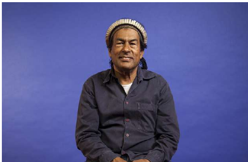
Figura 10: Ailton Krenak

Em seus livros e textos, que costumam ser “transcrições de palestras e entrevistas, pois seu modo preferido de expressão é a fala”, o líder indígena “reflete sobre os pressupostos antropológicos daquela civilização que se toma por carro-chefe da ‘humanidade’ e sobre os efeitos que ela está produzindo sobre as condições materiais e espirituais de existência de todos os povos, espécies e existentes da Terra” (CASTRO, 2020, p. 75-84).