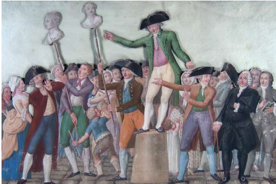
Figura 6: Revolução Francesa

Fonte: LESUEUR, Jean-Baptiste. Première scène de la Révolution française à Paris. [ca. 1789/1794]. 1 pintura, color.