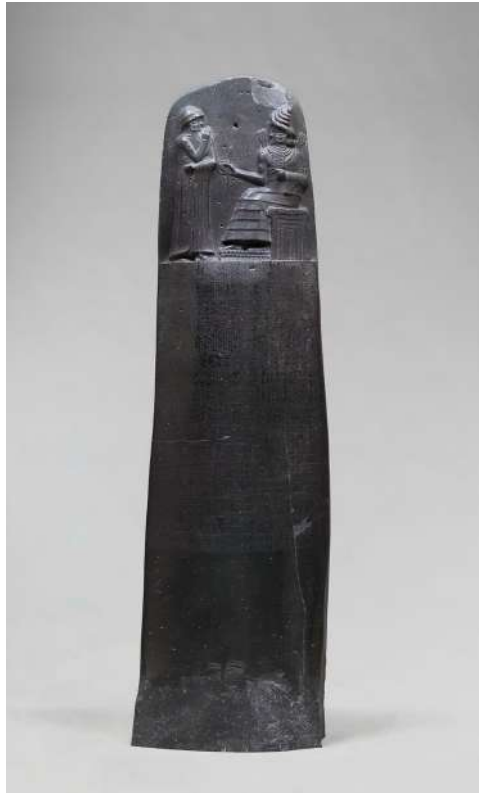
Figura 4: Código de Hamurabi, no Museu do Louvre