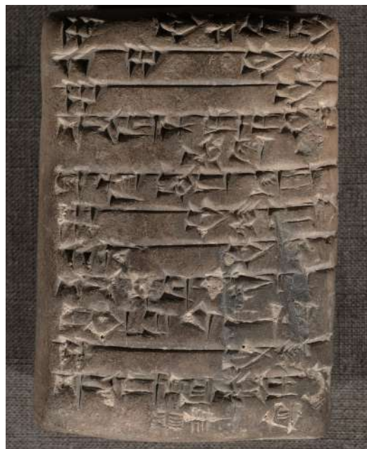
Figura 3: Recibo de gado em tabuinha cuneiforme

Na região, foram encontradas tabuinhas do final do IV milênio a.C. que revelam os primeiros estágios da escrita. A prática da escrita surgiu com a finalidade de registrar as atividades comerciais e era realizada por funcionários de palácios e templos que riscavam sinais na argila úmida. Os textos mais antigos são desenhos de representações pictóricas (pictografias), como a cabeça de um animal ou um grão de cereal, mas, posteriormente, surgiram representações estilizadas de objetos, com algumas poucas marcas na argila, que foram sendo padronizadas (sistema de escrita cuneiforme). Muitas dessas tabuinhas apresentam tanto sinais desenhados, quanto escritos em cuneiforme. As representações frequentemente estão acompanhadas por números, sugerindo que os textos tratam de questões econômicas, como recibos ou notas de entregas (WALKER, 1996, p. 21-25).