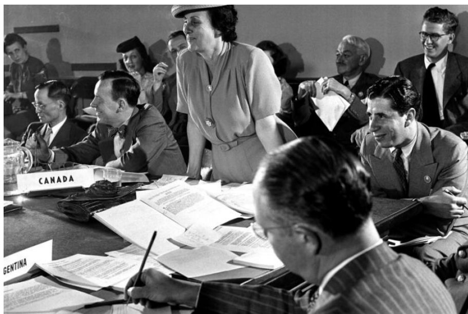
Figura 7: Bertha Lutz na Conferência de São Francisco (1945)

A Carta da ONU foi um dos primeiros tratados internacionais a mencionar a igualdade de direito dos homens e das mulheres. A diplomata brasileira Bertha Lutz, com a ajuda das delegadas do Uruguai, México, República Dominicana e Austrália, reivindicou a defesa dos direitos das mulheres na Carta. Durante os debates da Conferência de São Francisco, em que apenas 3% dos 160 participantes eram mulheres, a brasileira destacou que “em nenhum lugar do mundo, havia igualdade completa de direitos” entre homens e mulheres. Estão entre as contribuições de Lutz e de outras delegadas para a Carta da ONU: a) o preâmbulo, que cita a igualdade de direito dos homens e das mulheres; b) o artigo 1º, que indica o propósito de promover e estimular direitos e liberdades para todos, sem distinção de raça, sexo, língua ou religião; e c) o artigo 8º, que prevê que a ONU não estabelecerá restrições quanto à elegibilidade de homens e mulheres para participar em condições de igualdade nas funções de seus órgãos (ONU, 2016).