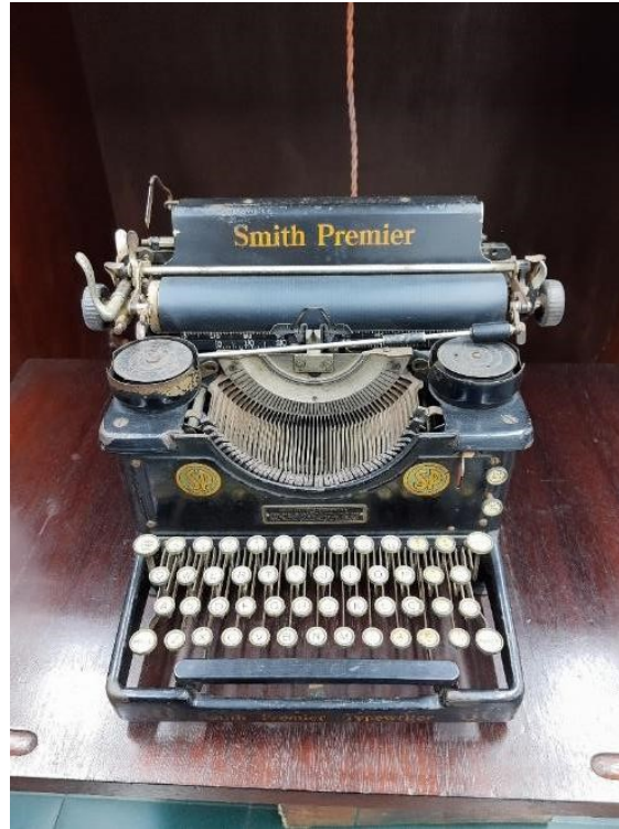
Figura 1 – Máquina de datilografia de Frederico Edelweiss

utilizada por Frederico Edelweiss para escrever os seus livros, textos, correspondências e pareceres.