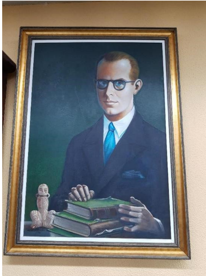
Figura 4 – Pintura do busto de Frederico Edelweiss

A Figura 4 ilustra o quadro com uma pintura do busto de Frederico Edelweiss. A pintura foi feita em 1982 pelo artista Carlos Bastos.