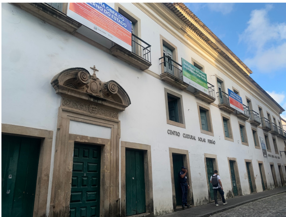
Figura 10 — Fachada do Centro Cultural Solar Ferrão

promoveram obras de adaptação. Entre 1793 e 1814, o espaço foi residência de Pedro Gomes Ferrão Castelo Branco — que lhe emprestou o nome atual — e posteriormente passou por diversos usos e donos até a sua aquisição pelo Governo Estadual, em 1977.