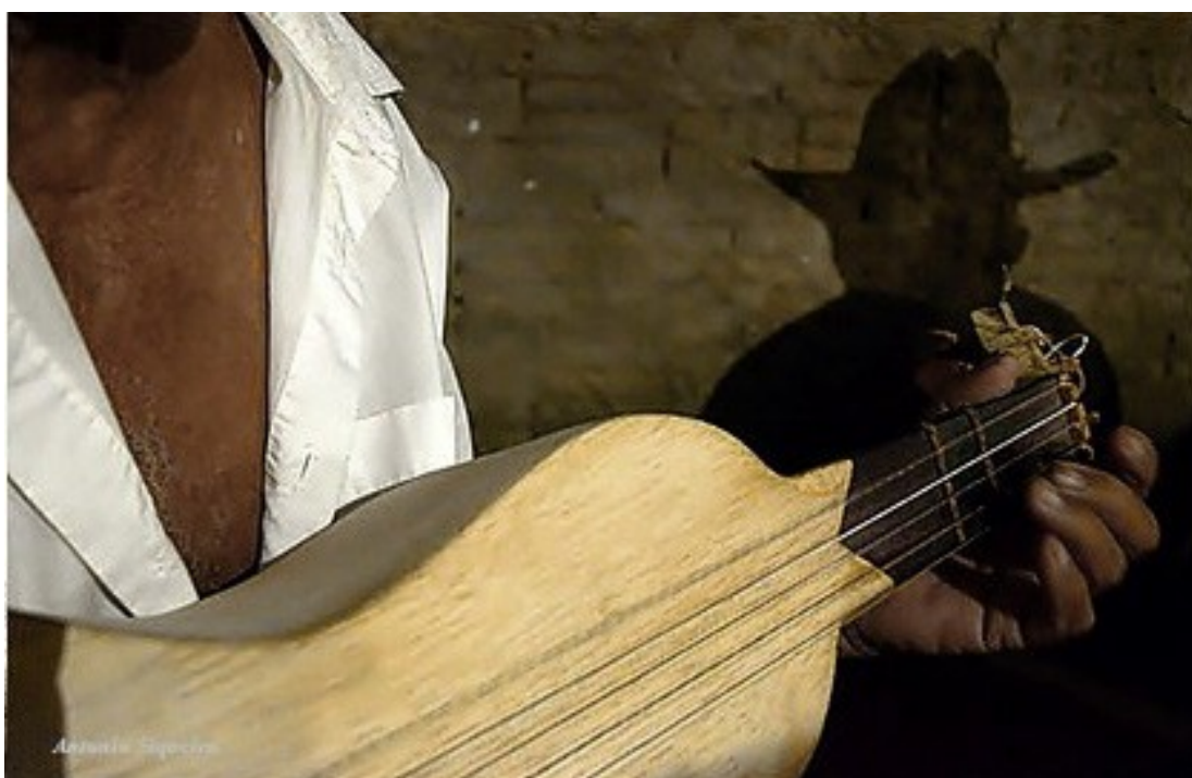
Figura 2 — O som da viola de cocho

De modo geral, as violas de cocho possuem cerca de 70 cm de comprimento e 25 cm de largura, com 10 cm de altura na caixa de ressonância, e é composta por 5 ou 6 cordas (Figura 2) (INSTITUTO DO PATRIMÔNIO HISTÓRICO E ARTÍSTICO NACIONAL, 2009), mas essas dimensões podem variar segundo o artesão que a produz (VILELA, 2016). Sendo assim, não existem duas violas de cocho iguais, pois cada artesão tem o seu estilo (ROZENDO, 2012), e isso confere um padrão único de som emitido pelo instrumento em particular.