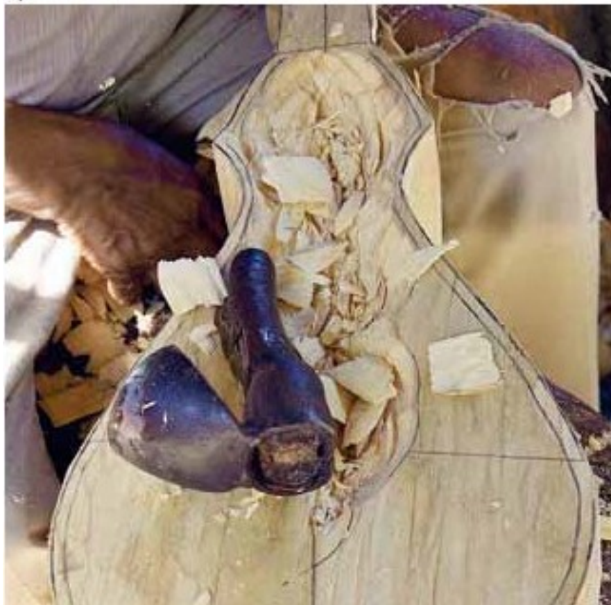
Figura 4 — Escavação do entalhe do corpo da Viola de Cocho

boa ressonância da viola-de-cocho (Figura 4) (INSTITUTO DO PATRIMÔNIO HISTÓRICO E ARTÍSTICO NACIONAL , 2009).