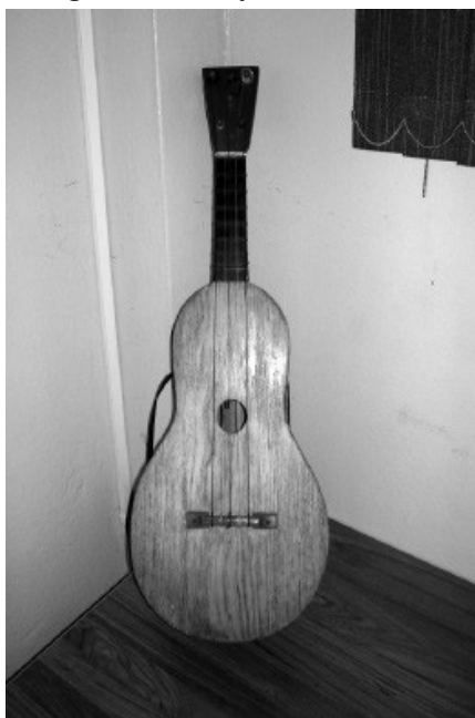
Figura 8 — Mejoranera

A tentativa de produzir uma viola, com a matéria-prima disponível na região, teve como resultado a viola de cocho que, embora longe do objetivo principal, resultou em um instrumento de som único. Porém, existe um instrumento no Panamá cuja forma assemelha-se à da viola de cocho (Figuras 8 e 9): a mejoranera. Pesquisadores vinculam a mejoranera à tentativa de produzir uma vihuela , ou viola quinhentista de origem espanhola e, assim como na história da origem da viola de cocho, o resultado foi um instrumento de som único (VILELA, 2010).