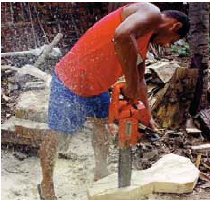
Figura 1 — Matéria-prima e conhecimento utilizados para transformar o tronco de uma árvore em viola