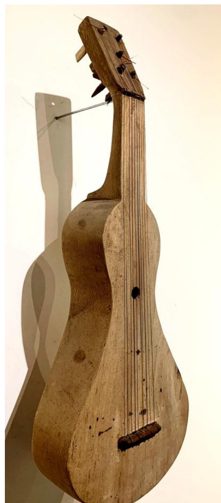
Figura 13 — Viola de cocho em exposição no Solar Ferrão – foto de perfil