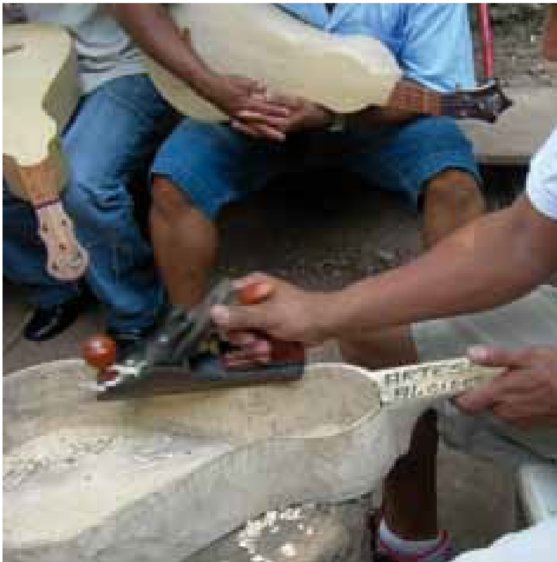
Figura 3 — Talhamento no formato de viola, para assim afixar um tampo e as demais partes que caracterizam o instrumento