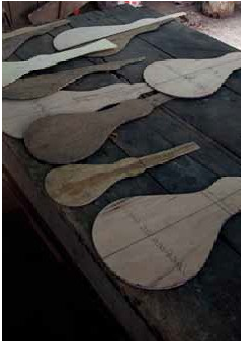
Figura 5 — Moldes do tampo para montagem da Viola