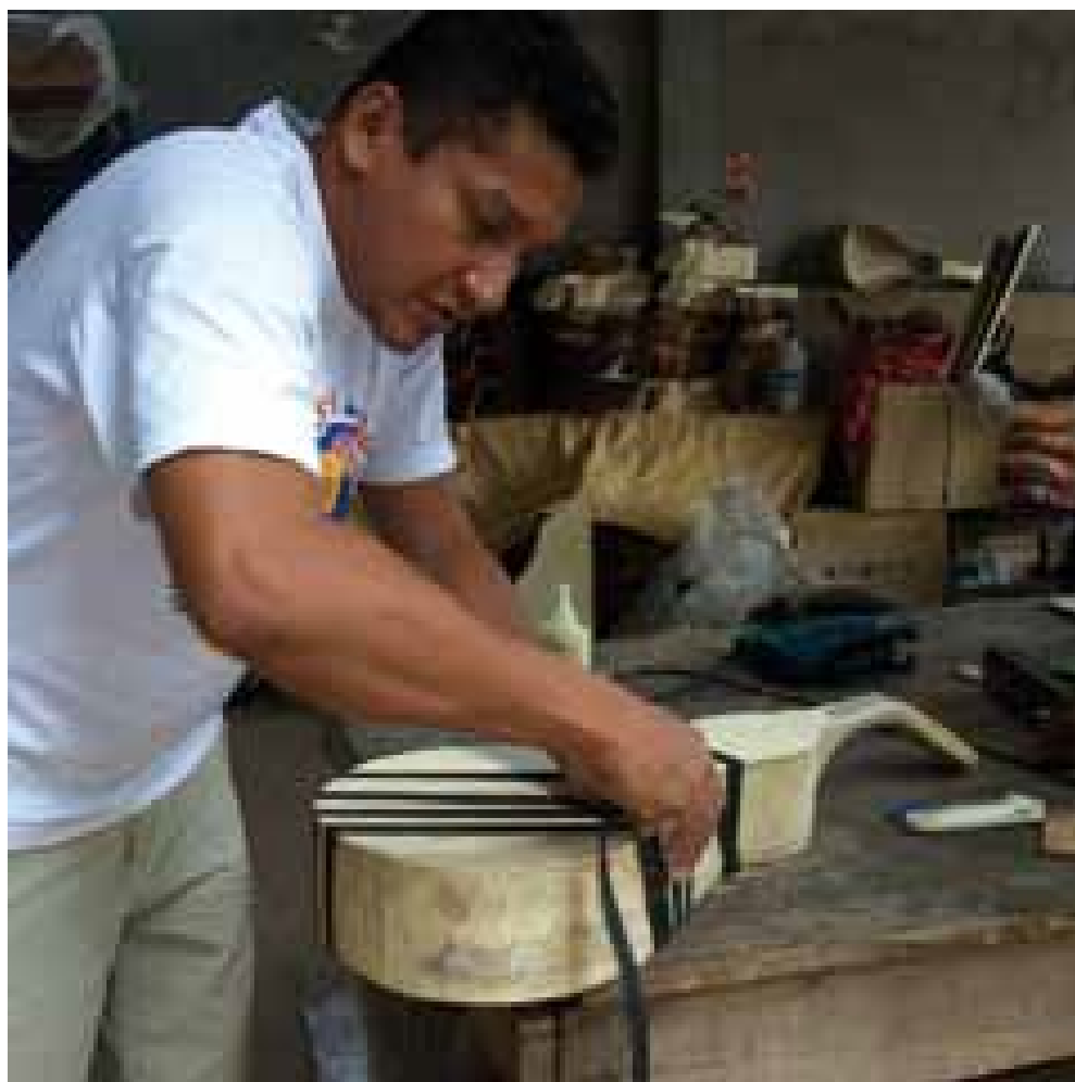
Figura 6 — Processo de colagem da matéria-prima

Fonte: Instituto Do Patrimônio Histórico e Artístico Nacional (2009, p. 37).