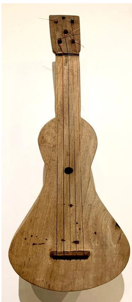
Figura 12 — Viola de cocho em exposição no Solar Ferrão – foto frontal