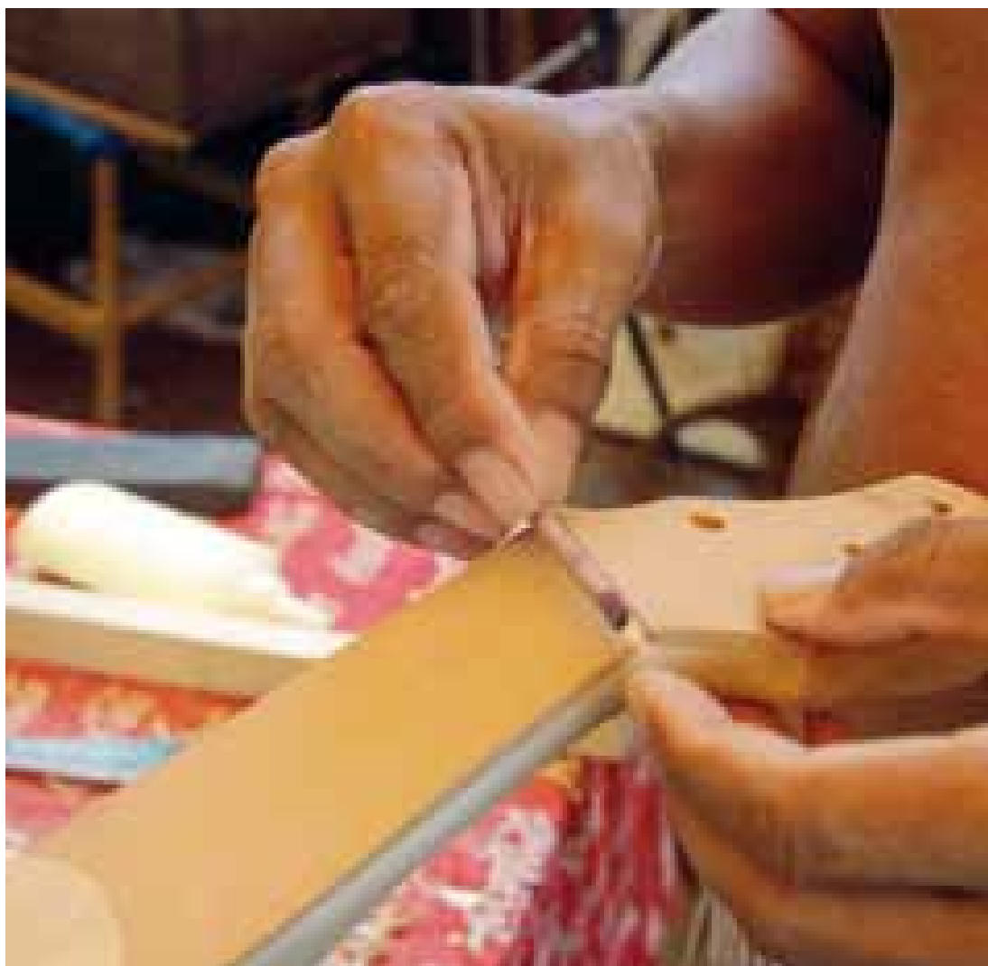
Figura 7 — Pontos e trastes feitos para inserir as cordas