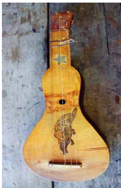
Figura 9 — Viola de Cocho