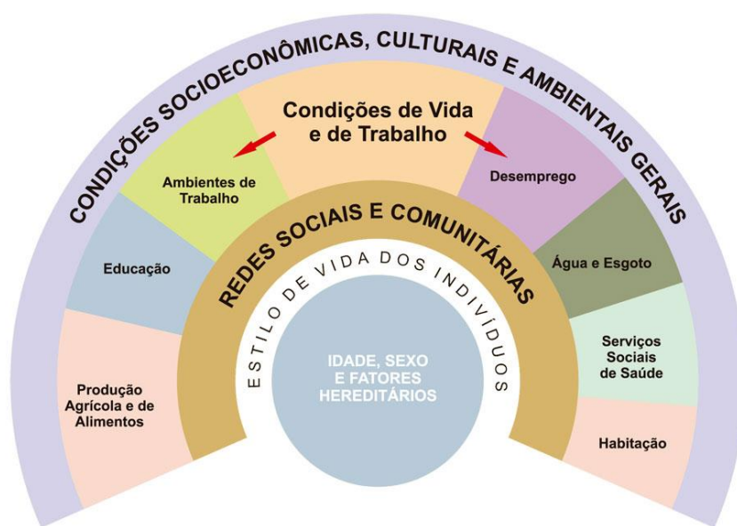
Figura 1 - Determinantes sociais: modelo de Dahlgren e Whitehead

Alguns modelos são encontrados hoje na tentativa de elucidar essa complexa relação na determinação da saúde, sendo o modelo de Dahlgren e Whitehead bastante mencionado, pela simplicidade, facilidade interpretativa para diversos tipos de público e pela clara visualização gráfica dos diversos DSS (CNDSS, 2008). Todavia admite-se ainda a dificuldade de resposta à todas as lacunas referentes à saúde na sua integralidade. Especificamente a esse modelo, provavelmente por ainda tomar como referência a atenção médico-sanitária aos doentes, tomando risco individual como pilar (TAMBELLINI; SCHÜTZ, 2009). Na Figura 1 é possível visualizar o modelo.