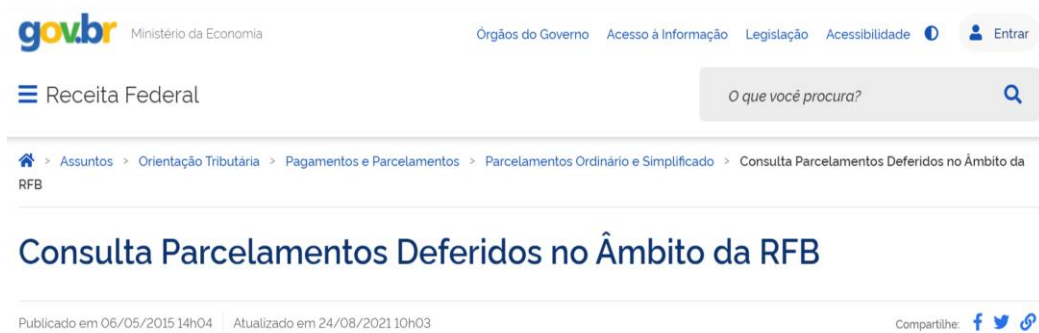
Figura 4 - Caminho no sítio da RFB na internet até o início da consulta sobre parcelamentos