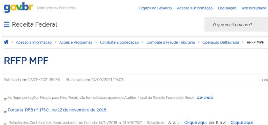
Figura 7 - Caminho no sítio da RFB na internet até o início da consulta sobre RFFP