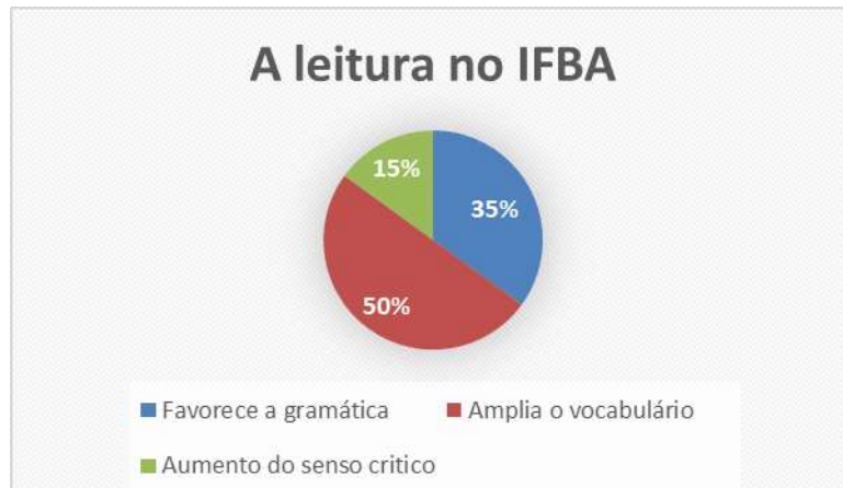
Gráfico 2 – A leitura no IFBA