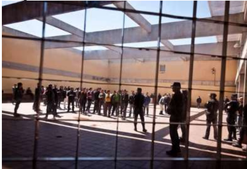
Figura 17 - Interior del CIE de Zona Franca de Barcelona