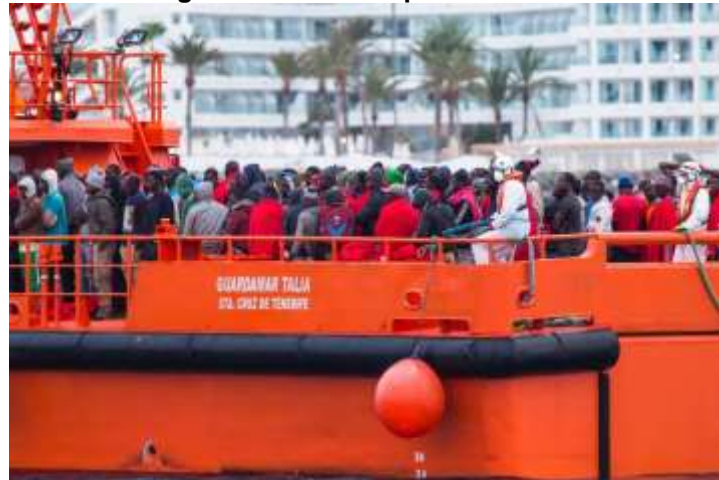
Figura 14 - Navio Aquarius

refugiados africanos e teve sua entrada proibida no porto da Itália, sendo acolhido pelo governo espanhol no porto de Valencia.