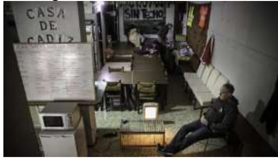
Figura 16 - Interior da Casa Cádiz