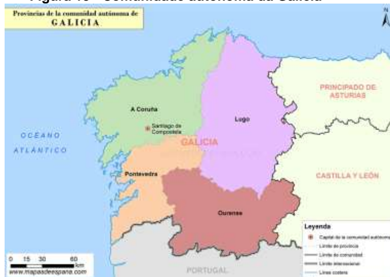
Figura 13 - Comunidade autónoma da Galícia