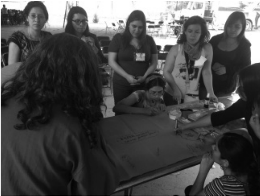
Figura 1 – Taller El encuentro sagrado con si misma, Encuentro Mujeres que Luchan, 2019