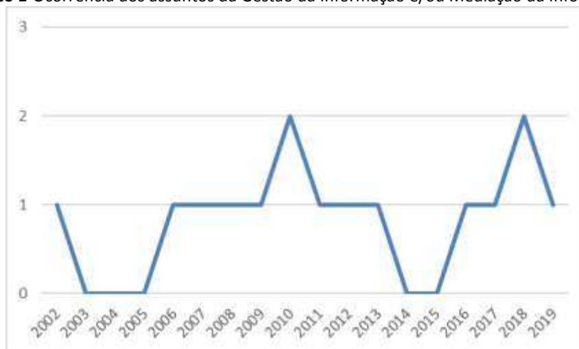
Gráfico 1- Ocorrência dos assuntos da Gestão da Informação e/ou Mediação da Informação