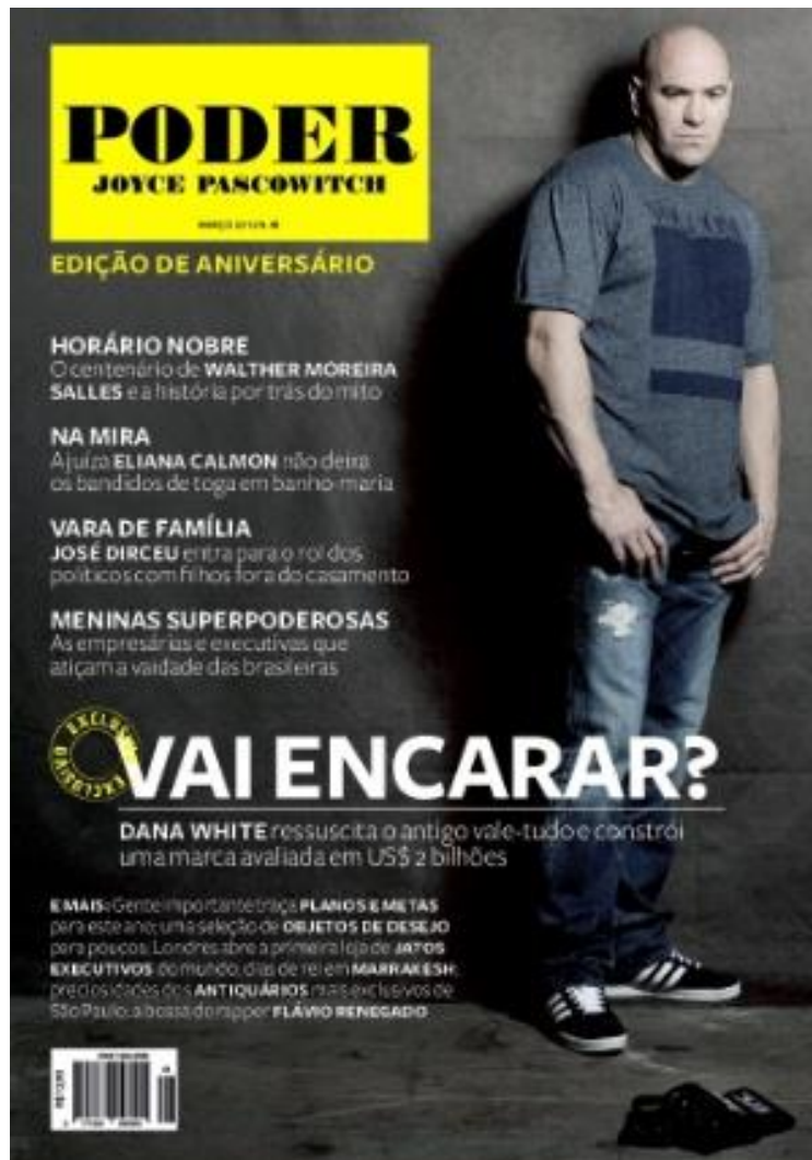
Edição 48, março de 2012