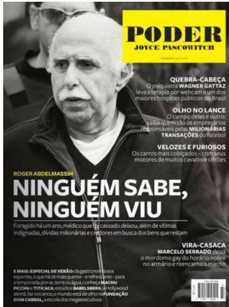
Edição 47, fevereiro de 2012