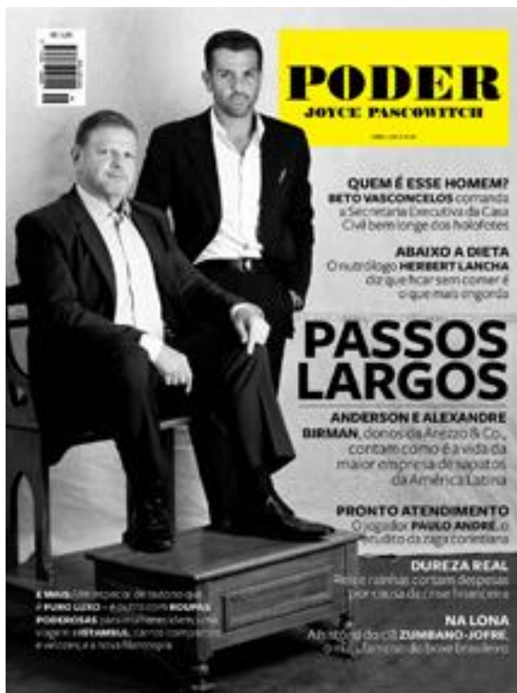
Edição 49, abril de 2012