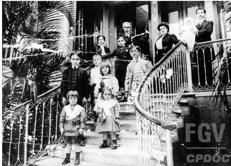
Imagem 1 – Afonso Arinos com familiares 21

e Ministro da Justiça. Também ocupou a prefeitura do Rio de Janeiro (DF), de 1898 a 1900 19 . Do lado paterno, o avô Virgílio de Melo Franco também foi deputado provincial, deputado geral e senador de 1891 até 1922, quando faleceu, conforme informou o próprio Afonso Arinos nas entrevistas que concedeu ao CPDOC 20 .