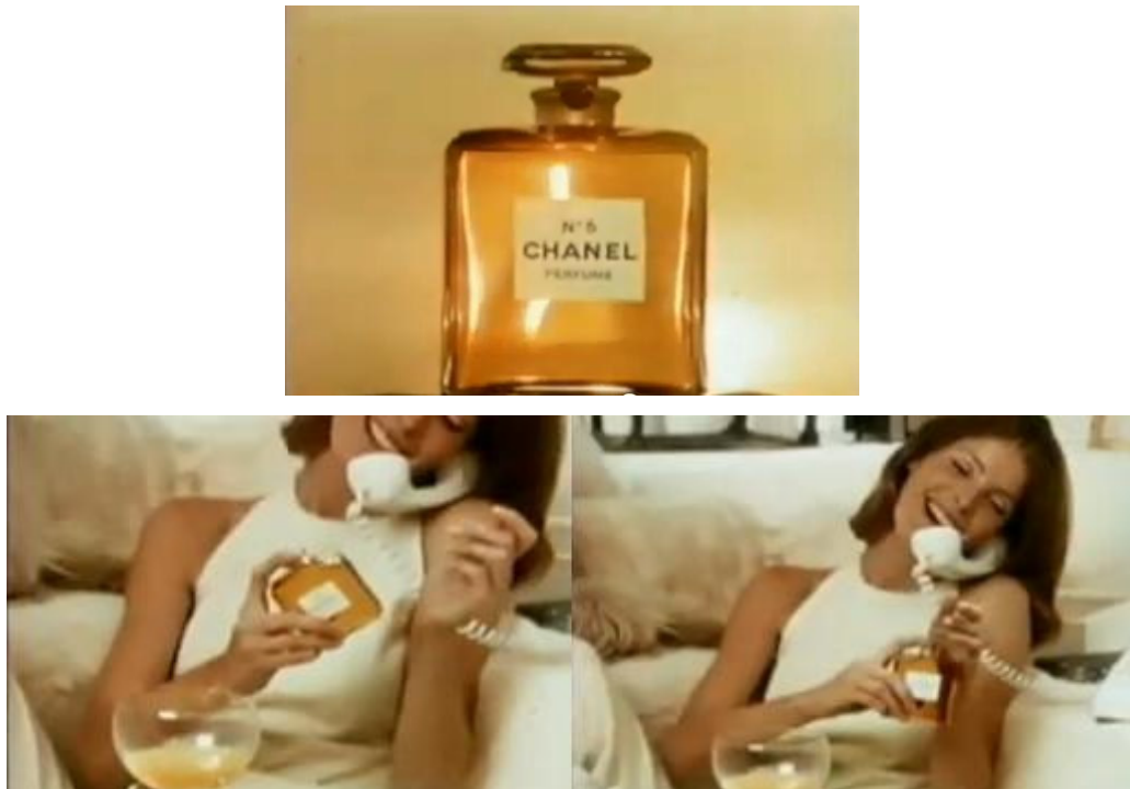
Figura 1 - As aparições do perfume no primeiro comercial