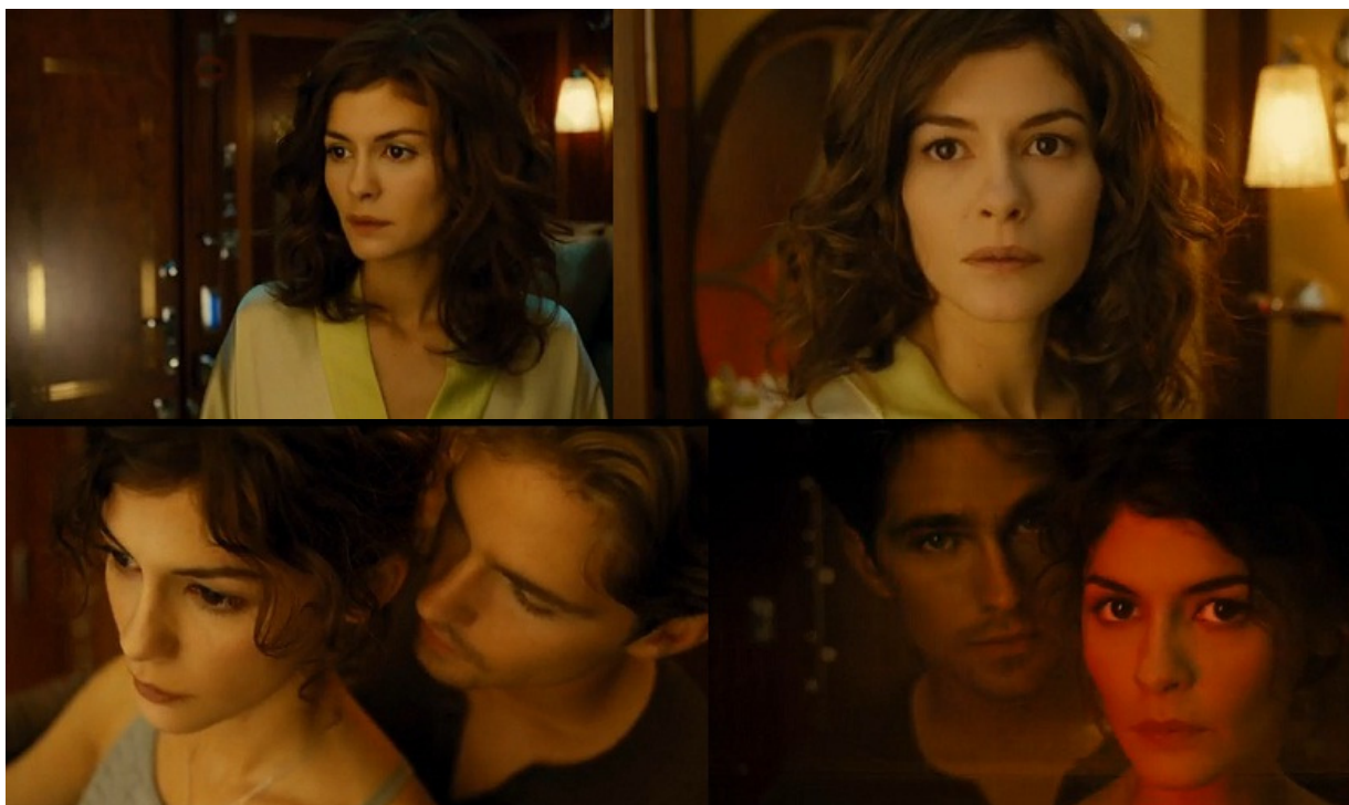
Figura 12 - A atuação de Audrey Tatou em Trem Noturno

Também ancorada nos clichês das histórias de amor (o encontro casual, a paixão – neste caso, desejo – à primeira vista, as coincidências, os desencontros), a publicidade apresenta uma mulher que faz uma viagem noturna de trem, onde cruza com um aparentemente desconhecido, com o qual tem uma “química” instantânea. Em seguida, são mostrados os desencontros dos dois ao longo da viagem, tanto no próprio vagão do trem quanto no passeio durante uma parada em uma cidade. Como não há nenhum diálogo ou narração, a dinâmica se concentra especialmente na expressão dos atores, seus olhares, gestos e movimentos corporais, que muitas vezes parecem coreografados, estando afinados também com o jogo de luzes e com a trilha sonora. Nesse ponto, importante ressaltar a atuação de Tatou, com seus olhos reveladores, sempre realçados pelo trabalho do diretor, concentrando, em muitas cenas, a atenção do espectador, que é levado a sentir-se tão perturbado quanto ela com a presença do rapaz.