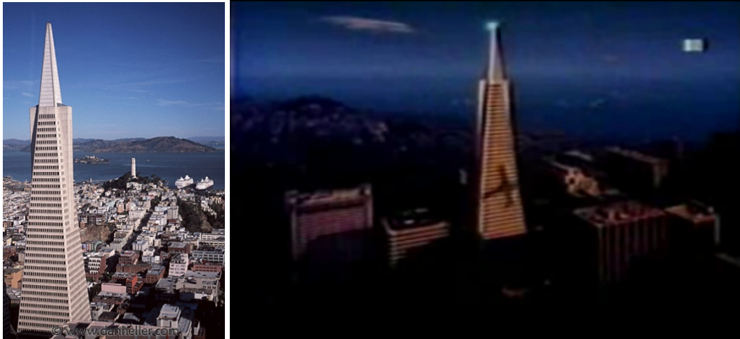
Figura 5 – O edifício Transamérica e a cena do comercial Catherine/Charles

A personagem, com todas as alusões feitas durante o comercial, é construída como uma mulher viajada, moderna, bem sucedida, cosmopolita – transitando com naturalidade entre o grande centro financeiro que é São Francisco e a maravilha cultural e artística representada por Paris. Mesmo para o intérprete que não capta todas essas sugestões, a caracterização da personagem, com seu figurino elegante – o tailleur Chanel, símbolo da mulher de negócios chique e atualizada – e seus cabelos e maquiagem que, embora lhe garantam uma imagem sexy, são muito sofisticados, é bastante eficiente para construir visualmente essas características.