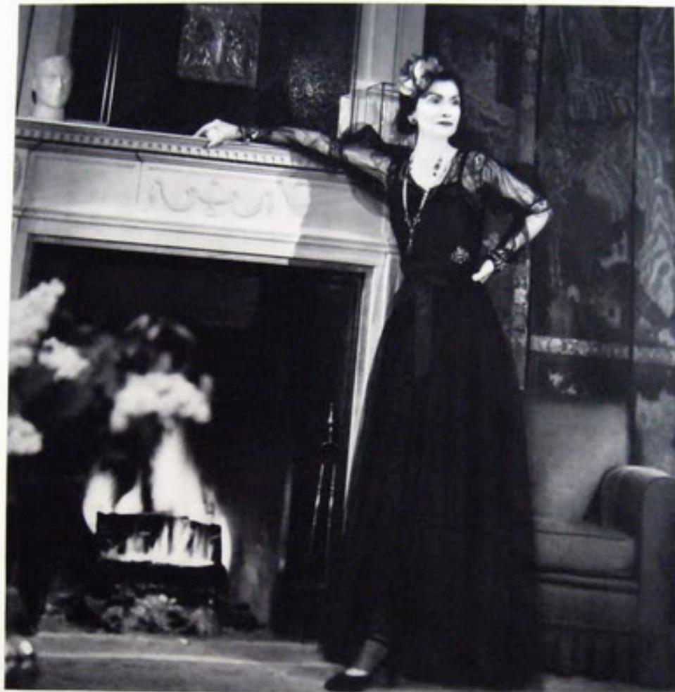
Madame Gabrielle Chanel in her new apartment in the Ritz, Paris

Anúncio de 1937, estrelado por Coco Chanel