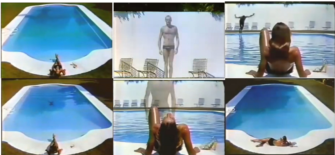
Figura 3 – Em sequência cronológica, alguns planos do comercial de Ridley Scott

A melodia etérea da trilha sonora, com acordes ‘tilintantes’, é um fator importante na composição da atmosfera de fantasia e de sonho da protagonista, assim como os meios visuais (efeitos especiais) e de montagem. Para esse comercial, diferentemente dos estrelados por Catherine Deneuve, por exemplo, a mulher representa um estilo de vida luxuoso, requintado, de aproveitar os prazeres do corpo e da vida, diretamente relacionado à época. Compartilhar a fantasia do N° 5 aqui é, portanto, consumir mais que o perfume, mas todos esses significados que ele carrega consigo, entregando-se a uma vivência mais lúdica, sensual, divertida.