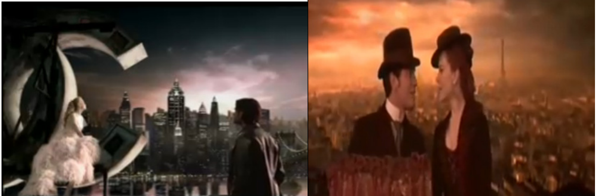
Figura 10 - Cenas de “Chanel Nº 5 – O Filme” e de “Moulin Rouge”, respectivamente