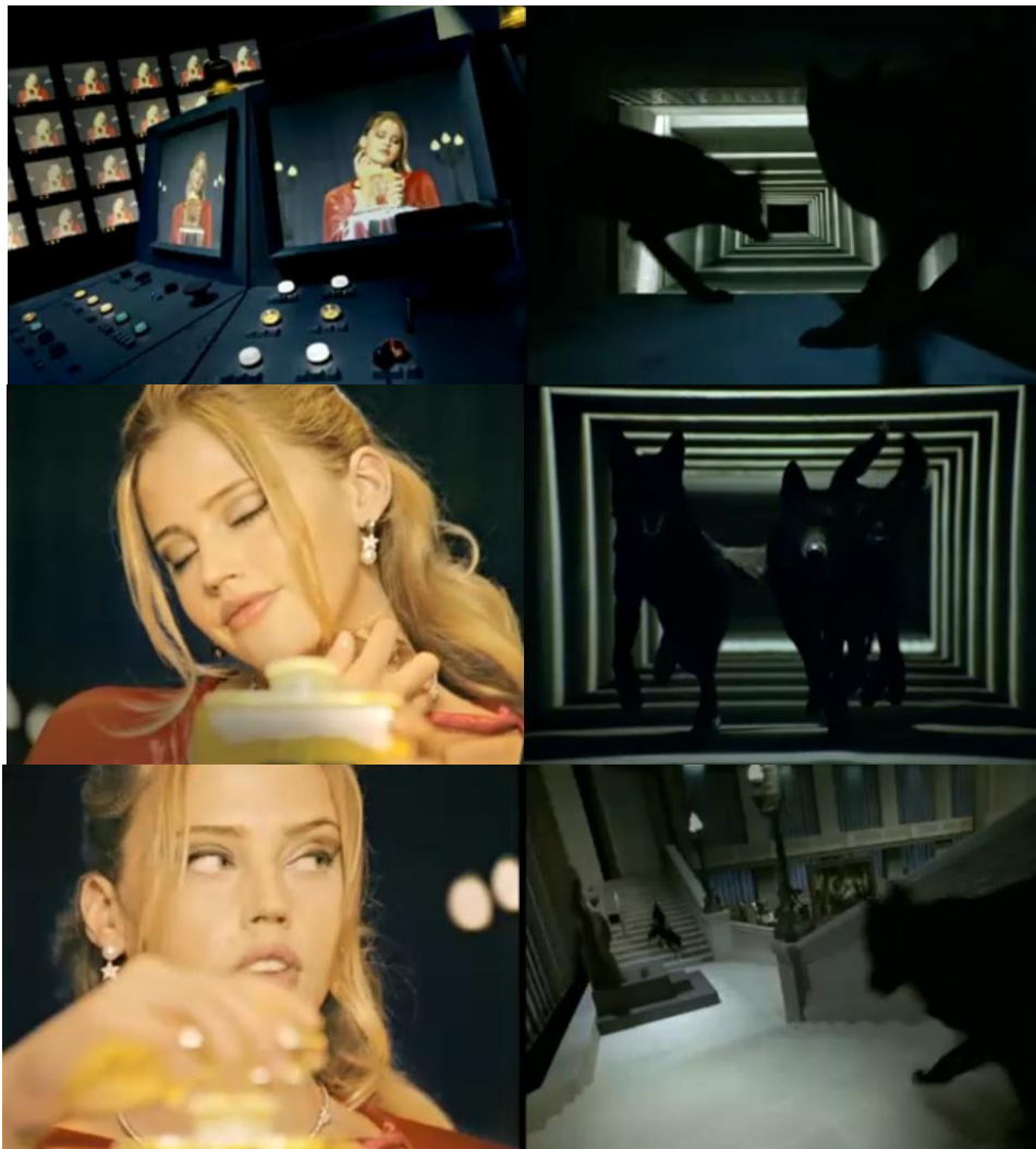
Figura 7 – A alternância de planos na perseguição da personagem pelos lobos, no primeiro comercial

Por fim, é importante falar de um meio essencial para a construção da tensão no primeiro filme: a montagem, que garante ao comercial seu toque de suspense (pelo uso de planos intercalados da fuga da protagonista e da perseguição dos lobos), de modo que o espectador fica ansioso para ver se a Chapeuzinho vai escapar ou não, e, ao final do filme publicitário, sente-se contente quando ela desaparece na cidade. No segundo comercial, por sua vez, o lobo aparece cansado, com a língua de fora, não se esforçando mais em correr para alcançar a personagem principal, de modo que, pelo modo como a escala de planos o mostra, o espectador percebe que, neste caso, ela conseguirá fugir, e não se espanta ao ver o lobo lhe obedecer, ficando sentado a observá-la ir embora, e emitindo um uivo que soa triste quando ela de fato lhe deixa.