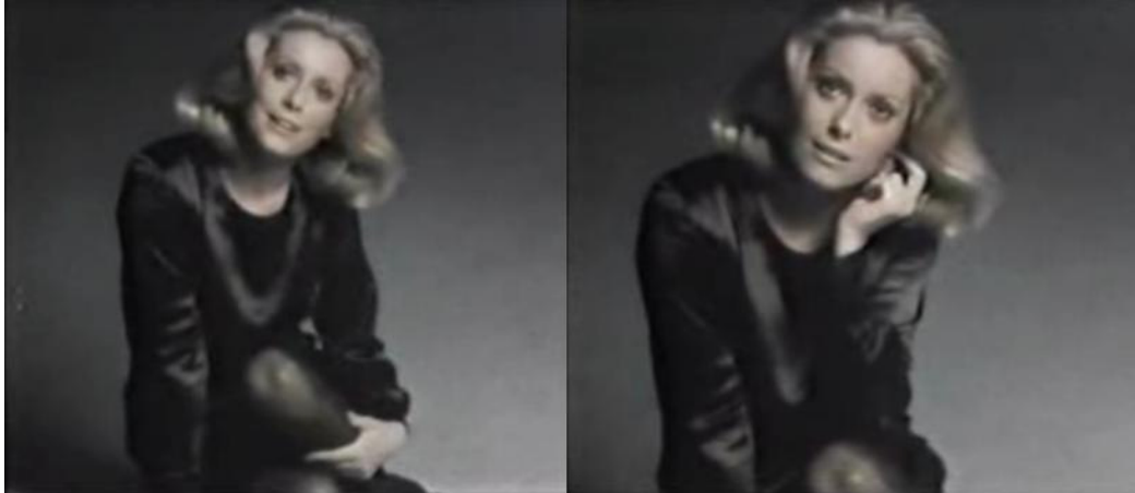
Figura 2 - A sobriedade de figurino e cenário no segundo comercial com Catherine Deneuve

No terceiro filme 55 , ao invés da pausa, os sorrisos e olhares – e levantar de sobrancelhas – são mais importantes que o ritmo da fala, destacando trechos como “mas às vezes nós somos muito difíceis” 56 (se referindo às mulheres) e “então fazemos um trato, apenas você e Catherine Deneuve, nunca mude nada” 57 . Esta fala, especialmente, evoca de maneira evidente o encanto próprio da ‘trilogia’, pois propõe um pacto entre a atriz e o espectador, ao mesmo tempo em que remete ao peso de seu nome – ao contrário do segundo vídeo, em que ela tenta abrandar seu lugar de fala diferenciado, afirmando que o fato de ela ser Catherine Deneuve não é importante, e se colocando como uma pessoa simples, a quem se pode ter acesso. O efeito, no terceiro vídeo, como se pode notar, talvez fosse outro se ela dissesse “vamos fazer um acordo, apenas você e eu”.