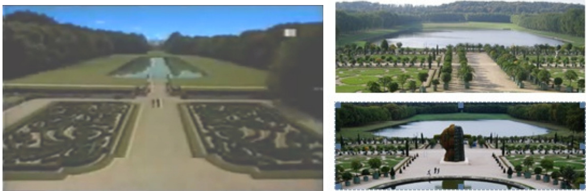
Figura 4 – Plano inicial do comercial Catherine/Charles e fotos dos jardins de Versailles

A partir dessas indicações, um espectador com maior bagagem cultural pode remeter o jardim mostrado àquele do Palácio de Versailles e, depois da apreciação de toda a peça publicitária, supor que a mulher tenha ido à França, onde conheceu Charles, e onde viveram um romance, e quem sabe até viajaram de trem – passeio comum no país, que está conectado por diversas linhas. A escolha do ambiente, mais uma vez, não é casual: Paris é conhecida como uma das cidades mais românticas do mundo. Já a cena do avião, que aparece em seguida, pode fazer o espectador supor que Catherine voltou dessas ‘férias’, encontrando-se agora em sua casa, de onde se avista uma torre (mais uma vez, uma referência explícita: trata-se do edifício Transamerica, famosa construção da cidade americana de São Francisco, criado para resistir a abalos sísmicos) onde se lembra do caso com Charles e aguarda sua chegada – sugerida pela cena que mostra outro avião, dessa vez sobrevoando o Transamérica. Depois que o frasco do N° 5 é mostrado, a pergunta íntima feita por ele poderia ter sido “qual o seu perfume?”. Assim, resta ao espectador fazer inferências – essas e outras, que irão variar de acordo com seu repertório – sobre o que significam todas as passagens do comercial, e, assim, compartilhar das fantasias de Catherine.