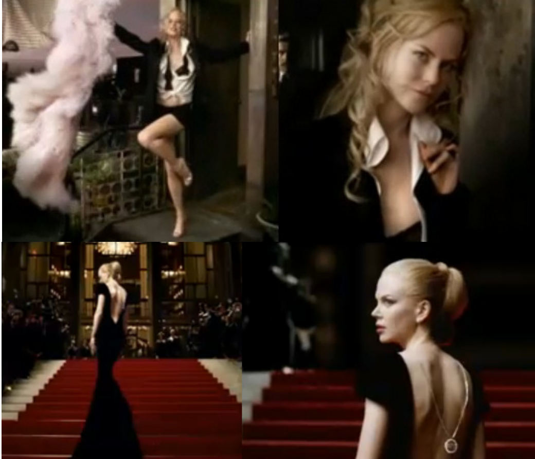
Figura 11 - A evolução do figurino e do penteado da personagem ao longo de Chanel No 5 – O Filme