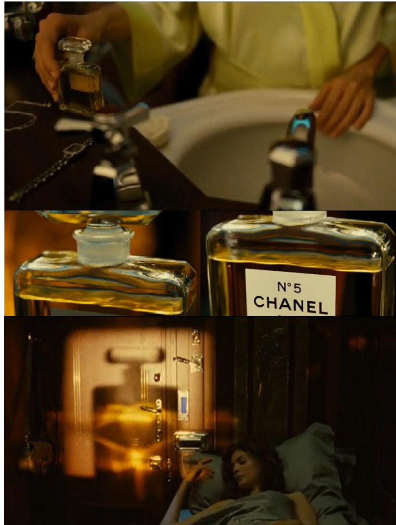
Figura 13 - As aparições do perfume no comercial Trem Noturno

Assim como no primeiro comercial do N° 5, do fim dos anos de 1960, o perfume surge naturalmente em meio à ação, quando a personagem o aplica antes de dormir. Em Trem Noturno , no entanto, ele atua quase como um personagem, sendo mostrado detalhadamente, em planos detalhe de seu frasco e tendo sua sombra projetada nas paredes do quarto e sobre a personagem. Assim, sua importância como item feminino básico e, ao mesmo tempo, como elemento diferencial que torna uma mulher marcante é devidamente ressaltada.