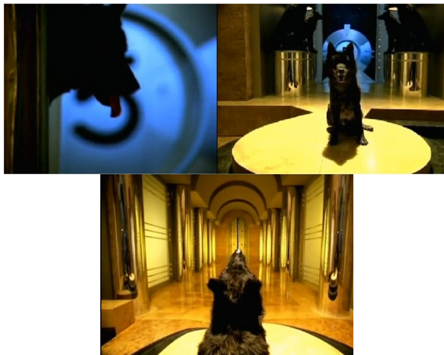
Figura 8 – A mostraç o do lobo no segundo comercial