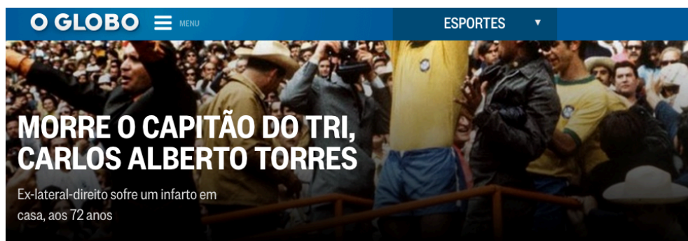
Figura 1: Destaque do jornal O Globo 25/10

Carlos Alberto Torres ergue a taça do título de 1970. Ele morreu nesta terça-feira, aos 72 anos