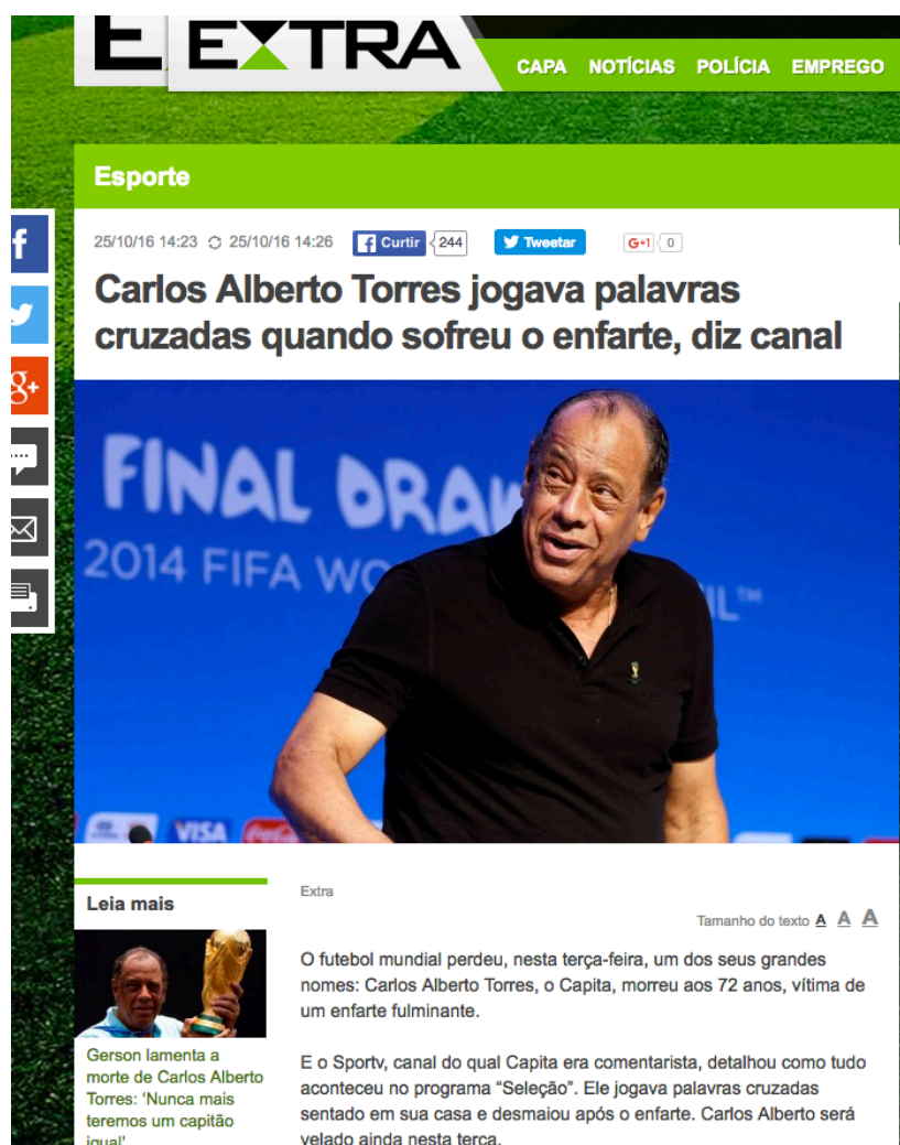
Figura 2: Destaque do jornal Extra 25/10/2016

No dia 25 de outubro de 2016, os dois veículos destacaram no topo das páginas iniciais, a morte do ex-jogador de futebol Carlos Alberto Torres, mas com enquadramentos que marcam a linha editorial de cada um dos produtos. No extra: "Carlos Alberto Torres jogava palavras cruzadas quando sofreu enfarte, diz canal". Já no Globo: "Morre o capitão do tri, Carlos Alberto Torres Ex-lateral-direito sofre infarto em casa, aos 72 anos ". Enquanto o Extra priorizou, no lead e no título, o aspecto curioso relacionado à morte do ex-jogador, o fato de que ele jogava cartas no momento do infarto, O Globo recontou a biografia de Torres, sem nem ao menos mencionar a circunstância incomum destacada pelo Extra. A comparação demonstra como a linha editorial influencia no que é notícia nos dois jornais.