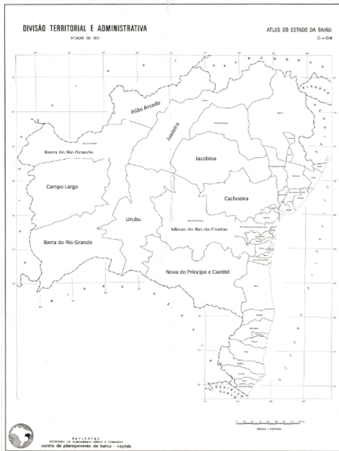
Figura 1 – Divisão territorial e administrativa da Bahia – Situação em 1827.