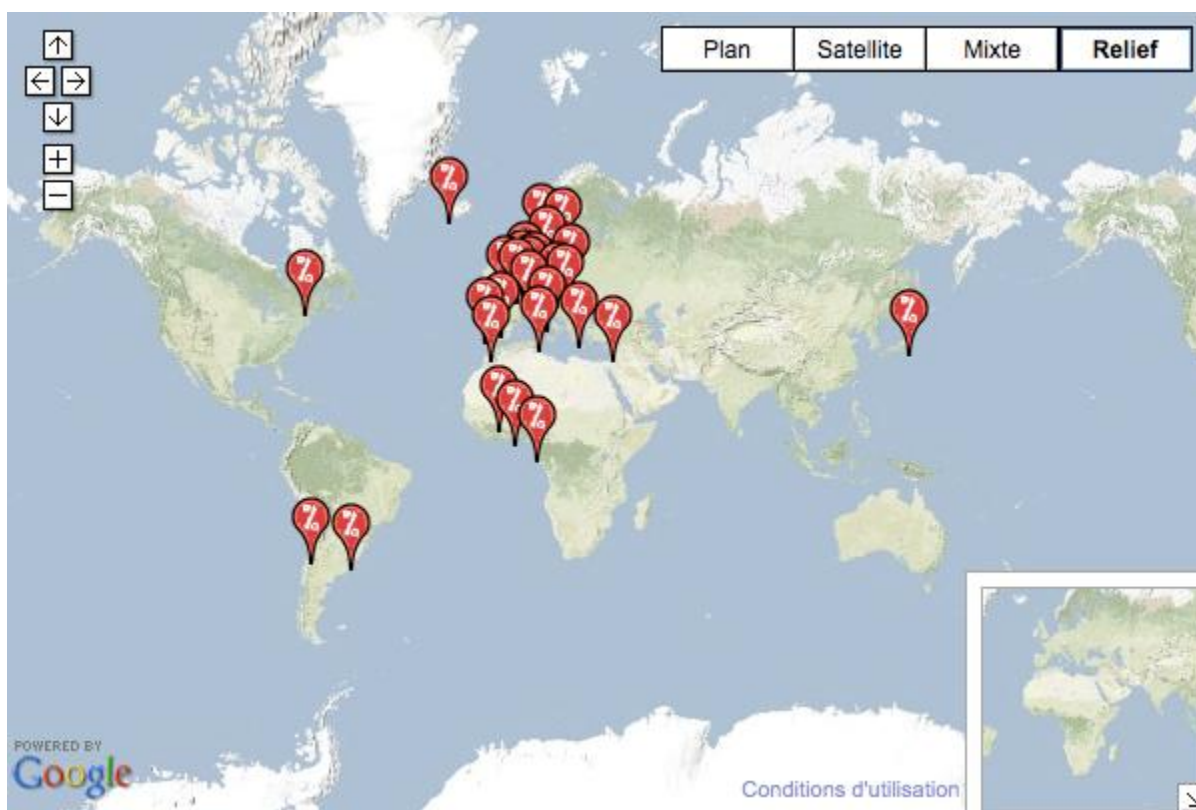
Mapa 1: ATTAC no mundo