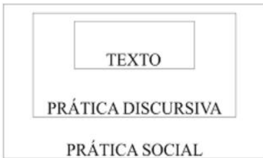
Figura 1 – Concepção tridimensional do discurso em Fairclough apud Ramalho e Resende (2004) 50 .