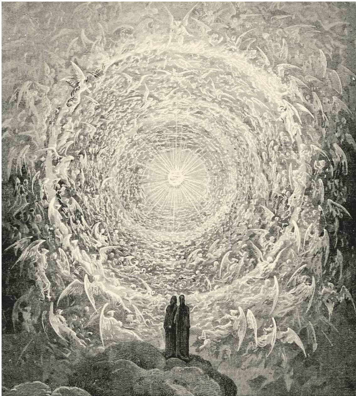
Paraíso, canto XXXI: Dante e Beatriz, no céu empíreo, contemplam a milícia santa em “forma de branca rosa” (Divina Comédia)