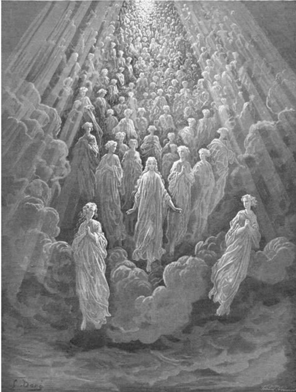
Paraíso, canto V: A miríade de almas incandescentes do segundo céu (para a Divina Comédia)