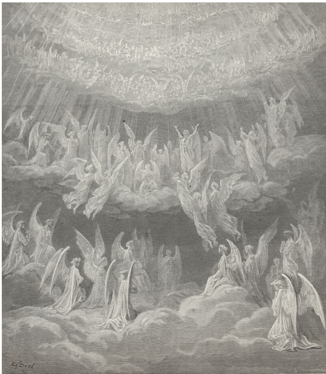
Paraíso, canto XXVII: Ascensão ao nono céu – ou Primeiro Móbile (Divina Comédia)