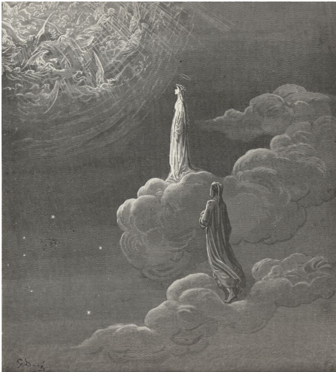
Paraíso, canto XIV: Beatriz e Dante ascendem ao (quinto) céu (Divina Comédia)