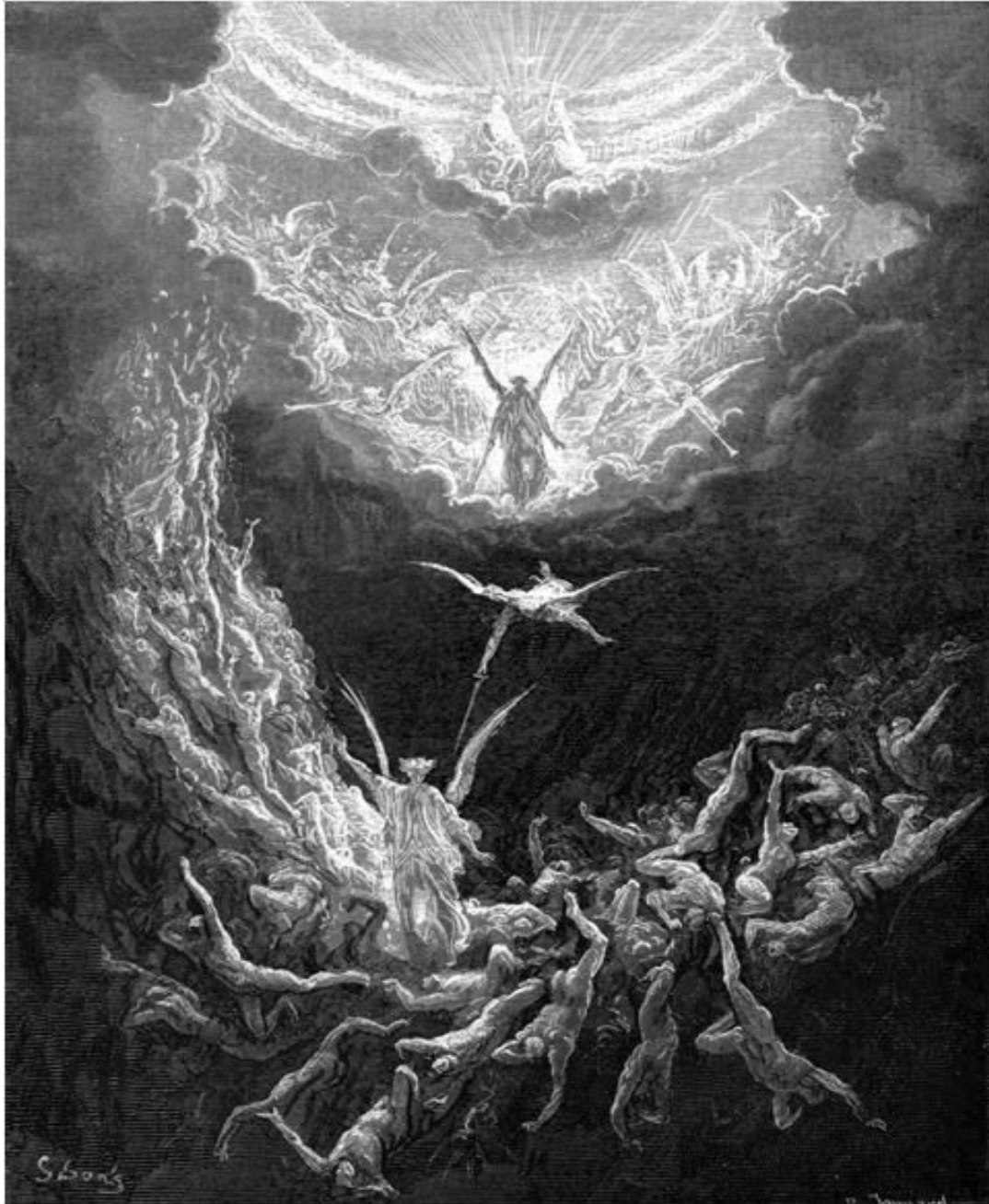
Apocalypse XX, 12: Os condenados à danação no Juízo Final (Bible Illustrée)