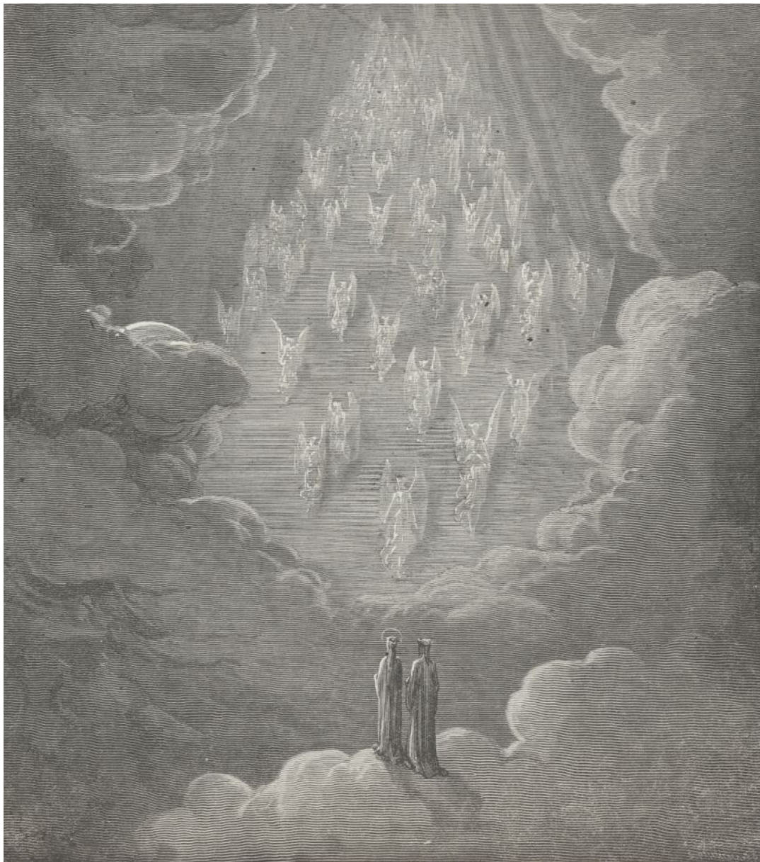
Paraíso, canto XXI: Dante e Beatriz passam do céu de Júpiter ao céu de Saturno (Divina Comédia)