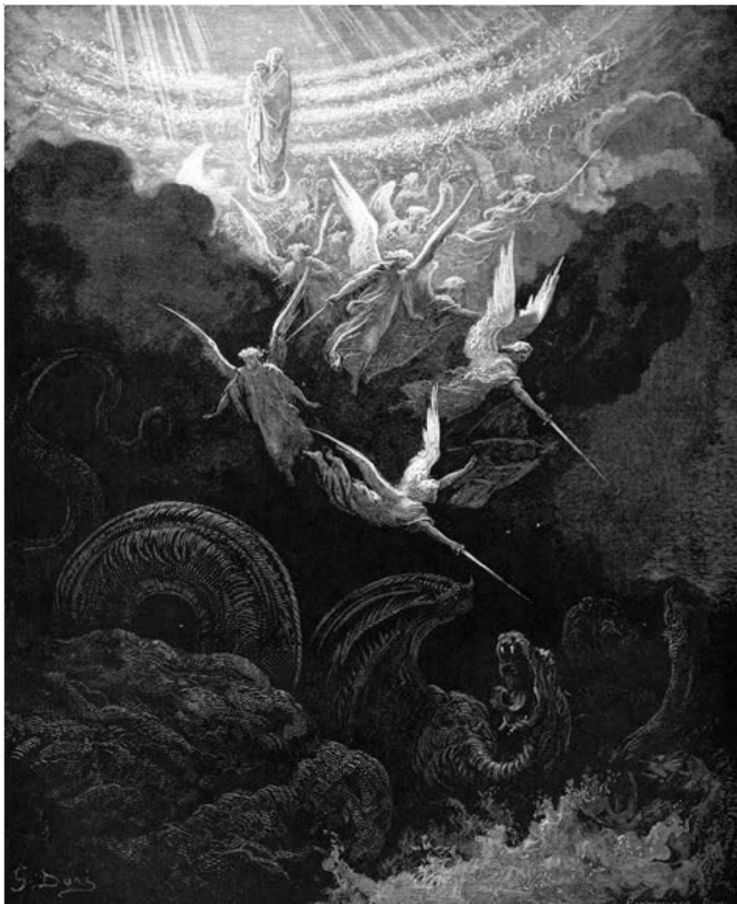
Apocalypse XII, 1-3: As milícias celestes, em socorro à Virgem coroada de Sol, lançam o ataque definitivo à Besta-Fera (Bible Illustrée)