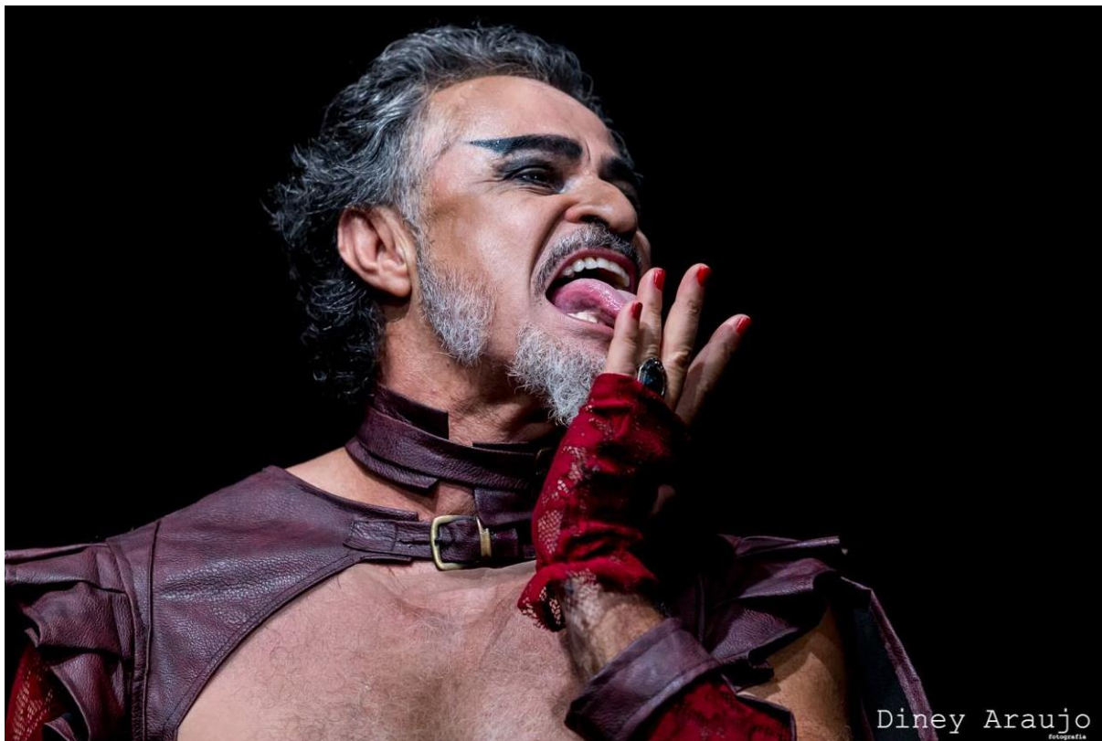
Figura 3 – foto de Sade - Diney Araujo, 2015

Sade , Quarteto e Sargento Getúlio mostram um articulador entre texto e cena que prima pelo acabamento. Gil Vicente tem a capacidade de criar obras minimalistas, sem elementos desnecessários e com atores sempre afiados. A maneira como cada detalhe se encaixa provoca uma sequência de ações semelhantes a uma coreografia. É um encenador dramaturgista com demasiado apressa ao texto dramático e às possibilidades que podem nascer dele.