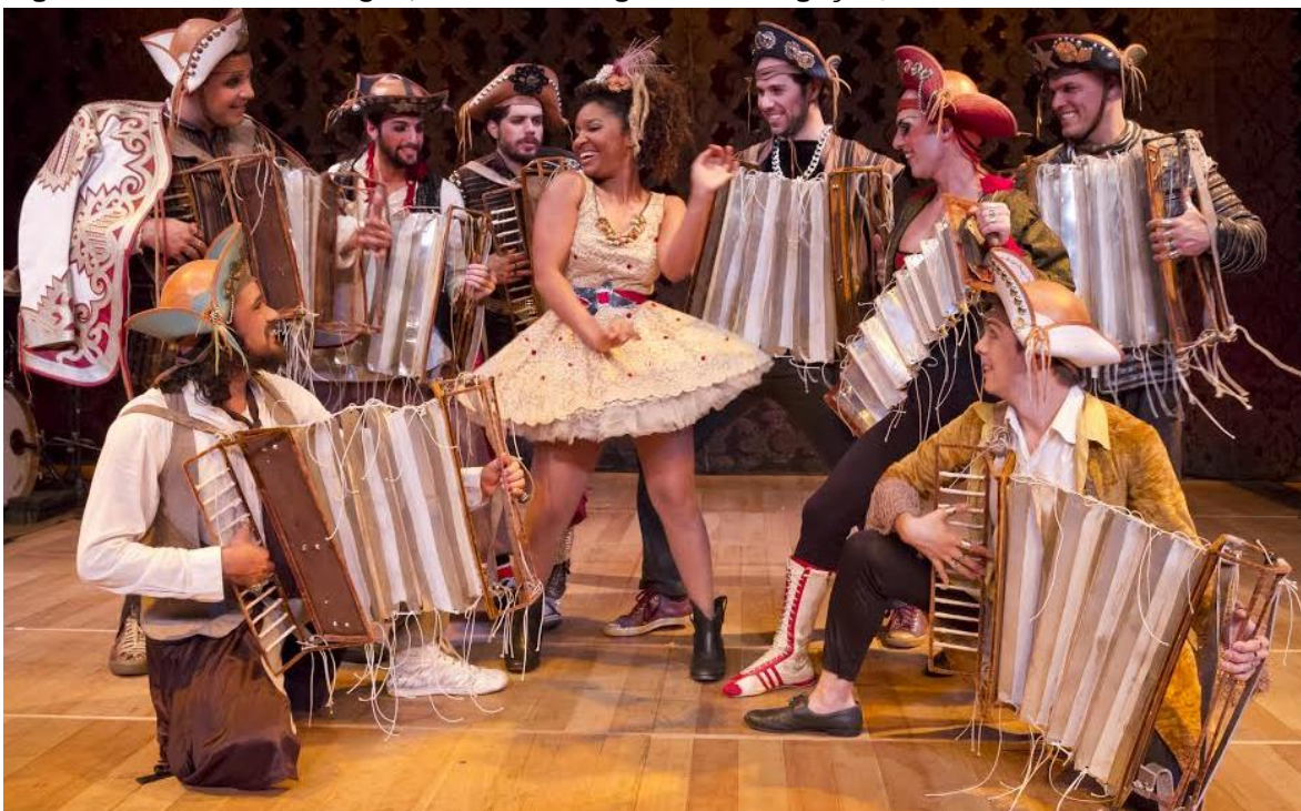
Figura 8 – Foto de Gonzagão, a lenda – Imagem da divulgação, 2012.

Essa possibilidade de sempre experimentar coisas novas, sem ser algo fechado, é o principal aspecto positivo desse acúmulo: “a maior vantagem é experimentar a cada dia, a cada etapa do trabalho” Caso os papéis fossem divididos como nas cartilhas, suas funções seriam limitadas, “não poderia ser tão mutante e isso não seria completo”. Por isso, no seu trabalho, não enxerga pontos negativos em ser encenador e dramaturgista, pois só saberia fazer assim, “é inerente, para mim é muito natural isso, não vejo de outra maneira, é irresistível esse acúmulo” (p. 148).