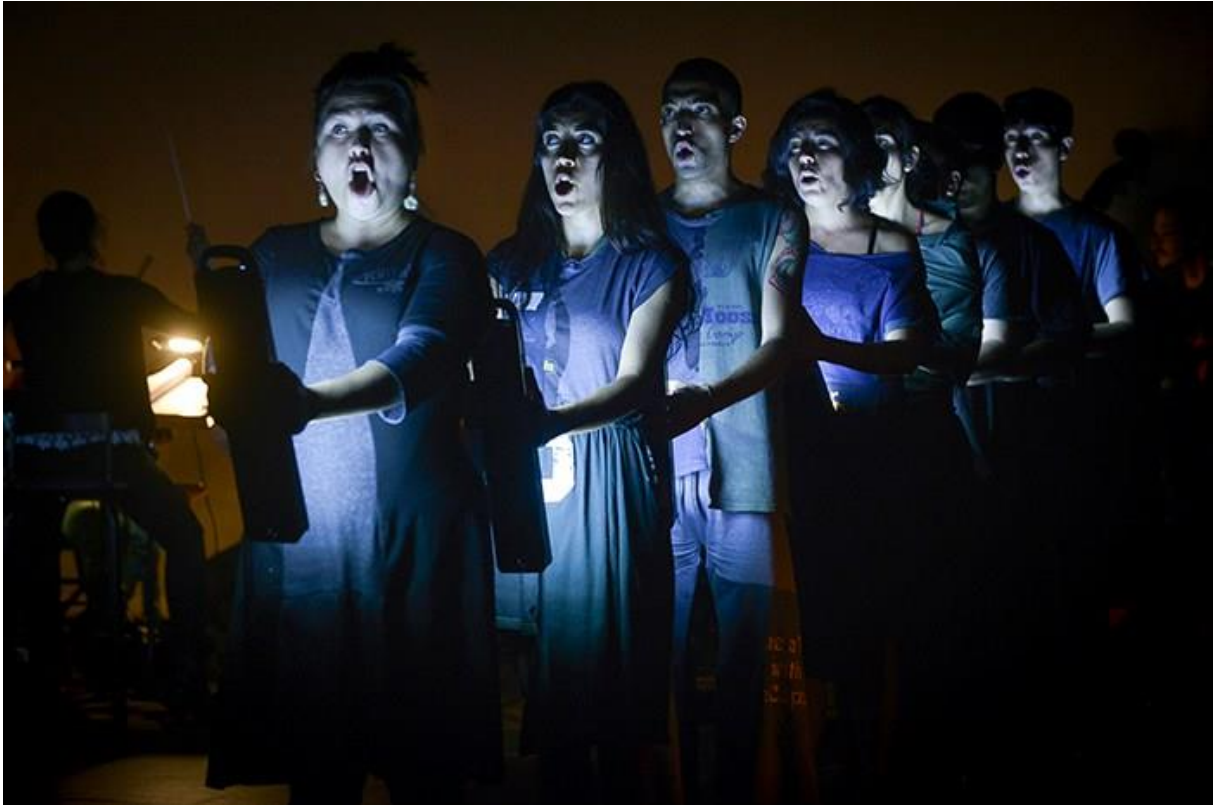
Figura 12 – Foto de La Isla de los peces – Imagem da divulgação, 2015.

Ao tratar do diretor, Romero (p. 150) diz que “é difícil ou mais que difícil, é muito complexo” referir-se ao seu papel porque ele tem várias funções, “dependendo do processo artístico em que está envolvido”. Ou seja, o diretor comporta-se de acordo com a necessidade e o tipo de processo, que cada vez mais são variados. De maneira geral, para ocupar esse cargo, ela define como essencial o incumbido ter as ferramentas para ser um guia na articulação da cena, pois o encenador “é quem deve articular todo o material, tanto humano quanto o artístico (teórico, corporal e espacial)”, algo semelhante ao descrito por Pavis (2015, p. 124) quando trata função da conciliação: