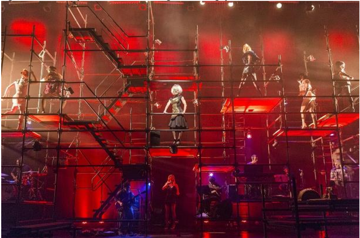
Figura 9 – Foto de Ópera do Malandro – Imagem da divulgação, 2015.

Ele tem um problema crônico no desenvolvimento do seu roteiro, que se agrava muitíssimo na parte final quando tem-se a impressão que o autor resolveu numa “canetada” encerrar o espetáculo de uma hora para outra, prejudicando sensivelmente sua fluência narrativa.