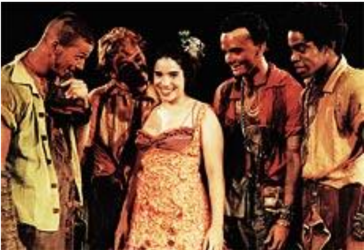
Figura 7 – Foto de A máquina - Autor desconhecido, 2010.

Falcão já assinou vários elementos de suas peças e considera o cenário algo determinante. Em A Máquina (2000), adaptação do romance de Adriana Falcão, por exemplo, tudo surgia de