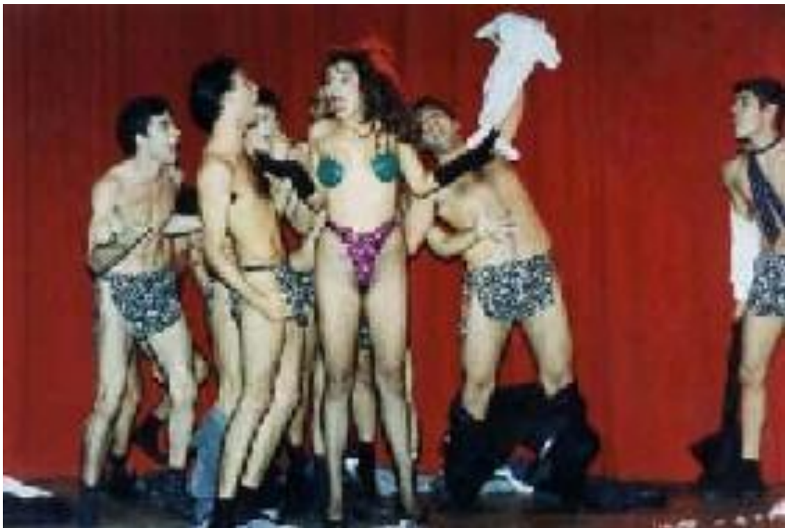
Figura 5 – Foto de Cabaré Brasil , 1995.

Em trabalhos anteriores, como Cabaré Brasil (1995), revela que, pela dificuldade de encontrar peças prontas, agia na ordem inversa: escrevia como um autor de novela mais ou menos faz (capítulo por capítulo), de acordo com o grupo de atores e o desenvolvimento do projeto. Hoje, para ele, assim como para Vicente, seja qual for o método desse registro, o fato é que quando encontra ator, tudo se transforma. Ou seja, torna-se incompatível pensar todo o espetáculo antes desse encontro. Cunha enxerga o ator como figura importantíssima e complexa: “ao mesmo tempo em que é ativo, o elemento atuante, criativo, criador, também é passivo, ele é um palco. Ele veste a roupa do figurinista, a maquiagem do maquiador, é iluminado pelo iluminador, segue as marcações do diretor” (p. 140).