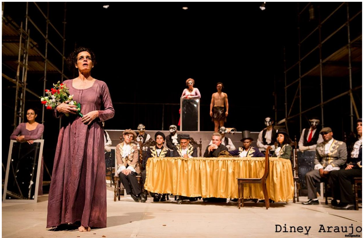
Figura 4 – Foto de As Confrarias - Diney Araujo, 2014.

Nesse mesmo trabalho, após estudar minuciosamente o texto e as circunstâncias de sua criação, Cunha adotou um procedimento comum aos seus processos: construir um núcleo de estudos preliminares. Esse centro de debates, liderado por ele, era formado por um grupo de profissionais escalados para o comando geral do espetáculo. Cunha os denomina dramaturgistas 18 , no sentido de críticos do processo. Foi para eles que apresentou as primeiras ideias e esse diálogo foi mantido até a apresentação do espetáculo.