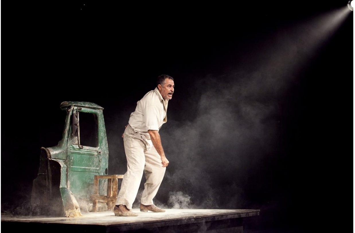
Figura 1 - Foto de Sargento Getúlio - acervo no Teatro Nu, 2011.

Seu cuidado com a dramaturgia possui relação com a qualidade dos textos produzidos por ele. Entre obras originais, adaptações e releituras, Vicente tem reconhecidos trabalhos na área literária como Os Javalis , Sargento Getúlio , Canto Seco e Sade . Este inclusive mereceu as palavras do crítico uruguaio Jorge Arias: