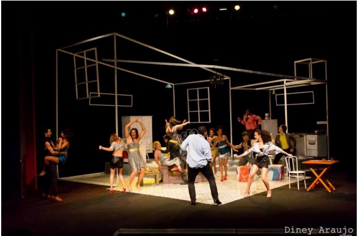
Figura 6 – Foto de Farsa Veríssima - Diney Araujo, 2013.

Quando questionado sobre sua preferência por elencos grandes, Cunha afirma não ter uma resposta: