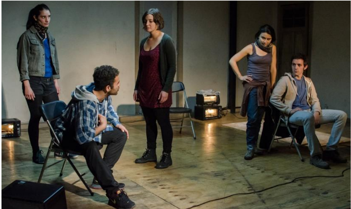
Figura 10 – Foto de Oriente – Imagem da divulgação, 2013.