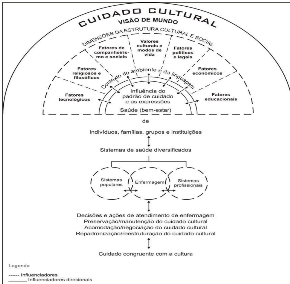
Figura 1: Modelo Sunrise. Reproduzida sem autorização da editora. Tradução livre.

No Modelo Sunrise, os cuidados de Enfermagem estão em intersecção com o cuidado genérico (popular) e o cuidado profissional. A enfermeira é quem tem maior contato com quem é cuidado, assume o papel de educadora e facilitadora da interligação cliente e demais profissionais de saúde.