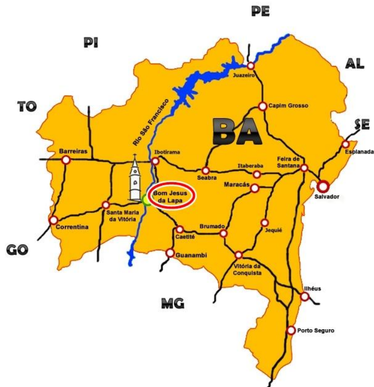
Figura 2: Localização do município de Bom Jesus da Lapa (BA), onde se encontra o quilombo de Araçá Cariacá.