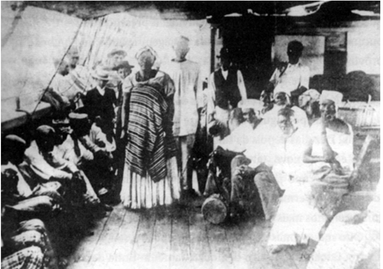
Figura 4- Africanos libertos no Vapor Cecilia em direção a cidade de Lagos em 1909