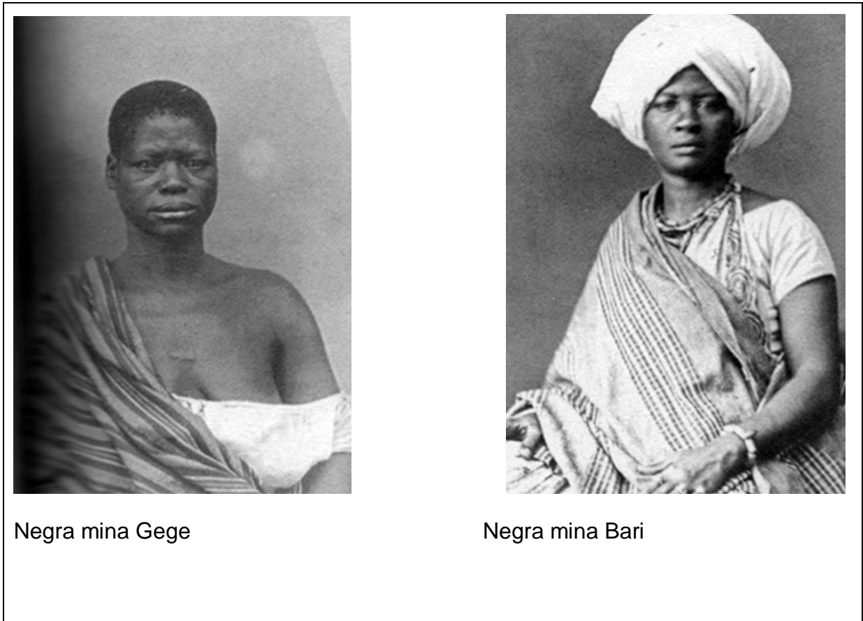
Figura 4 – Negras minas. Fotografias de Augusto Stahl 1866

Fonte: Livro Negros Estrangeiros- os escravos libertos e sua volta a África