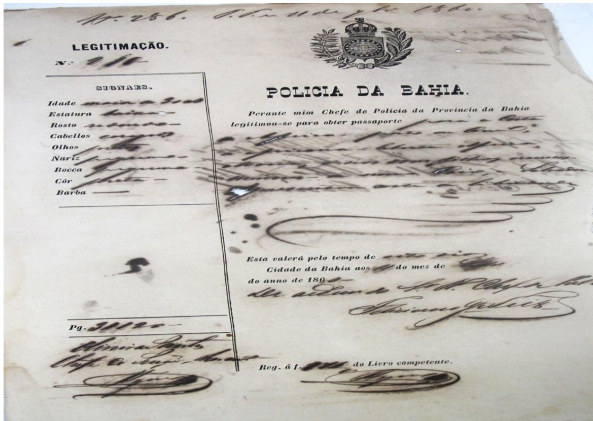
Figura 6 - Folha de passaporte contendo informações como: nome, condição jurídica, cor, descrições físicas, idade, e cidade de destino