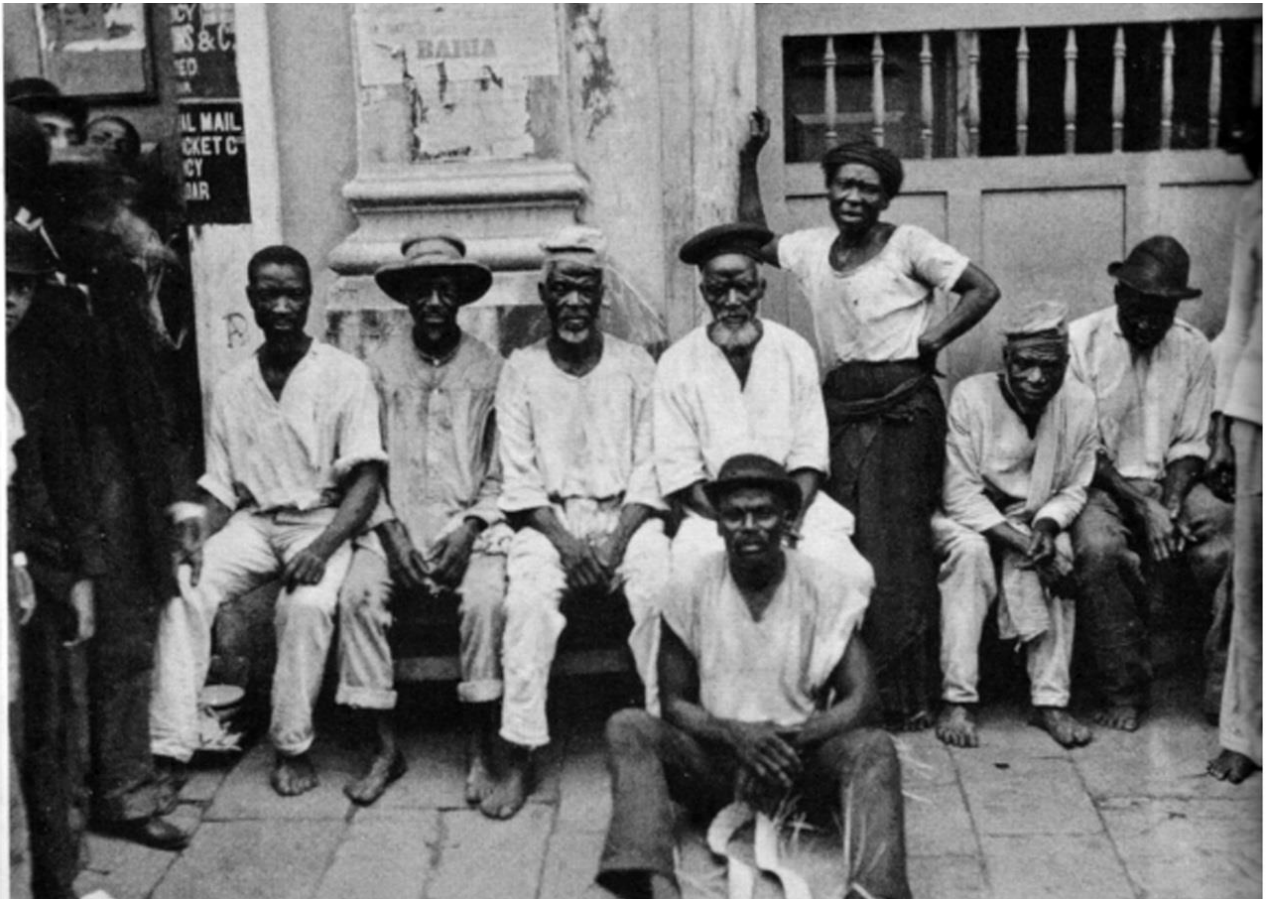
Figura 2 - Grupo de escravos que ofereciam serviços em um dos cantos de Salvador