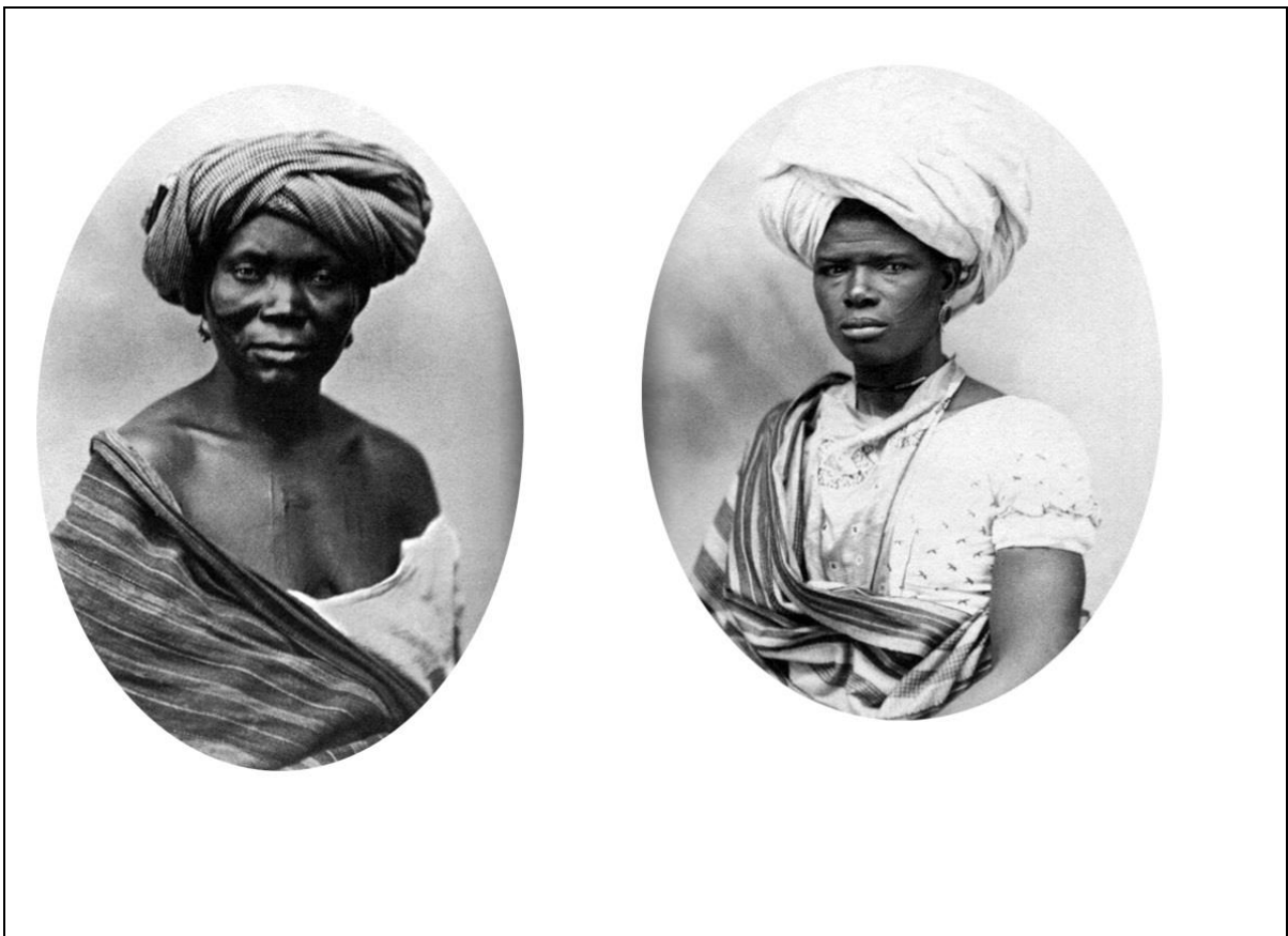
Figura 3 - Fotografias de africanas minas tiradas por Augusto Stahl no Rio de Janeiro em 1866 . À esquerda, africana mina da etnia tapa. À direita, africana mina da etnia nagô.