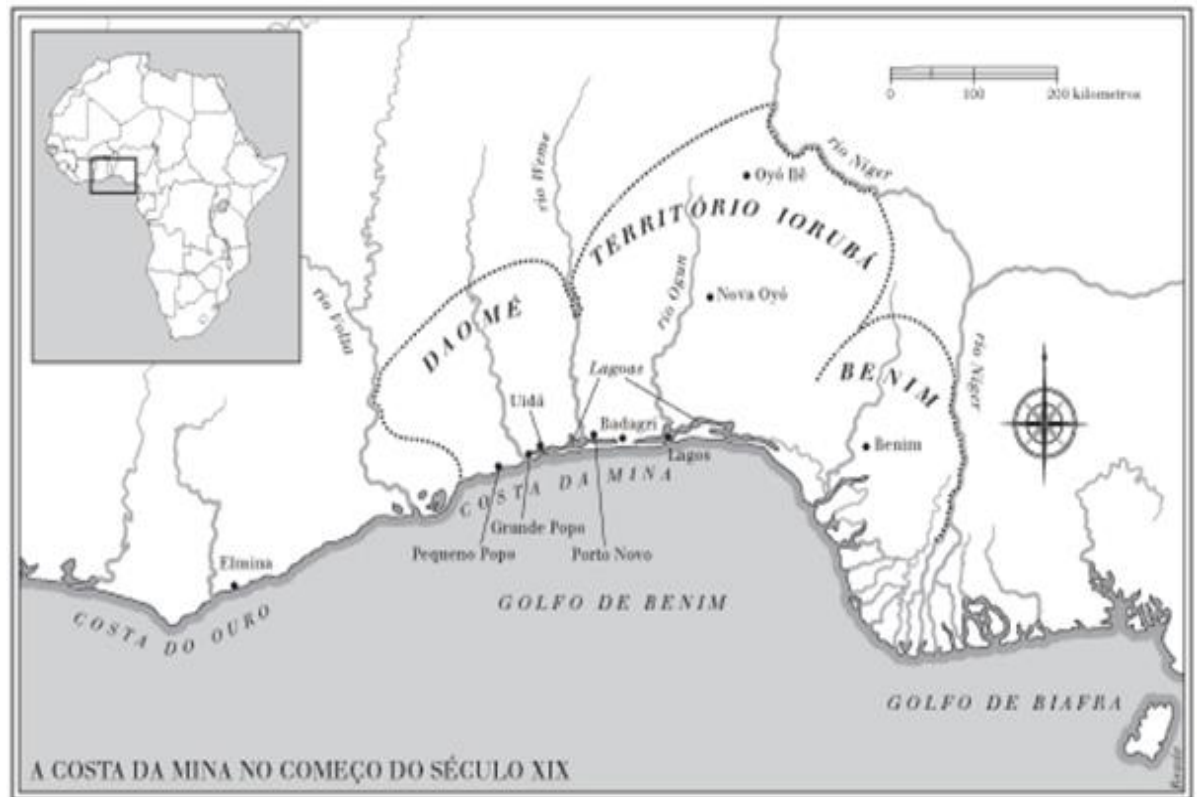
Figura 5 - Mapa da Costa da Mina no século XIX-