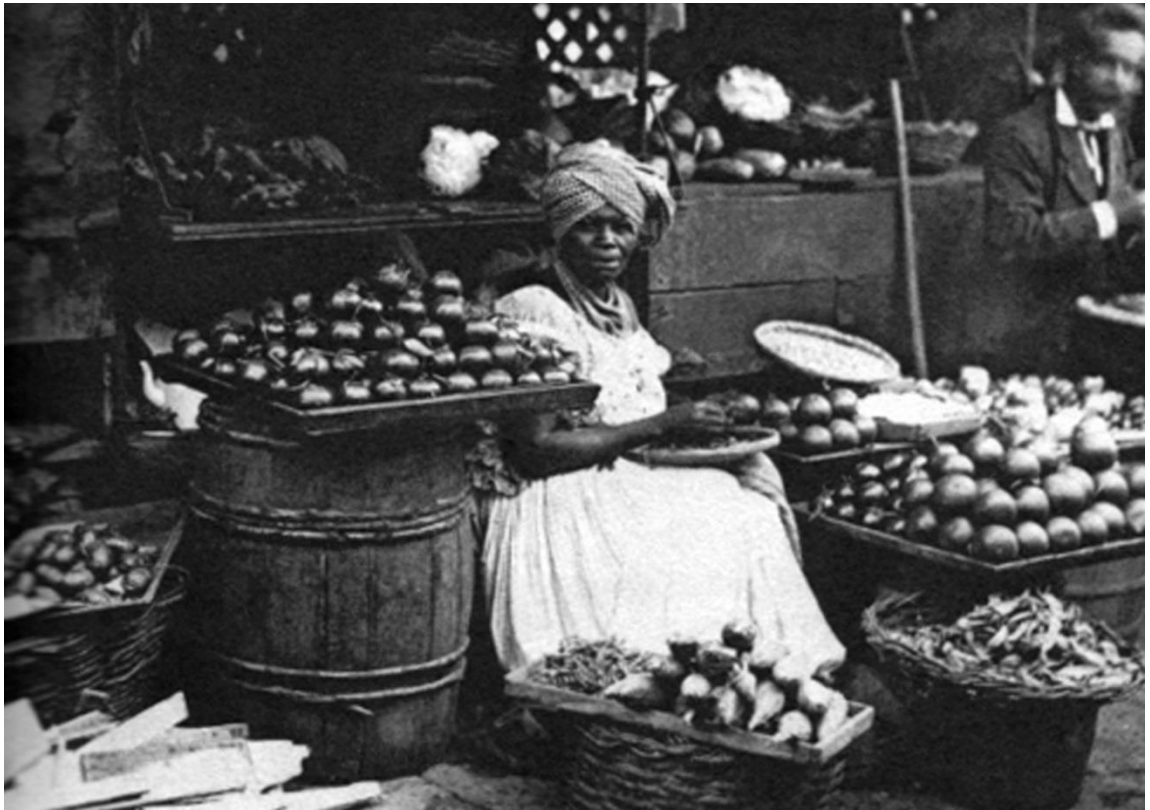
Figura 7 - Africana mina atuando na venda de frutas e legumes na cidade do Rio de Janeiro. Fotografia de Marc Ferrez 1875.

Fonte: Livro Negros Estrangeiros – os escravos africanos e sua volta à África .