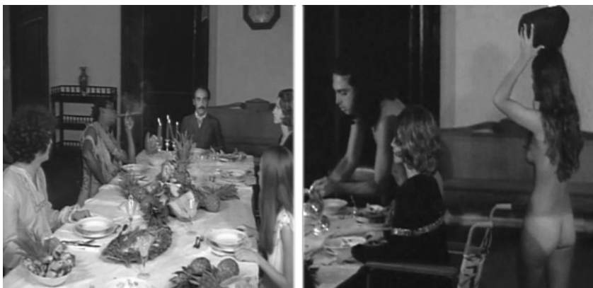
Fotogramas 9 e 10 – Calunga subverte a família.

para a Rainha: “a Rainha não se mete nessas coisas de marido e mulher”. O que parece acontecer é que Calunga ao interceptar o bilhete de Júlia, intercepta também os desejos dela escritos no papel. Mais tarde, quando ela diz a Hércules que quer se separar, o marido logo retruca: “aquele preto descarado é o culpado”. Júlia diz que o que Calunga fez foi revelar uma verdade que há muito tempo estava escondida.