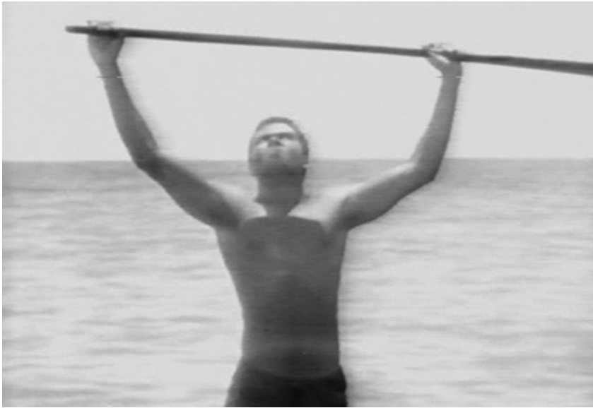
Fotograma 1 – Aruã comemora a calmaria do mar.

O objetivo declarado por Rocha (1981) era mostrar que sob formas de exotismo e beleza decorativa do misticismo afro-brasileiro haverá uma raça faminta, analfabeta, nostálgica e escravizada.