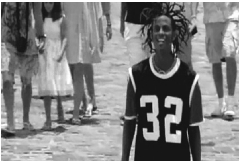
Fotograma 34 – o Brau Raimundinho.

ta com sentidos historicamente determinados de identidade e cultura negras, uma explosão exuberante de performances hipermasculinizadas e ritualmente agressivas. O mesmo autor explica que existe uma representação marginal dos Braus em escritos etnográficos dedicados a temas paralelos, no entanto, esses são éticos, recusam a proposta ilegal e, mesmo ganhando pouco, preferem se divertir nas cordas dos blocos no carnaval.