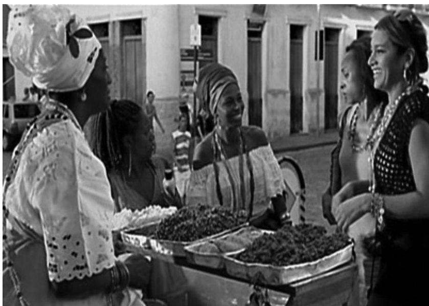
Fotograma 36 – As Baianas conversam com Psilene.

em um dia ir para o exterior. A falsa baiana é maldosa e rejeitada. Uma característica acentuada nesta personagem é o humor ácido. Ela utiliza o artifício da piada para negar seu fenótipo, acredita ter “a pele mais clara e o cabelo bom”. Vale recordar que, conforme Cascudo apud Pereira (2002), a anedota pode ser considerada uma espécie de sátira ou retrato clandestino dos costumes, capaz de revelar ao espírito coletivo uma entidade opressora e superior, tendo o poder de na falta dos meios indispensáveis à manifestação das críticas, funcionar como uma sátira política anônima, através do seu ataque desmoralizador e ridicularizante.