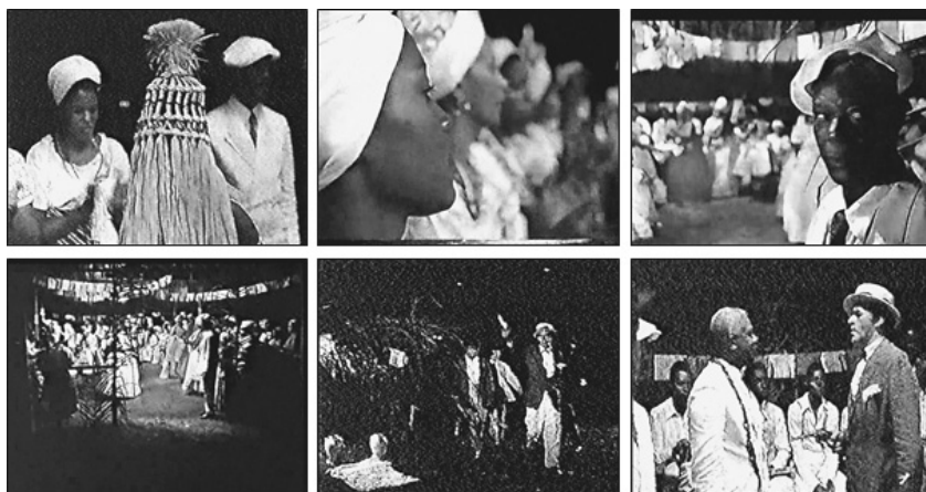
Fotogramas 22 a 27 – Policiais invadem terreiro de Candomblé.

Em Tenda dos Milagres, essa problemática é abordada no início do filme. A polícia chega e acaba com a festa do caboclo nas ruas de Salvador, Pedro Archanjo e seus amigos fogem fantasiados. Em outro momento, há uma festa no terreiro de candomblé e a polícia chega para repreender os participantes. A seguir é possível observar uma sequência de cenas em que a polícia invade um terreiro.