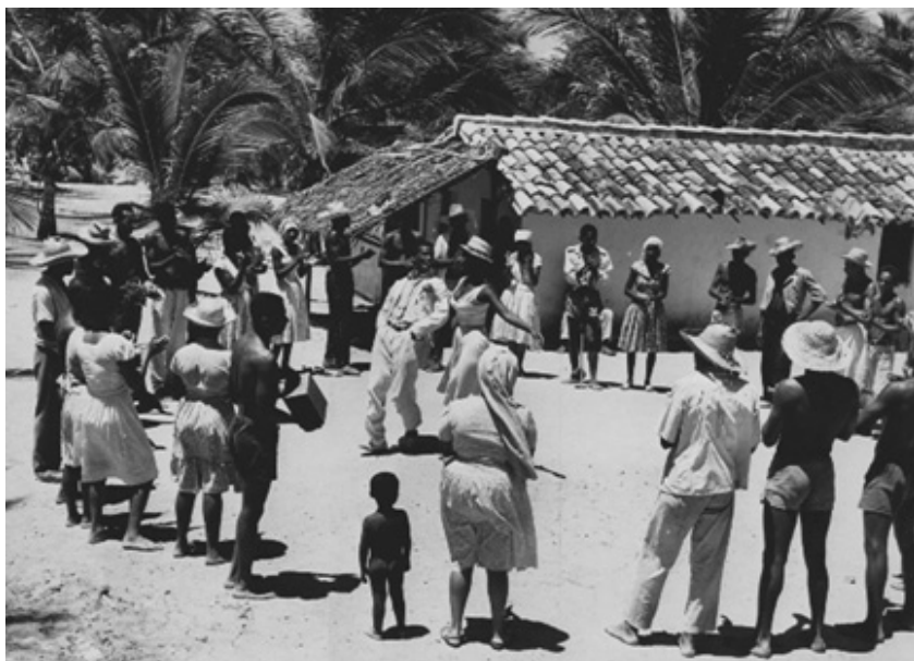
Fotograma 4 – Roda de samba.

Para Rekawek [200-?], a sequência do samba de roda em Barravento é uma referência bem sucedida a uma prática lúdica, fundamental para a cultura popular baiana. O diretor incorpora ao filme os habitantes da aldeia onde foi filmada a película sem lhes impor um papel que seria artificial, aproveitando assim sua ancestralidade e capacidade de serem testemunhos de seus hábitos.