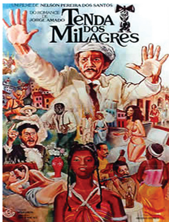
Figura 3 – Cartaz de Tenda dos Milagres .