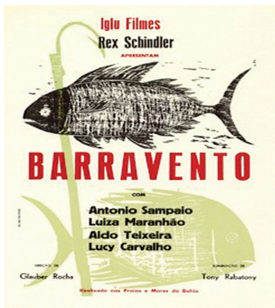
Figura 1 – Cartaz de Barravento .

A palavra que divide os dois mundos sugere, portanto, o confronto.