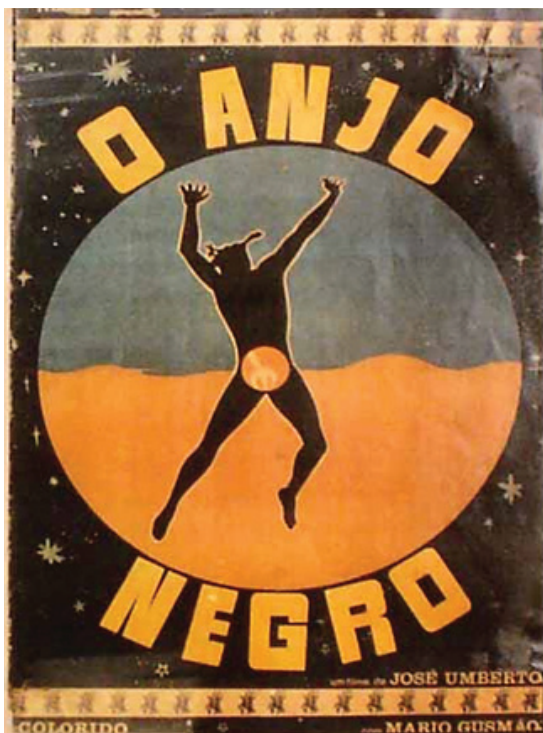
Figura 2 – Cartaz de O Anjo Negro .

sas características, houve uma identificação com o diabo e fizeram dele o símbolo da maldade. Na visão de Verger (1985), Exu não é “nem completamente mau, nem completamente bom”.