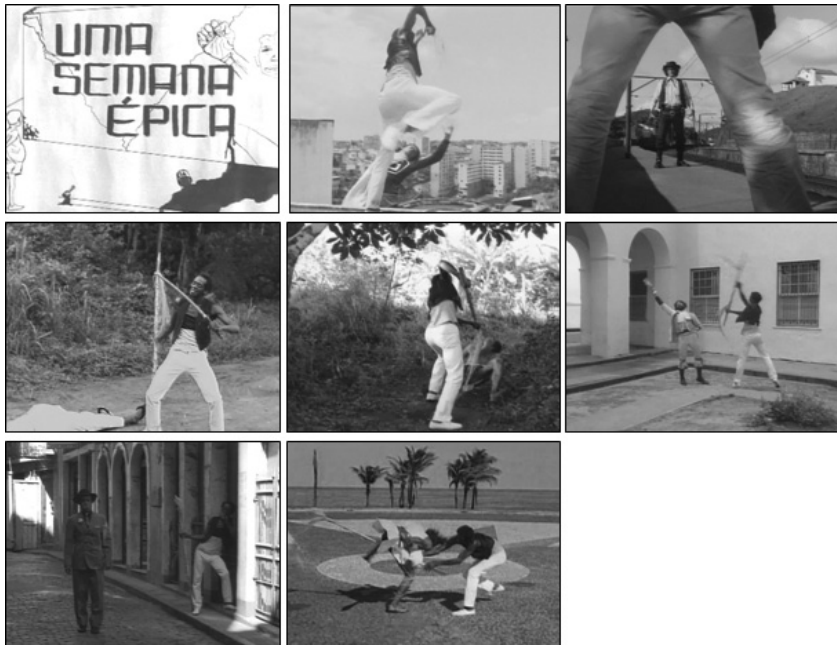
Fotogramas 14 a 21 – Uma semana épica.

Ao citar “personagens pragmáticos”, o autor se refere às cenas em que Calunga, a cada dia da semana, luta e derrota um personagem-símbolo da colonização, uma vez que foram criados ou explorados pela cinematografia norte-americana.