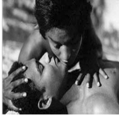
Fotogramas 6 e 7 – Cota seduz Aruã.

Barravento (1961) é um marco. Uma espécie de ponto de chegada e ao mesmo tempo ponto de partida. Resultados de um processo de renovação cultural baiano e, especialmente, do sonho quase impossível de fazer cinema na Bahia. Mas foi também uma abertura de caminhos, abertura de um novo cinema e de um novo cineasta que, com apenas vinte anos, foi capaz de fazer Barravento “e demonstraria com uma grande, premiada e controvertida obra, ter sido o mais brilhante aluno do tempo do aprender a fazer”. (CARVALHO, 1999, p. 241)