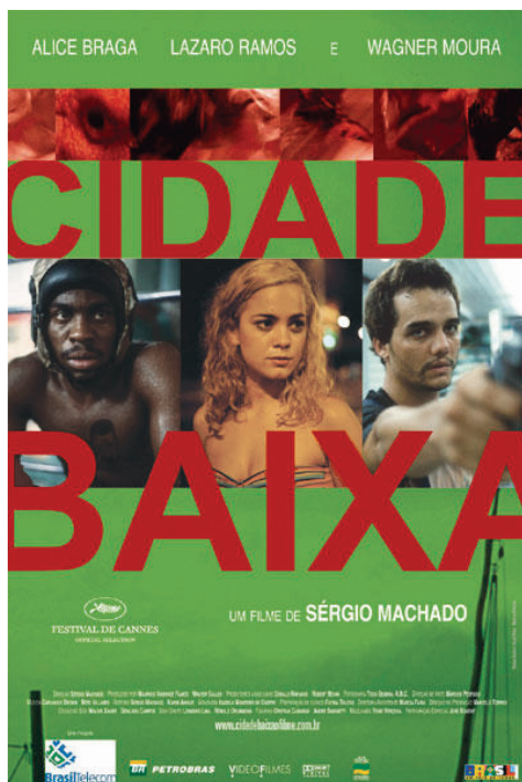
Figura 4 – Cartaz de Cidade Baixa .

O símbolo do Festival de Cannes, presente no cartaz, informa a conquista do Prêmio da Juventude, dentro do 58º Festival de Cinema de Cannes.