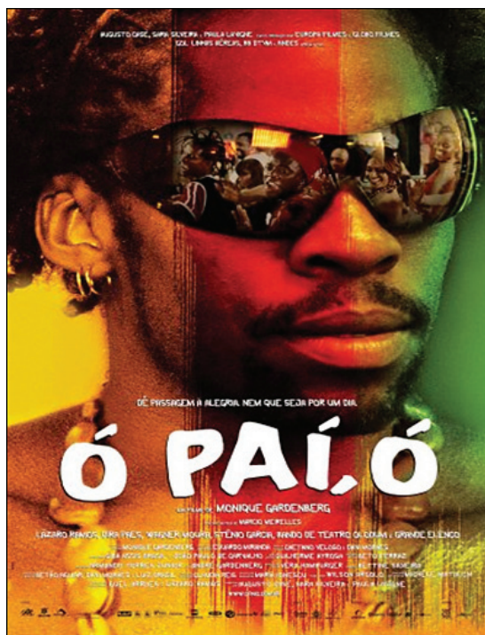
Figura 5 – Cartaz de Ó Paí, Ó .

É interessante porque apesar de o filme não ter apenas um protagonista e sim focar na comunidade como um todo, no cartaz, o personagem negro estilizado é quem representa o filme, e os óculos espelhados refletem a comunidade; é justamente como se ele olhasse nos olhos do outro e com os olhos do outro.