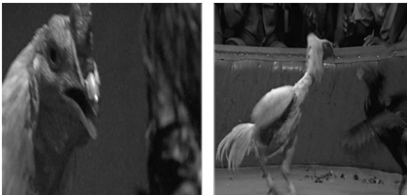
Fotogramas 28 e 29 – Rinha de briga de galos.

pelo homem a essa prática, são preparados e condicionados, há uma domesticação do instinto natural. Na cena, ao som de atabaques, o galo negro derrota o galo branco. É uma espécie de prelúdio de uma tragédia anunciada, já que mais tarde os próprios apostadores agirão com a mesma brutalidade dos galos, ambos motivados pelo entorno social que os envolvem.