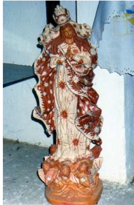
Figura 25 Nossa Senhora da Conceição. Modelada em terracota, pintada e queimada por Geraldo Machado da Silva.

Camandaroba 9 e Batistel (1999) trazem algumas informações que não coincidem com as anotações feitas durante a pesquisa quanto ao trabalho das louceiras. Mencionam a produção de telhas, trabalho realizado por homens nas olarias destinadas a este fim. Outra inadequação diz respeito à aplicação da tinta conseguida a partir do tauá diretamente com as mãos, quando na realidade para este fim as louceiras utilizam talisca de buriti: