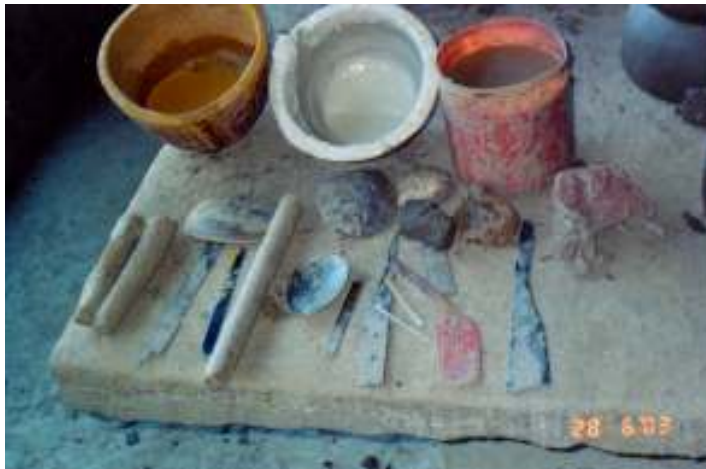
Figura 22 Implementos usados pelas mulheres na manufatura da cerâmica

Na (Fig. 23) tem-se a demonstração do uso de um dos implementos pela ceramista Maria Pereira, quando ainda exercia a atividade de louceira. Após todo processo de modelagem o pote é colocado para secar e, assim que a superfície apresentar certa rigidez, a ceramista raspa todo o bojo com um resto de faca com a finalidade de alisar a superfície externa da peça, sempre umedecendo o instrumento em um vaso com água.