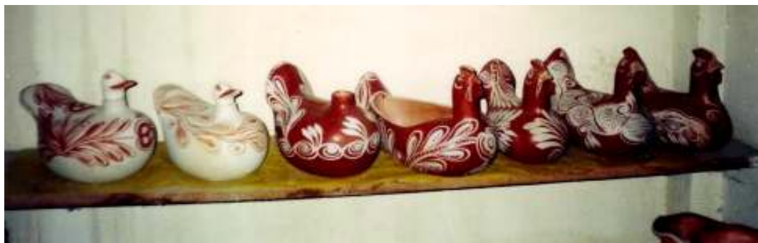
Figura 17 Moringas em formato zoomorfo de pato, galinha e galo.