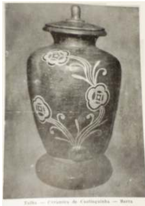
Figura 2 Talha produzida em Caatinguinha – Barra, registrada por Pereira (1957.1, p. 137).

A talha (Fig. 2), influência da louça portuguesa, produzida no antigo povoado de Caatinguinha apresenta em sua decoração elementos fitomorfos em tabatinga ou caulim sobre o engobo em tauá aplicado no bojo da peça. Durante a pesquisa de campo na cidade de Barra, não se registrou, dentre a produção cerâmica atual, a existência de peça com as mesmas características tipológicas desta talha produzida nos anos 50, do século XX.