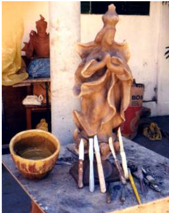
Figura 21 Instrumentos usados pelos homens na manufatura da cerâmica.

Unger (1978) relaciona os instrumentos ou implementos utilizados pelas louceiras, dentre eles encontram-se alisadores, polidores e raspadores.