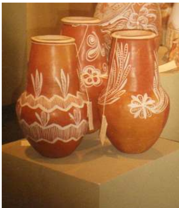
Figura 5 Pote produzido atualmente em Barra.

Os potes (Fig. 5) são exemplares dos que são produzidos atualmente pelas ceramistas na Associação dos Ceramistas Nossa Senhora de Fátima. Comparando-os com os potes produzidos no passado, percebem-se diferenças na forma do bojo da peça, pois o seu gargalo alonga-se até a metade do pote sendo menos acentuado do que os produzidos nos anos 1950. Quanto à decoração, percebe-se que ela é toda pintada com a presença de motivos geometrizarantes em ziguezague formando um conjunto com segmentos de linhas verticais paralelas, pontos alinhados na posição vertical e volutas em "cê" e de motivos naturalistas com a estilização de elementos fitomorfos, tais como ramos, folhas e flores.