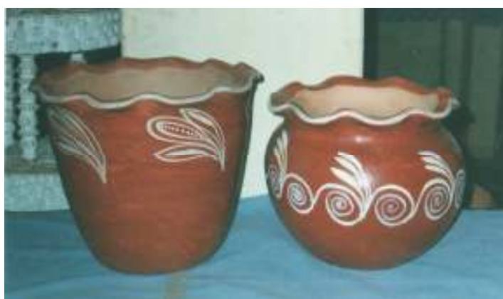
Figura 7 Cachipôs com elementos decorativos e tipologia distintas, numa confirmação da diversidade de formas aplicadas às peças.

Etchevarne (1994, p. 40) ao considerar o estudo realizado por Valentin Calderón em Periperi nos anos 1960, refere-se à tradição tupi-guarani como a que teria se difundido no oeste da Bahia ao longo dos rios que deságuam no oceano e que, apesar da aculturação portuguesa, pode ser percebida em maior ou menor escala em algumas peças que apresentam indícios da tradição indígena. Na Barra, por exemplo, a sobreposição de roletes e uso de pigmentos argilosos são reminiscências desta tradição. Os Cachipôs (Fig. 7) apresentam tipologias distintas com decoração pintada em tabatinga sobre o engobo em tauá. Os lábios das peças possuem formato ondulado e fundo plano. Os motivos decorativos são fitomorfos, diferenciando-se a aplicação de volutas seqüenciais na peça à direita e pontos alinhados no cachipô da esquerda.