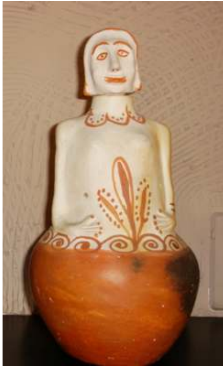
Figura 13 Moringa moça de autoria das ceramistas de Barra, produzida no início da intervenção do Instituto Mauá