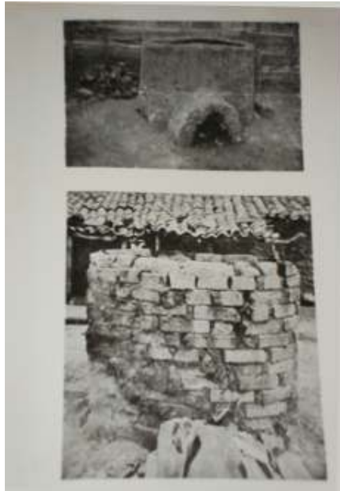
Figura 28 Fornos Sertanejos registrados por Pereira (1957.2, p. 48).

Na Associação dos Ceramistas Nossa Senhora de Fátima foram encontrados três tipos de fornos, construídos com cimento e tijolos, sendo que dois são fechados e um aberto, sendo que dois destes forno já foram mencionados em trecho acima. O aberto conhecido como forno sertanejo é o que está atualmente em uso, sua forma é circular e foi construído com tijolos e cimento e revestido com barro, tem altura aproximada de um metro e sua boca constitui-se por uma abertura na parte inferior da parede circular do forno e serve para introduzir a lenha. As peças são dispostas dentro do forno sobre uma grelha, formada de pequenos orifícios que permitem a passagem do calor durante a queima.