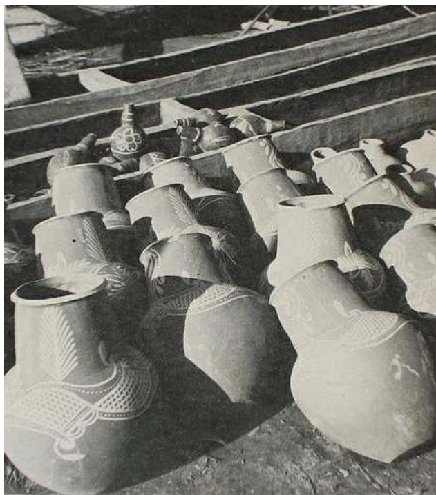
Figura 4 Cerâmica utilitária às margens do São Francisco

Em Artesanato Brasileiro (1986, p 48) foi encontrada a imagem de alguns potes com as mesmas características da (Fig. 4) encontrado em Pereira (1957b). A legenda da imagem refere-se ao transporte feito em canoas através do Rio São Francisco, à comercialização realizada na região de Xique-Xique e à decoração à base de tauá.