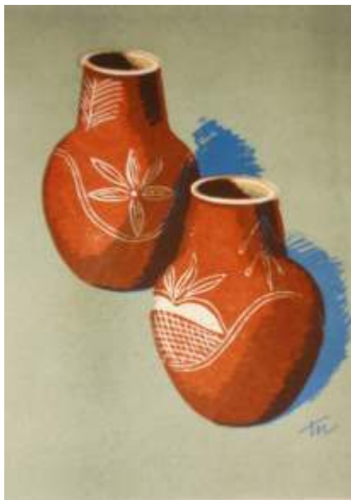
Figura 3 Pote, cerâmica da Barra, Pereira (1957.2, p. 41)

Em Artesanato Brasileiro (1986, p 48) foi encontrada a imagem de alguns potes com as mesmas características da (Fig. 4) encontrado em Pereira (1957b). A legenda da imagem refere-se ao transporte feito em canoas através do Rio São Francisco, à comercialização realizada na região de Xique-Xique e à decoração à base de tauá.