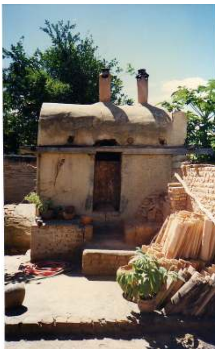
Figura 27 Forno de origem portuguesa com uma boca e entrada lateral para colocação das peças. Capacidade para seis dúzias de potes.

De acordo com a ceramista Cida, na entrevista concedida no ano de 2003, a lenha para a queima das peças é comprada no metro a R$ 5,00, utilizam, para este fim, qualquer árvore nativa da região, até mesmo a lenha que resulta da poda das árvores que compõem a vegetação dos locais públicos. Usam, geralmente, ripas de madeira, goiabeira e laranjeira. Cada queima consome dois metros de lenha.