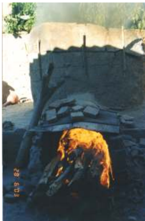
Figura 30 "Buchada", momento durante a queima em que as peças ficam limpas.