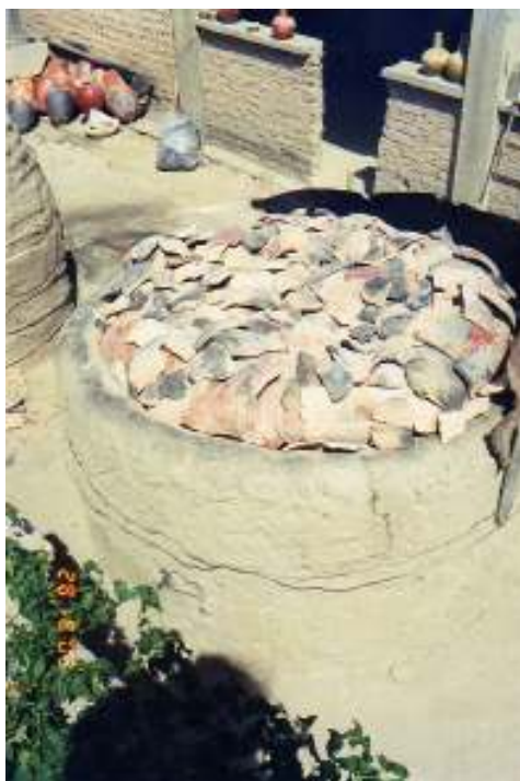
Figura 29 Queima em forno sertanejo na Associação Nossa Senhora de Fátima.

A "buchada", processo durante a queima em que as peças são limpas, exige do ceramista uma atenção redobrada para que não se perca o ponto certo em que o forno deve ser desligado. A artesã Cida descreveu todo o procedimento da "buchada" em depoimento, no ano de 2003, transcrito abaixo: