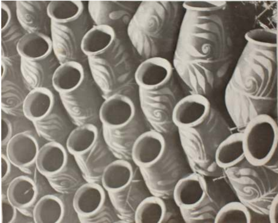
Figura 9 Potes de Xique-Xique na feira de Água de Meninos, Salvador – Bahia. Meireles (1952)

Atualmente, a arte da cerâmica encontra-se extinta na cidade de Xique-Xique, de acordo com observações colhidas no local. A última ceramista ainda em atividade, migrou para São Paulo, onde já se encontravam seus filhos. Hoje, na sede do município persiste ainda o trabalho com telhas e tijolos, realizado por homens. As peças comercializadas na cidade de Xique-Xique são provenientes de povoados pertencentes ao município de Barra, a saber: Capricho, União, Nova União e Passagem.