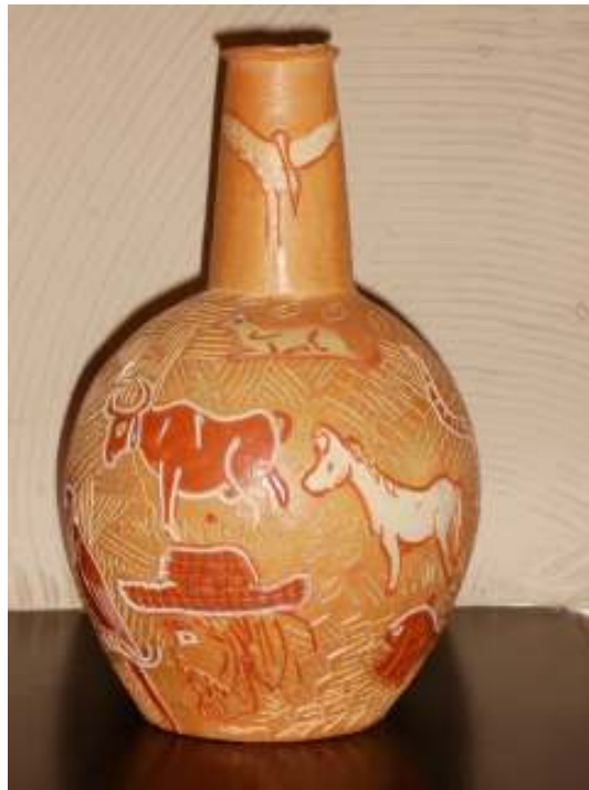
Figura 12 Moringa com decoração antropomorfa e zoomorfa, Instituto Mauá - Pelourinho - 2006

No catálogo de exposição: Louça de perfeição: a cerâmica baiana do Município da Barra (1996), o antropólogo da FUNARTE, Ricardo Lima apresenta os ceramistas da cidade de Barra e o interesse do Instituto de Artesanato Visconde de Mauá de restaurar as antigas tradições artesanais através da abertura de mercado e escoamento da produção. Confirma também o comentário feito anteriormente sobre a introdução da manufatura da imaginária sacra e do candomblé que reforça a não existência de registro sobre esta produção na cidade de Barra, como se pode apurar no intervalo: