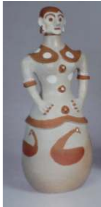
Figura 14 Moringa moça do Vale do Jequitinhonha - Minas Gerais.

Dantas (1980, p. 19) afirma que em tempos remotos registrou-se a produção da moringa antropomorfa no município alagoano de Carrapicho, no baixo São Francisco, de autoria do ceramista Abílio Freitas, cujo gargalo de cabeça representava uma baiana.