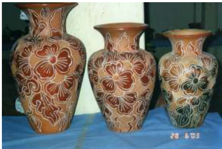
Figura 19 Jogo de vasos com três peças produzido atualmente pelas ceramistas de Barra

decorativos são os geometrizarantes reticulados na posição oblíqua e os motivos naturalistas com desenhos fitomorfos, tais como flores de boa noite e folhas de picão 8 espécie de vegetação local.