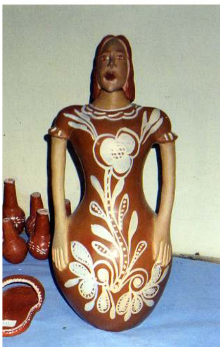
Figura 15 Moringa moça produzida no ano de 2003 na sede da Associação em Barra.

premiação encontra-se na Diocese de Barra e a sua datação conta do dia 03 de março de 2001, segundo informa a artesã Cida, na entrevista concedida no ano de 2003.