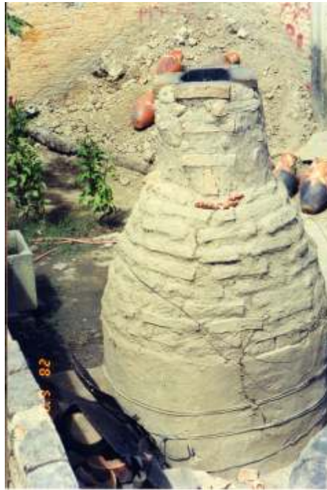
Figura 18 Forno construído nos anos 1970, quando os religiosos organizaram os ceramistas no terreno da Igreja Nossa Senhora de Fátima

Dando seguimento ao texto, Lima (1996, p. 17). descreve, como se encontrava a produção antes da chegada do Instituto Mauá, como se constata a seguir: