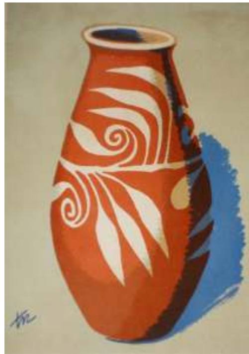
Figura 8 Pote. Cerâmica de Xique-Xique. Pereira (1957. 2, p. 45).

encontrada no livro Artes Plásticas no Brasil , 1952, no capítulo sobre Arte Popular escrito por Cecília Meireles.