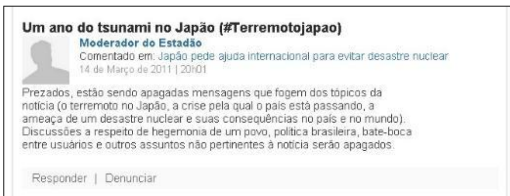
Figura 8: Recorte de postagem do perfil “Moderador do Estadão”.

Em O Estado de S. Paulo , é preciso estar logado para enviar a denúncia. Uma vez pressionado o botão “Denunciar”, o usuário precisa digitar uma justificativa de até 1.200 caracteres. Em O Globo , é necessário estar logado para que o botão “denunciar” apareça; na sequência é necessário enviar uma justificativa de até 200 caracteres para que o moderador avalie o caso. Após a apreciação da denúncia, a ação dos moderadores nem sempre é visível porque os comentários simplesmente somem. Contudo, em algumas situações as ações da moderação são perceptíveis em caixas de mensagem sem conteúdo. Especialmente na plataforma de O Estado de S. Paulo , o moderador age por meio de um perfil que explica e adverte quanto à possibilidade de supressão de comentários por não estarem de acordo o entendimento do jornal (ver Figura 8).