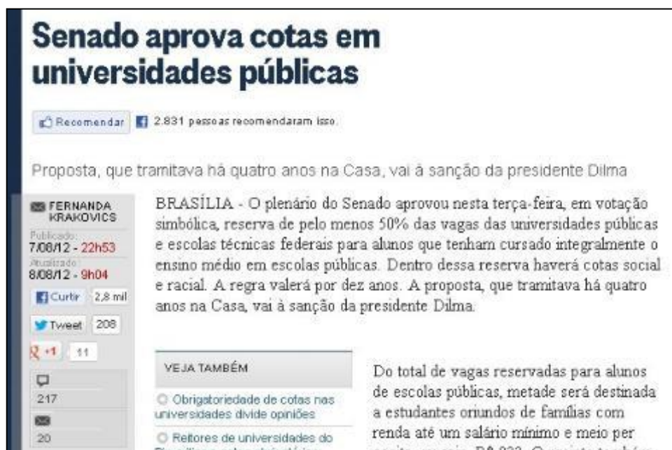
Figura 6: Recorte do cabeçalho padrão de uma matéria no site do jornal O Globo .

disseminação de matérias e comentários. No site da Folha , todas as matérias apresentam logo abaixo do título e da assinatura dos autores dois botões. O primeiro para que o usuário possa recomendar o conteúdo para sua rede pessoal no Facebook; e o segundo para endossar o conteúdo para o site de rede social da Google, o Google Plus. Contudo, a variedade de sites sociais, por assim dizer, é ainda maior. Na barra superior, abaixo da etiqueta da editoria, tem alguns botões que facilitam a postagem no Twitter, Facebook, Orkut, assinatura do feed da editoria, e o botão com sinal de mais que, ao passar o ponteiro do mouse, permite a postagem também no Delicious, Windows Live, MySpace, Google e Digg.