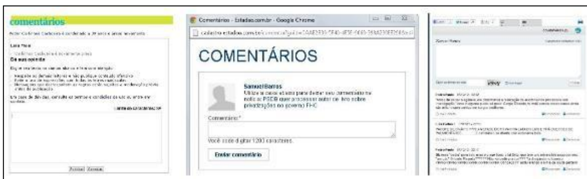
Figura 1: Recorte da caixa de texto para a publicação de comentários dos jornais Folha de S. Paulo , O Estado de S. Paulo e O Globo , respectivamente.

Seguindo o encadeamento lógico dos elementos que demandam a atenção deste trabalho, conforme a metodologia, passa-se à uma avaliação da usabilidade das plataformas em estudo. A partir do trabalho de Aichholzer & Westholm (2011), tomou-se os seguintes critérios: facilidade de navegação e organização dos conteúdos; e eficiência, entendida como o tempo gasto para uma determinada atividade.