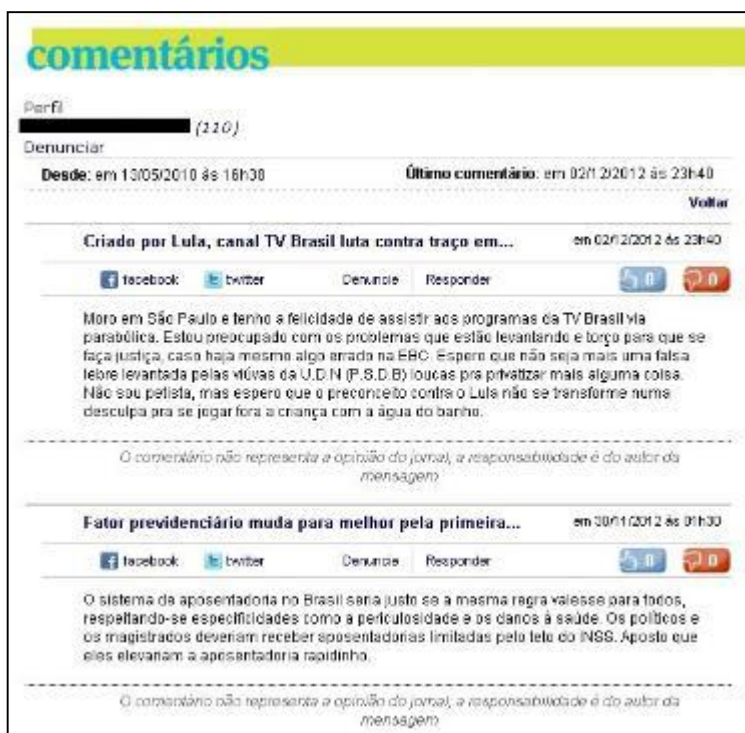
Figura 2: Recorte do perfil de um comentador na plataforma do jornal Folha de S. Paulo . O nome do usuário foi suprimido.

A Folha e o Estadão têm uma particularidade: o comentário não é feito na mesma janela onde se encontram os demais comentários ou a matéria (ver Figura 1). No caso da Folha , abre-se uma página na mesma janela da matéria e dos comentários. Já no caso do Estadão , abre-se uma janela tipo pop-up onde se digita e envia o comentário. Com isso, a construção de comentários levando em conta os anteriores ou a matéria fica dificultada.