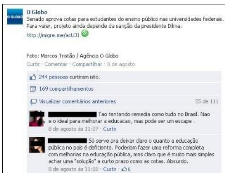
Figura 4: Recorte de postagem do jornal O Globo em sua página no Facebook.

No site do jornal O Globo , os comentários são identificados com nome do autor, data e hora da postagem. É possível comentar a matéria ou um comentário em particular através do botão “responder”. Diferente da Folha e Estadão , não é possível recuperar maiores informações sobre os usuários, a exemplo de comentários anteriores. Os usuários não têm perfil, não conseguem reunir em um lugar as próprias postagens, nem pode acompanhar de modo sistematizado as postagens de outros.