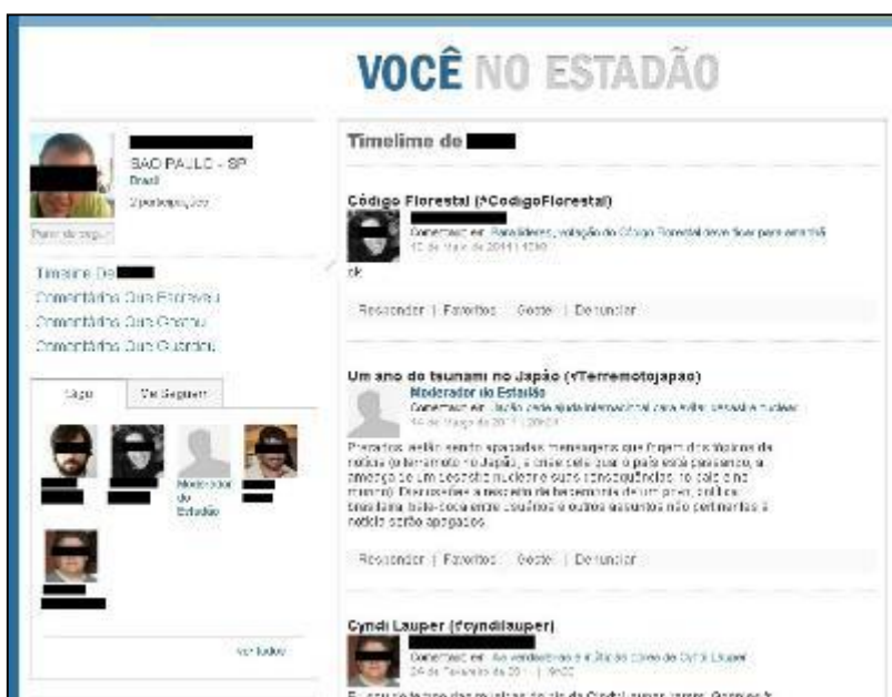
Figura 3: Recorte de perfil na comunidade de comentadores do jornal O Estado de S. Paulo . Os nomes e as fotos dos usuários foram alterados para não ser possível a identificação.

comentários na plataforma, além de que o nome é linkado a um perfil do autor, onde se pode ler todos os comentários do autor em diferentes matérias, a data de entrada na plataforma e do último comentário (ver Figura 2). Para cada comentário, é possível dar uma resposta direta através do botão “responder”, ou um simples endossamento positivo (botão azul) ou negativo (botão vermelho).