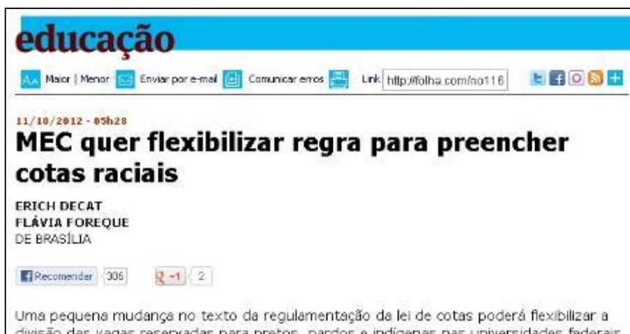
Figura 5: Recorte do cabeçalho padrão de uma matéria no site do jornal Folha de S. Paulo .

Segundo Zago (2011), esta atividade de seleção, postagem ou compartilhamento que cada indivíduo pode fazer se caracteriza como um filtro social dos conteúdos jornalísticos que são distribuídos através das redes pessoais. Tal dinâmica potencializa também a discussão de determinados temas em um sem-número de situações interativas.