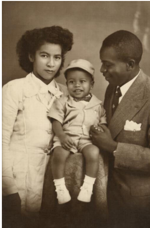
Ilustração 9 – O ‘Trio Santos’, c. 1950.