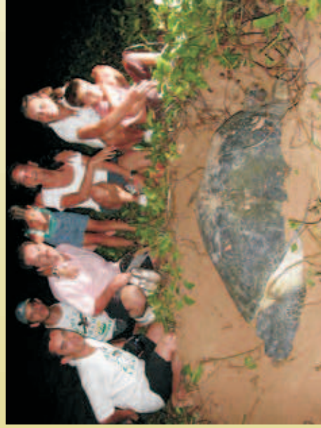
Figura 31 - Turistas acompanhando as atividades de conservação das tartarugas marinhas na Praia do Leão em Fernando de Noronha.