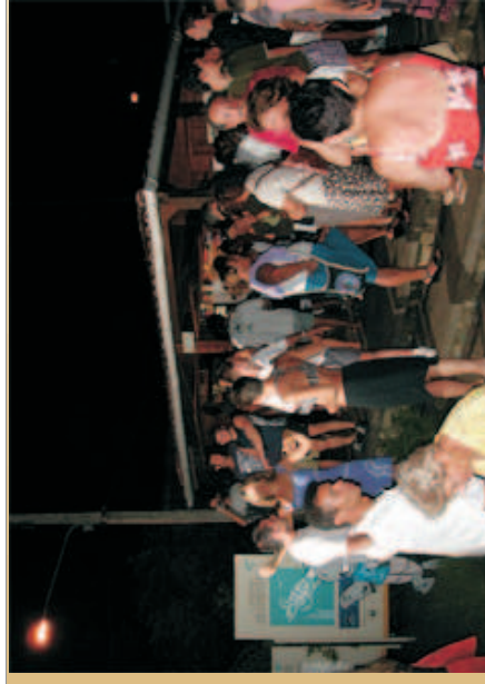
Figura 32 - Movimentação noturna de turistas no Centro de Visitantes do Projeto TAMAR em F.Noronha.