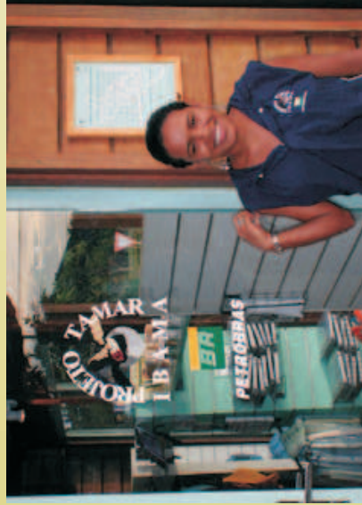
Figura 29 - Loja TAMAR em Fernando de Noronha com a vendedora local em destaque.

Através de estratégias institucionais cria-se o ambiente para estimular a realização de atividades paralelas: