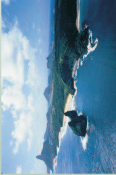
Figura 25 - Vista aérea de Fernando de Noronha.

... trabalhar com a conservação da tartaruga. A gente tá vendo que está fazendo um trabalho em prol de uma coisa assim de benefícios de um programa de conservação, então é um trabalho diferente. Então é isso, não é assim um trabalho que gera lucros em benefício próprio assim. Não, é em questão de uma conservação, de animais em extinção e é um trabalho diferente