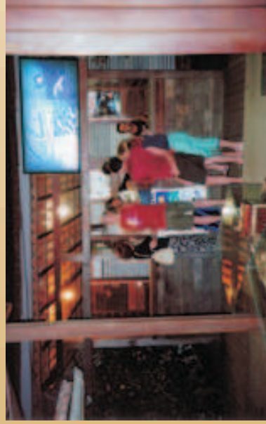
Figura 33 - Boxes da ACITUR e da Associação de Empresas de Mergulho no Centro de Visitantes do Projeto TAMAR de Fernando de Noronha.