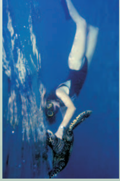
Figura 26 - Conservação da tartaruga marinha, Fernando de Noronha.

Total de Empregos Gerados pelo Projeto TAMAR em Fernando de Noronha: Total: 32