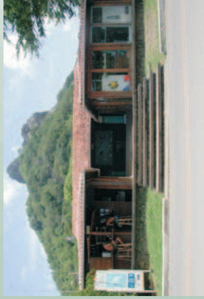
Figura 27 - Centro de Visitantes de Fernando de Noronha.

Atua de forma direta através de ações realizadas pela instituição: