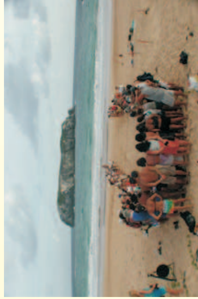
Figura 36 - Turistas acompanhando o nascimento e liberação de filhotes de tartarugas marinhas na Praia do Leão.