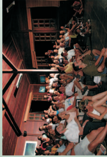
Figura 28 - Realização de palestras no Centro de Visitantes.