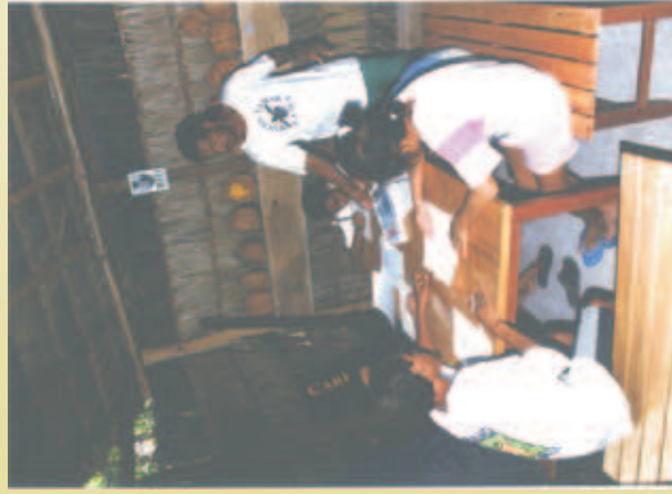
Figura 60 - Grupo Produtivo - Oficina de Artesanato em Côco.