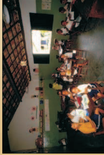
Figura 62 - Sala de aula da "Creche Praia do Forte" -Associação dos Amigos das Crianças de Praia do Forte.