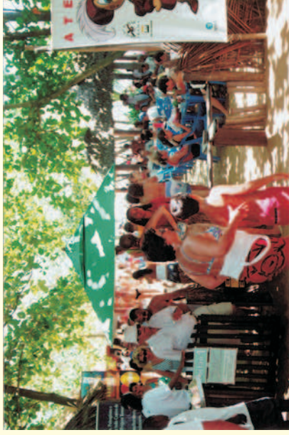
Figura 66 - Movimentação de turistas no acesso do Centro de Visitantes do Projeto TAMAR.

Depoimentos de: Edmeire Nunes de Oliveira