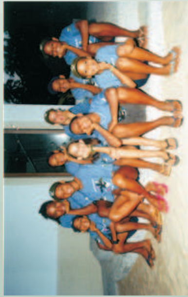
Figura 58 - Os Guias Mirins do Centro de Visitantes de Praia do Forte, filhos da comunidade local. Fonte: Banco de Imagens do Projeto TAMAR - ano 2001.

Depoimentos de: Edmeire Nunes de Oliveira