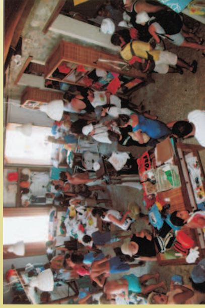
Figura 59 - Vista interna da Loja do Centro de Visitantes do Projeto TAMAR de Praia do Forte. Turistas realizando compras.

Depoimentos de: Edmeire Nunes de Oliveira