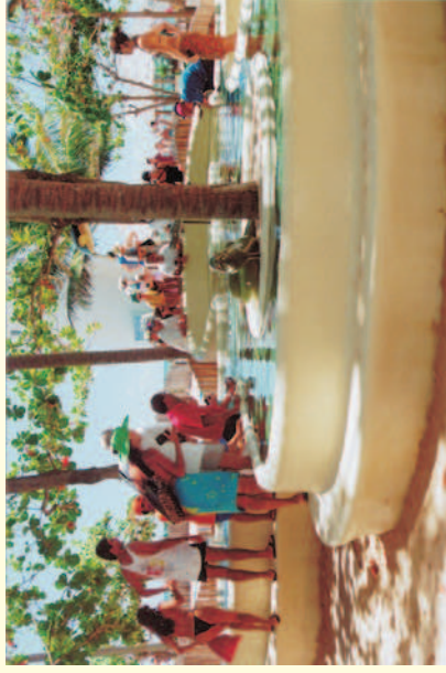
Figura 65 - Contemplação dos turistas nos aquários do Centro de Visitantes do Projeto TAMAR. Fonte: Banco de Imagens do Projeto TAMAR - ano 2002.

Depoimentos de: Edmeire Nunes de Oliveira