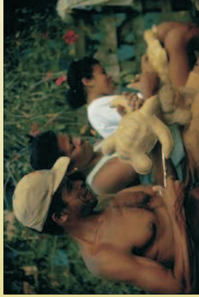
Figura 61 - Grupo Produtivo Oficina de Artesanato em Papel Machê.