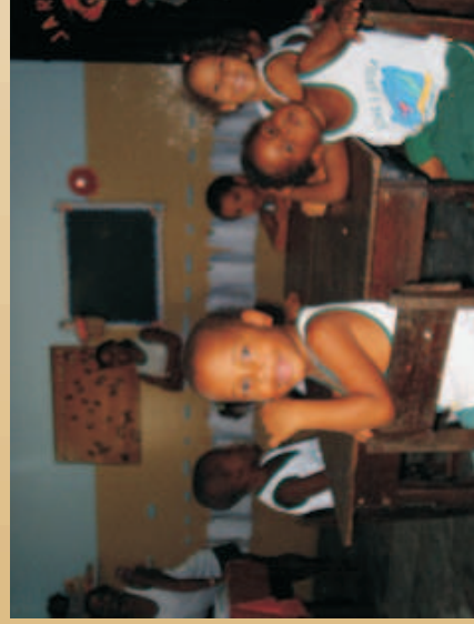
Figura 63 - Alunos da "Creche Praia do Forte" -Associação dos Amigos das Crianças de Praia do Forte

Depoimentos de: Edmeire Nunes de Oliveira