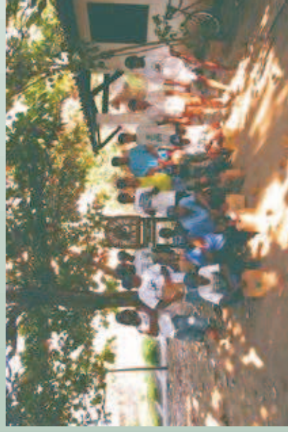
Figura 56 - Inclusão Social - Os Tartarugueiros de Praia do Forte.

Depoimentos de: Edmeire Nunes de Oliveira