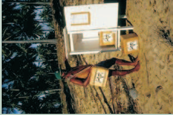
Figura 57 - Tartarugueiro na praia.

Depoimentos de: Edmeire Nunes de Oliveira