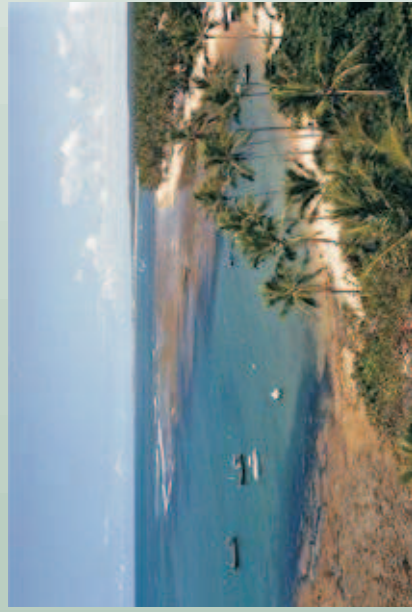
Figura 55 - Vista do Porto de Praia do Forte (BA).