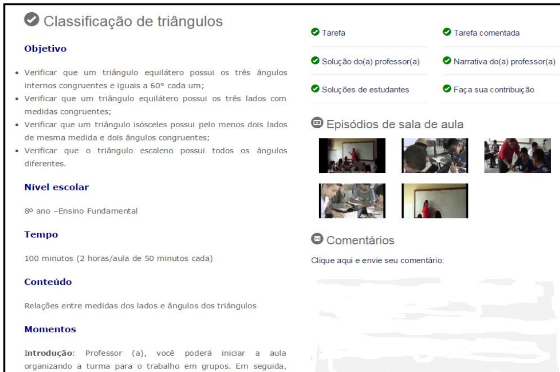
Figura 2 – Exemplo de como o MCE está organizado no site