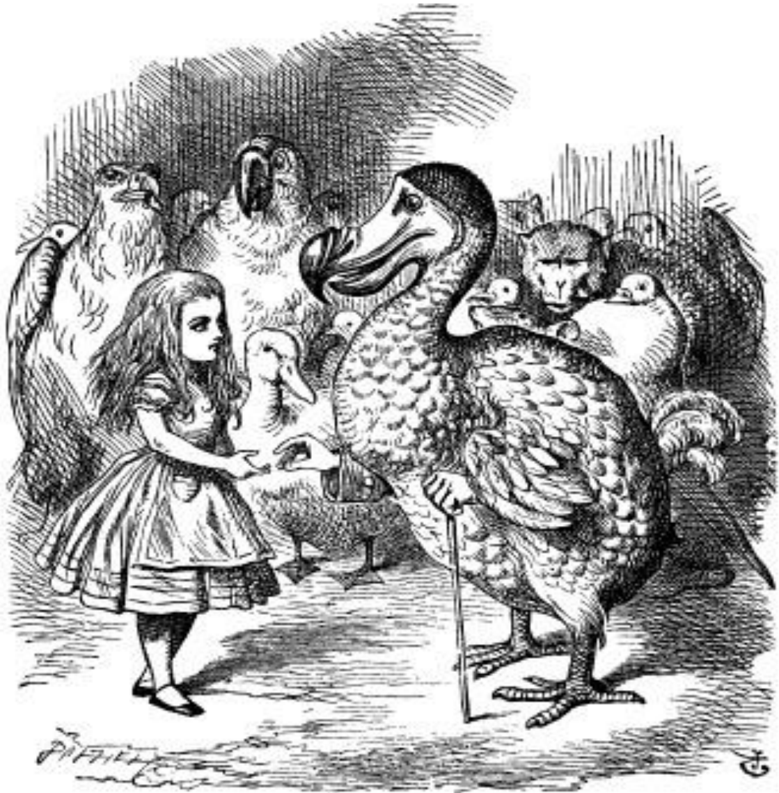
(CARROLL, 2013, p. 25)

Não aguento ser apenas um sujeito que abre portas, que puxa válvulas, que olha o relógio, que compra pão às 6 da tarde, que vai lá fora, que aponta lápis, que vê a uva etc. etc. Perdoai. Mas eu preciso ser Outros.