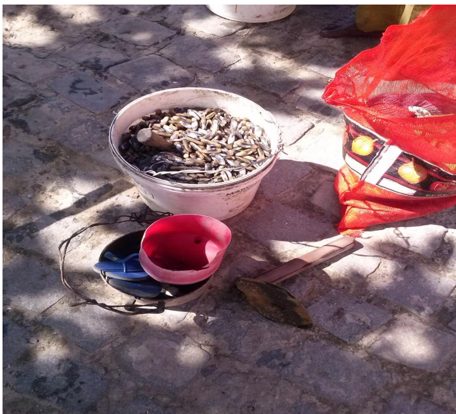
Figura 13-Balde com Mapé e instrumentos utilizados para captura, ago. 2014