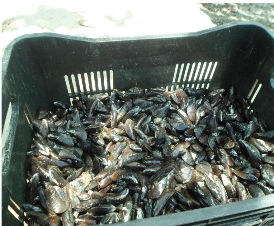
Figura 11-Sururu coletado, após lavagem, dez. 2014