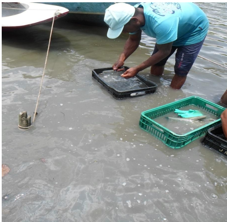
Figura 10- Limpeza do Sururu ( Mytella sp. ), na chegada do mangue, dez. 2014