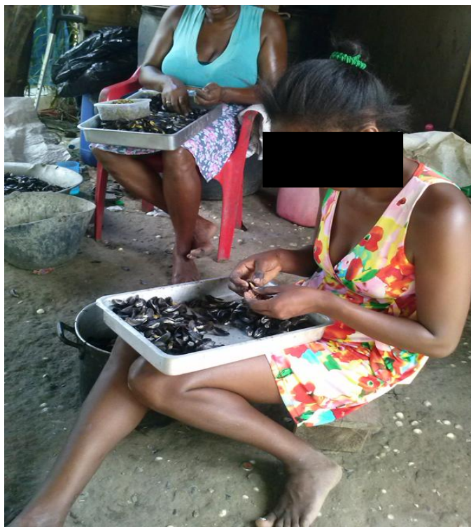
Figura 15-Marisqueiras retirando casca do Sururu no quintal de casa, dez 2015