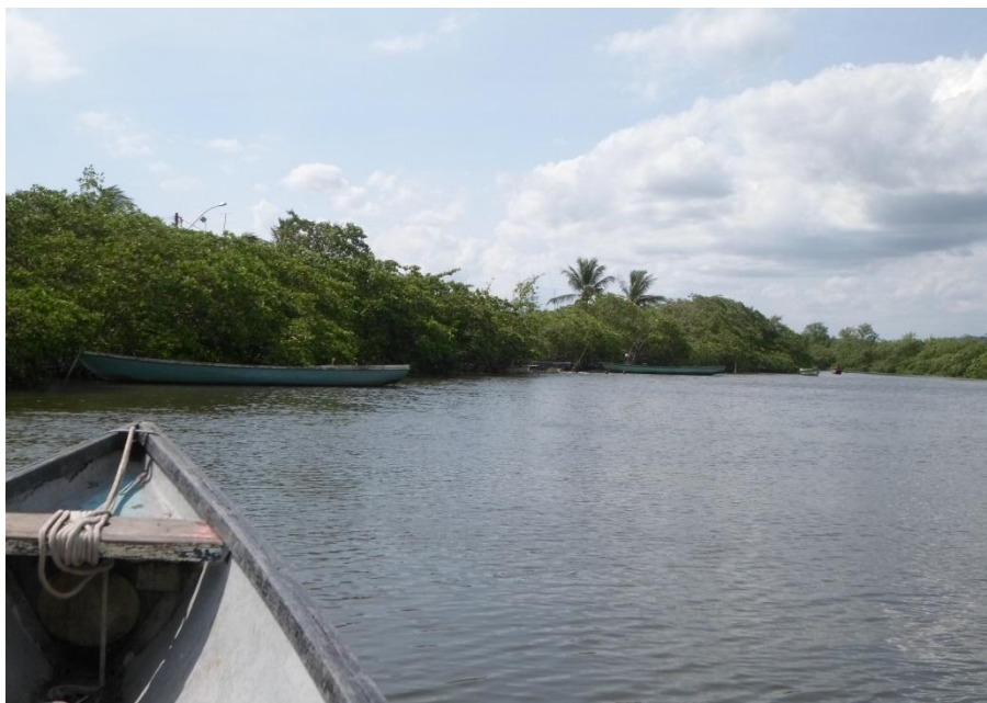
Figura 4- Vista da Caeira pelo estuário Subaé, jul. 2014