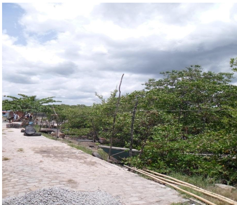
Figura 3- Caes beirando casas da Caeira, out. 2014