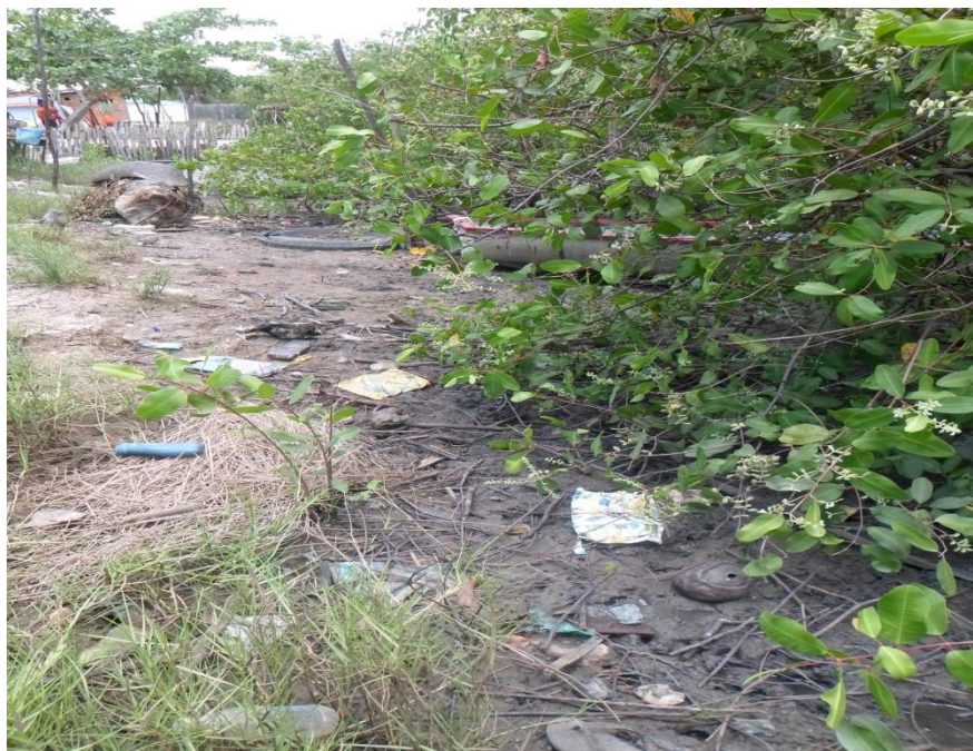
Figura 5- Resíduos sólidos trazidos no rio, beirando as casas da Caeira, set. 2014