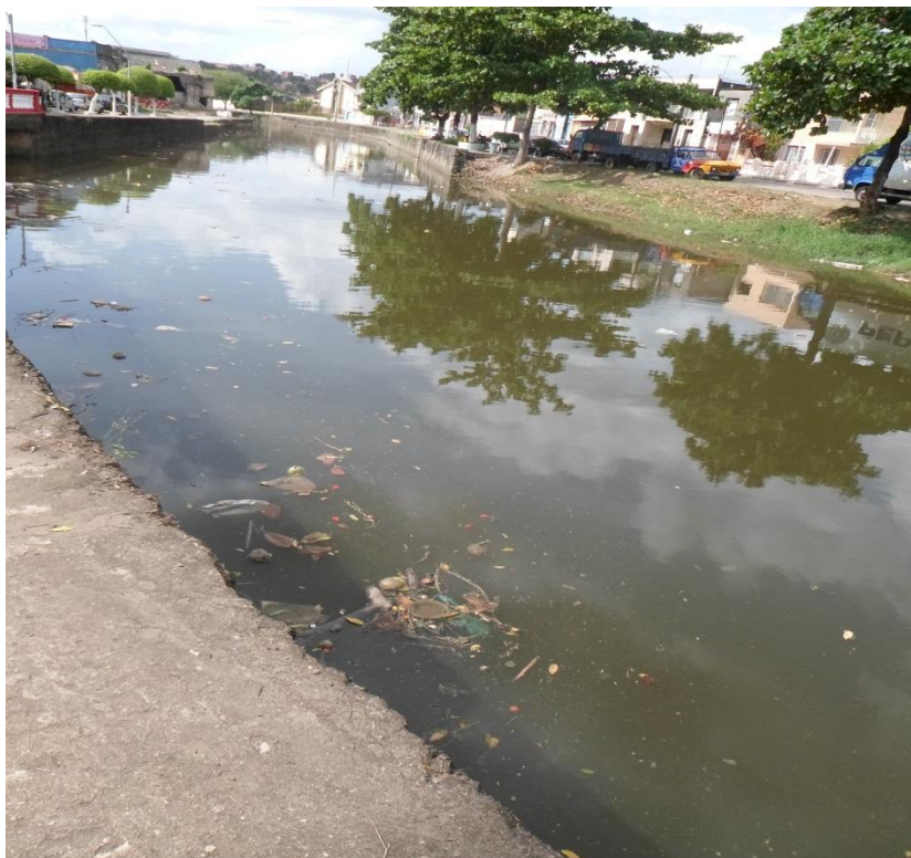
Figura 8- Rio Subaé no centro da cidade de Santo Amaro, jan. 2015