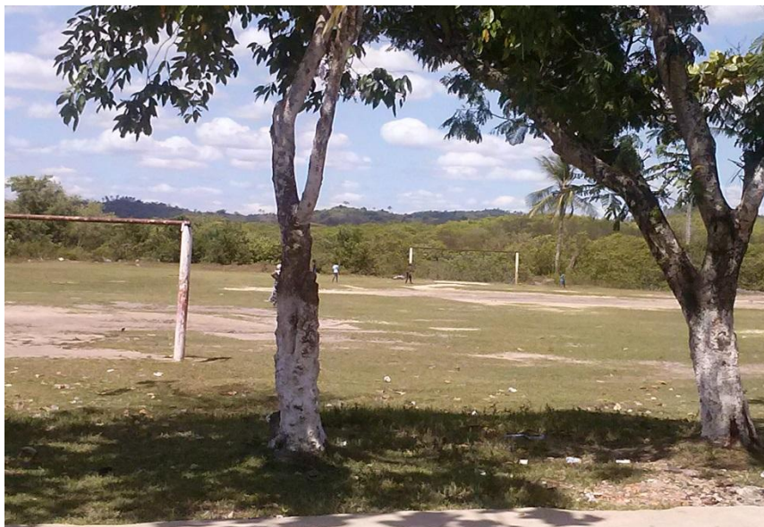
Figura 18- Campo de futebol, área de lazer da Caeira e mangue ao fundo, jan. 2015