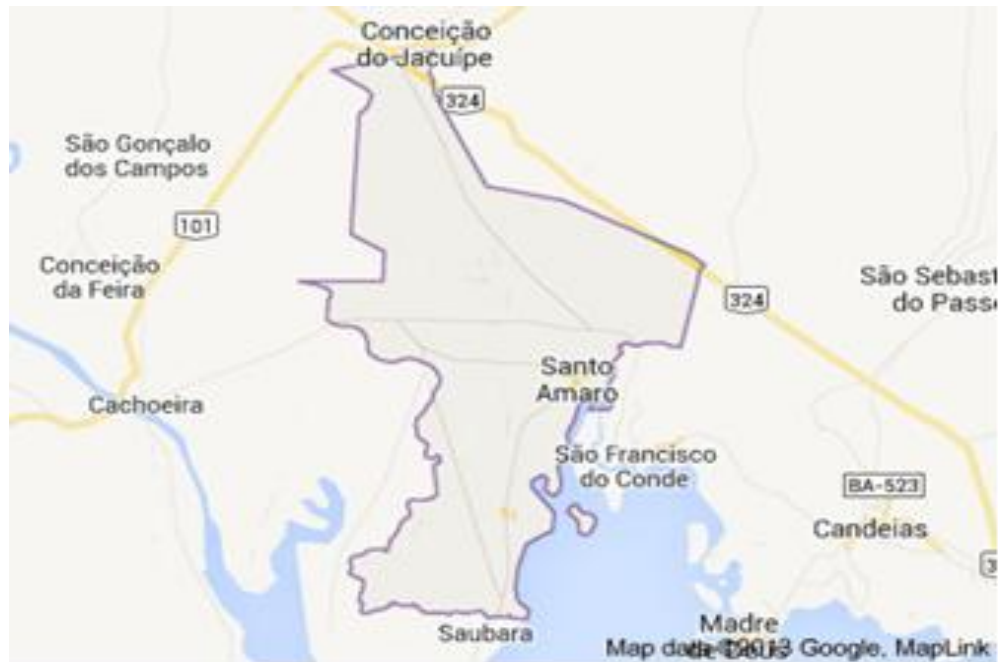
FIGURA 1 - Mapa da Baía de Todos os Santos (BTS) no destaque o Município de Santo Amaro-Ba.

pecuária, mariscagem e pesca (SUPERINTENDÊNCIA DE ESTUDOS ECONÔMICOS E SOCIAIS DA BAHIA-SEI, 2010).