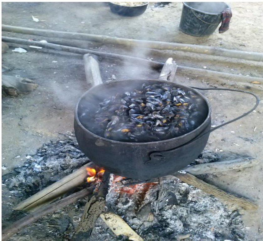
Figura 14-Beneficiamento do Sururu, Cozimento, dez. 2014