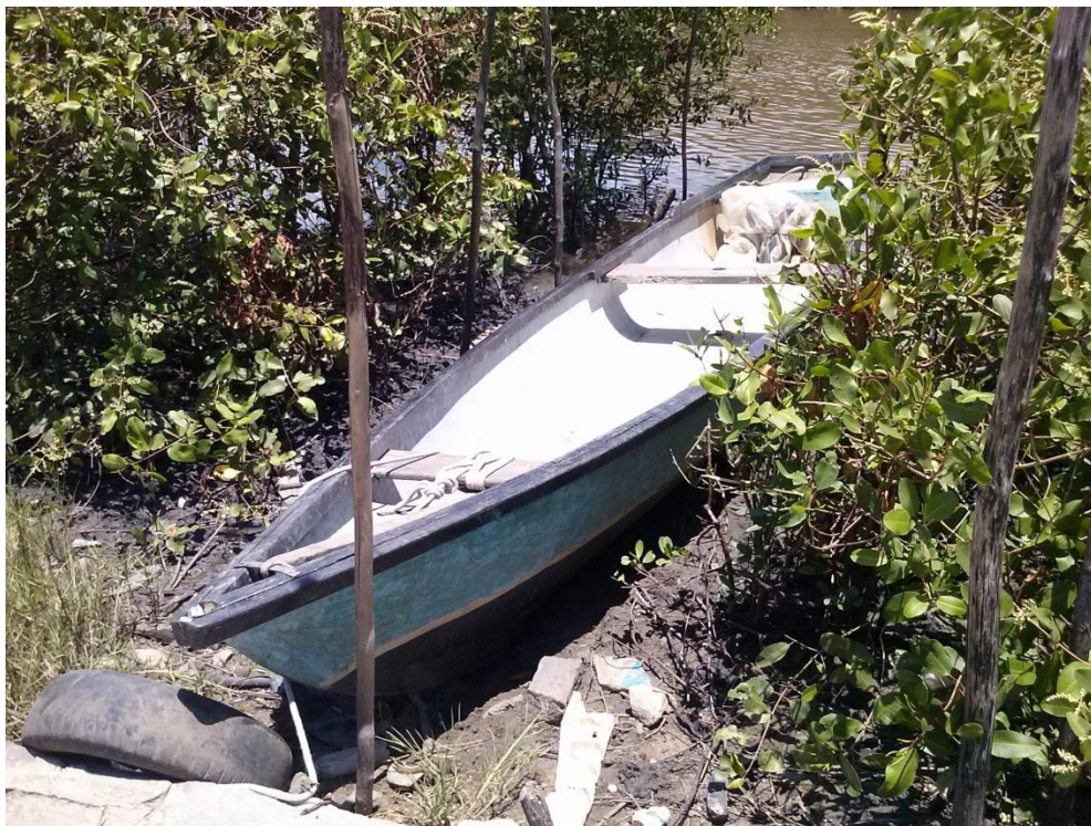
Figura 16-Embarcação utilizada para ida ao manguezal e a coroa, jan. 2015