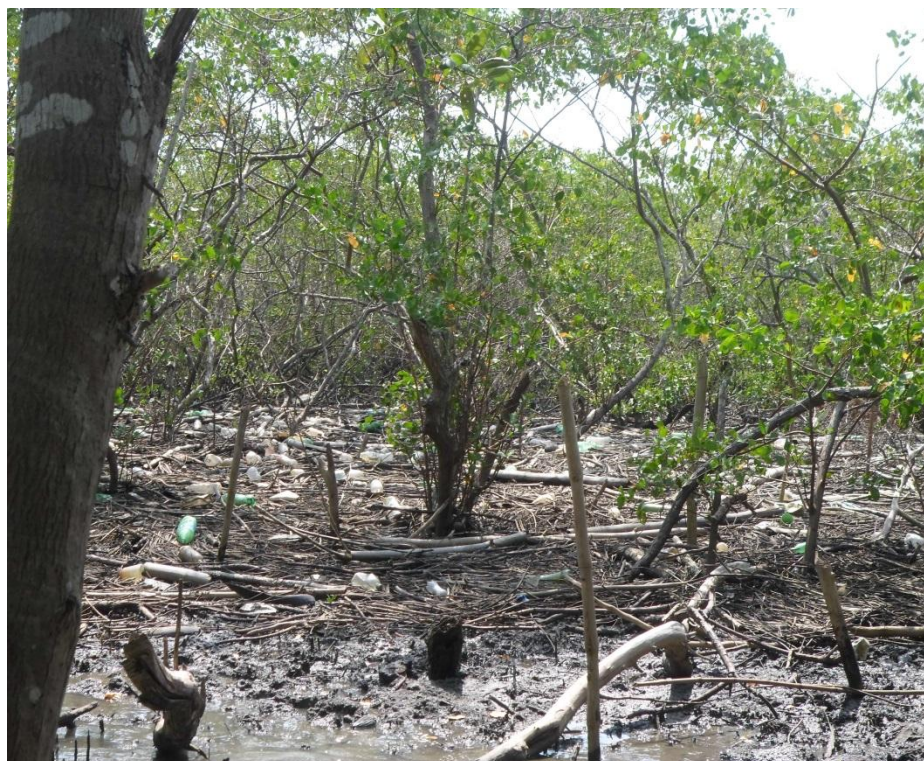
Figura 7-Manguezal com presença de garrafas plásticas e outros resíduos, jan. 2015