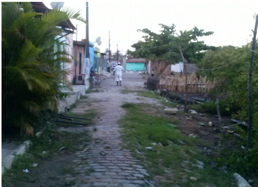
Figura 2- Caeira, final da rua, jan. 2014

Fotos produzidas pela autora durante a permanência no campo