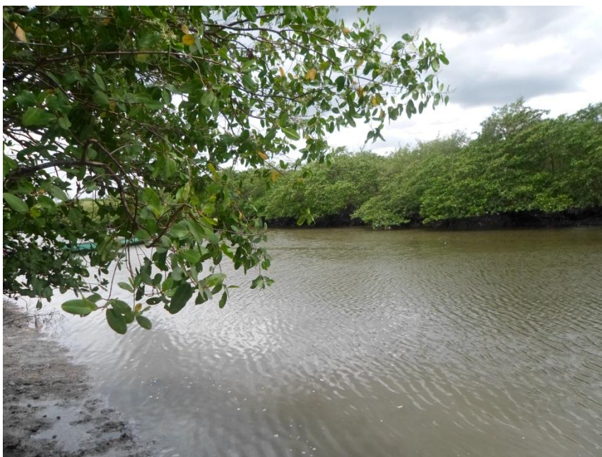
Figura 6-Manguezal próximo a Caeira, fev.2014