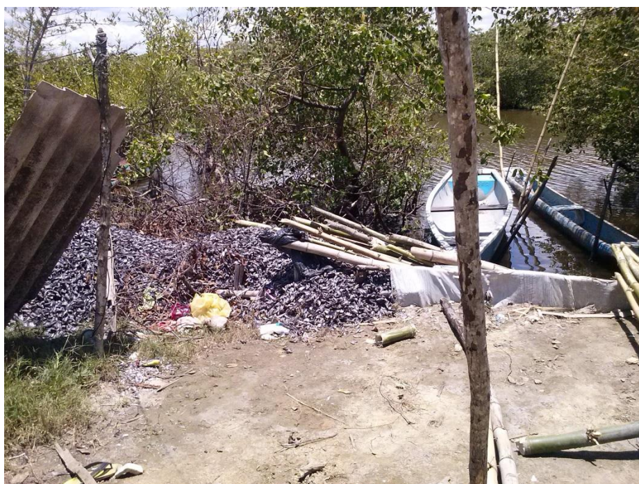
Figura 17- Casca de Sururu, descartadas em terreno na frente das casas, jan.2015