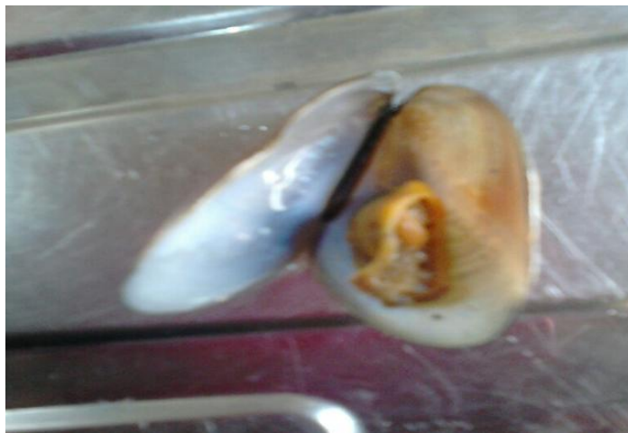
Figura 12-Sururu ( Mytella sp. ), jan. 2015