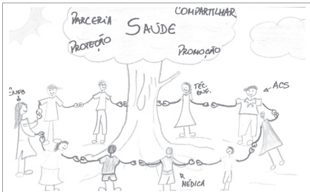
Figura 3 - A arte do cuidado

O vínculo é grande facilitador do cuidado, pois confere a relação, a confiança e o desvelo necessários à práxis transformadora e mobilizadora das capacidades do sujeito no intuito de promover e manter sua saúde, entendida como o conjunto de forças físicas, afetivas, psíquicas e sociais que podem ser ativadas para compensar a doença. 13