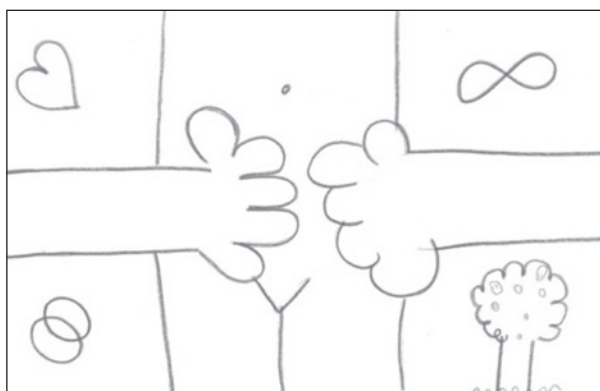
Figura 4 - Todos nós

Ficou bonitinho [risos]! Bom, o desenho significa um abraço fraterno entre a comunidade e os profissionais de saúde. Cada um representando o seu papel profissional; mas a gente tá no mesmo patamar, a gente tá no mesmo círculo [...] e a gente tá de mão dada pra estar passando ajuda, um auxilia o outro, a gente auxilia a comunidade, a comunidade auxilia a gente, com conhecimento, com prática, com vivência, com história [...]. A árvore no meio, é saúde, promoção à saúde, proteção à saúde, parceria coletiva e compartilhamento de saberes [pausa de voz]. Ah! O sol e a nuvem [...] deu mais clareza ao desenho, deu mais vida, porque o sol tá brilhando, o dia tá alegre, então é otimismo [risos] (Conhecimento).