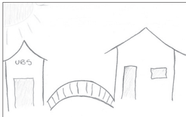
Figura 2 - A ponte do cuidado